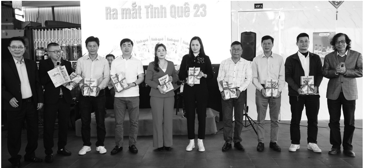
Hội doanh nghiệp Quảng Trị tại Đà Nẵng ra mắt giai phẩm "Tỉnh quê 23".

Hội doanh nghiệp Quảng Trị tại Đà Nẵng ra đời hơn hai năm (tháng 4.2021), trong bối cảnh thế giới trải qua nhiều biến động phức tạp. Khi mà toàn xã hội trải qua thời kỳ khó khăn nhất thì các doanh nhân, doanh nghiệp cũng không phải ngoại lệ, họ cũng đang phải đối mặt với rất nhiều thách thức để duy trì sản xuất và kinh doanh, tồn tại và phát triển. Trong tình hình đó, Hội doanh nghiệp Quảng Trị tại Đà Nẵng (sau đây gọi là Hội) đã có nhiều hoạt động nhằm thúc đẩy để kết nối, hợp tác giữa các hội viên để đồng hành, phát triển.