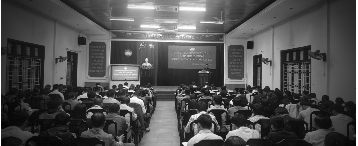
Tập huấn nghiệp vụ công tác Mặt trận cho cán bộ Mặt trận các cấp trong tỉnh năm 2023. Ảnh PN

Trong suốt quá trình lãnh đạo cách mạng Việt Nam, công tác cán bộ và xây dựng đội ngũ cán bộ luôn được Đảng ta xác định là nhiệm vụ “then chốt của vấn đề then chốt”; cán bộ là nhân tố quyết định sự thành bại của cách mạng. Vì vậy, Đảng ta đặc biệt coi trọng công tác xây dựng đội ngũ cán bộ các cấp. Từ thực tiễn công tác, có thể khẳng định, đội ngũ cán bộ Mặt trận các cấp luôn là những người mang trong mình niềm đam mê, nhiệt huyết, trách nhiệm, tận tụy, sáng tạo, hoạt động bền bỉ để gắn kết cộng đồng. Đây được xem là những hạt nhân quan trọng, cần thiết góp phần xây dựng, củng cố và phát huy sức mạnh khối đại đoàn kết toàn dân tộc trong sự nghiệp xây dựng và bảo vệ Tổ quốc.