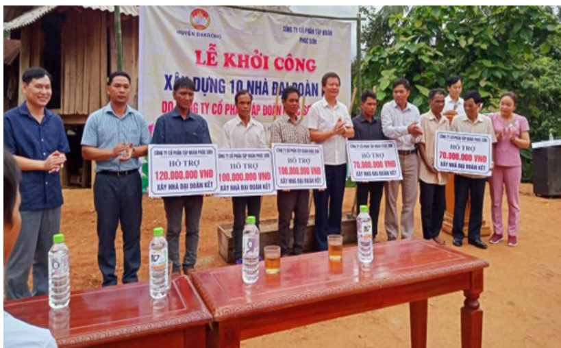
Ủy ban MTTQ Việt Nam huyện Đakrông khởi công nhà Đại đoàn kết cho hộ nghèo

trào thi đua yêu nước được tổ chức theo hướng bám sát nhiệm vụ phát triển kinh tế - xã hội của tỉnh, hướng về cơ sở với nhiều cách làm mới thu hút các tầng lớp nhân dân tham gia. Trong 2 năm 2022-2023, Đề án 197 “Huy động nguồn lực thực hiện chính sách hỗ trợ xây mới nhà ở cho hộ nghèo trên địa bàn tỉnh Quảng Trị, giai đoạn 2022-2026” đã hỗ trợ xây dựng 1.357 nhà ở cho hộ nghèo trên địa bàn với tổng kinh phí hơn 128 tỉ đồng, đạt 43,62% kế hoạch đề ra; trong đó, ngân sách tỉnh hỗ trợ hơn 65 tỷ đồng, Quỹ “Vì người nghèo” huy động gần 63 tỷ đồng.