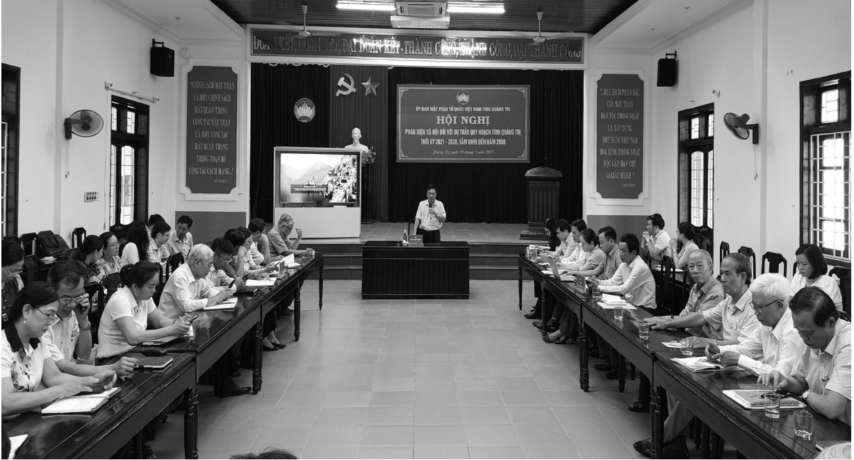
Ban Thường trực Ủy ban MTTQ Việt Nam tỉnh tổ chức Hội nghị phản biện dự thảo Quy hoạch tỉnh Quảng Trị thời kỳ 2021-2030, tầm nhìn đến năm 2050.

Đội vị trí Hiến định: “Mặt trận Tổ quốc Việt Nam là cơ sở chính trị của chính quyền nhân dân; đại diện, bảo vệ quyền và lợi ích hợp pháp, chính đáng của Nhân dân; tập hợp, phát huy sức mạnh đại đoàn kết toàn dân tộc, thực hiện dân chủ, tăng cường đồng thuận xã hội; giám sát, phản biện xã hội; tham gia xây dựng Đảng, Nhà nước, hoạt động đối ngoại nhân dân góp phần xây dựng và bảo vệ Tổ quốc” (Điều 9 Hiến pháp năm 2013), MTTQ Việt Nam có vai trò quan trọng trong việc vận động các tầng lớp nhân dân phát huy quyền làm chủ, tham gia xây dựng Đảng, xây dựng chính quyền, xây dựng cơ chế, chính sách, bảo đảm các điều kiện tiếp tục thực hiện và nâng cao vai trò của MTTQ.