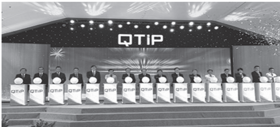
Các đại biểu nhấn nút khởi công xây dựng dự án Khu công nghiệp Quảng Trị.

Năm 2023 là năm bản lề thúc đẩy thực hiện kế hoạch 5 năm 2021-2025; dù được triển khai trong điều kiện gặp nhiều khó khăn, thách thức của tình hình trong và ngoài nước nhưng bằng quyết tâm cao của cả hệ thống chính trị, cùng sự nỗ lực của các cấp, các ngành, cộng đồng doanh nghiệp và đặc biệt là sự đồng hành của Nhân dân, tỉnh Quảng Trị đã đạt được nhiều kết quả đáng khích lệ trên tất cả các lĩnh vực kinh tế - xã hội - an ninh quốc phòng; trong đó, tình hình kinh tế - xã hội của tỉnh đã đạt được những kết quả quan trọng, làm tiền đề cho sức bật phát triển năm 2024.