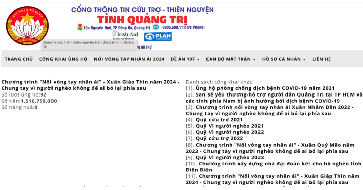
Cổng thông tin Cứu trợ - Thiện nguyện tỉnh Quảng Trị công khai ủng hộ các cuộc vận động

MTTQ Việt Nam 10 huyện, thị xã, thành phố, trang zalo, fanpage của Mặt trận Quảng Trị tạo thường xuyên đăng tải kịp thời, chính xác các hoạt động của MTTQ Việt Nam các cấp, các hoạt động chính trị, xã hội lớn của tỉnh, các chủ trương, chính sách liên quan trực tiếp đến Nhân dân, tạo kênh tuyên truyền chính thống và nắm bắt DLXH trong hệ thống Mặt trận. Trang fanpage Mặt trận Quảng Trị vừa thông tin tuyên truyền kịp thời đến người dân, vừa tham gia đấu tranh, phản bác các thông tin phản động, xuyên tạc, không đúng sự thật trên mạng xã hội có số lượng người theo dõi đông đảo với hơn 83.914 lượt tiếp cận, đăng tải 23.661 tin bài, thu hút gần 6.525 lượt truy cập/ngày với tổng số hơn 100.000 lượt share, like. Triển khai Đề án về “Nâng cao chất lượng công tác nắm thông tin, tình hình dư luận xã hội trong nhân dân của Mặt trận cơ sở trong tỉnh giai đoạn 2022-2027” và Đề án “Tăng cường thực hành dân chủ, sự nhất trí về chính trị và tinh thần trong Nhân dân” đến khu dân cư.