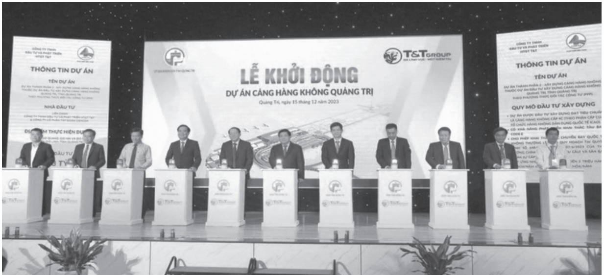
Các lãnh đạo bộ ngành và tỉnh Quảng Trị bấm nút khởi động dự án xây dựng sân bay Quảng Trị

Tiêu đề bài viết, tác giả xin phép được mượn lời bài hát “Quảng Trị yêu thương” của nhạc sĩ Trần Hoàn – một người con ưu tú của quê hương Hải Lăng, Quảng Trị. Không gian âm nhạc của nhạc sĩ Trần Hoàn với những ca khúc được viết ra bằng một giọng riêng, mang cốt cách con người non Mai sông Hãn, hiền lành, giản dị, anh dũng, kiên cường. Đất đó, người này và dòng giai điệu ấy đã làm nên những niềm hi vọng mới, xứng đáng với tầm vóc mà lịch sử mãi mãi không quên. Nghe lại những câu hát của bài hát “Quảng Trị yêu thương”, ta như cảm nhận được tấm lòng của người con nhớ về cố hương yêu dấu, nhớ lại lời mẹ ru, nhớ lại những câu hò vang vọng trên dòng Ô Lâu nước triều bờ sóng sánh, ước mơ