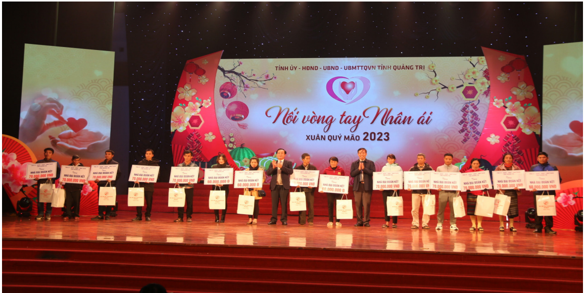
Năm 2024 là năm đánh dấu 20 năm tỉnh Quảng Trị tổ chức Chương trình “Nói vòng tay nhân ái”.

UVBTVTU, Bí thư Đảng đoàn, Chủ tịch Ủy ban MTTQ Việt Nam tỉnh