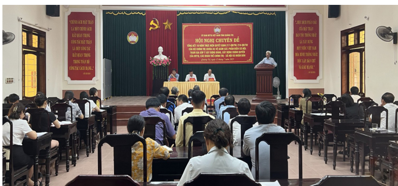
Hội nghị chuyên đề tổng kết 10 năm thực hiện Quyết định 217-QĐ/TW và Quyết định 218-QĐ/TW của Bộ Chính trị (Khoá XI)

N ội dung giám sát, phản biện được Mặt trận các cấp trong tỉnh lựa chọn gắn với các nhiệm vụ trọng tâm của tỉnh, của từng địa phương, liên quan trực tiếp đến quyền, lợi ích hợp pháp, chính đáng, được đoàn viên, hội viên và các tầng lớp Nhân dân quan tâm như: Giám sát việc thực hiện chính sách pháp luật về bồi thường, hỗ trợ tái định cư của một số dự án trọng điểm của tỉnh, quốc