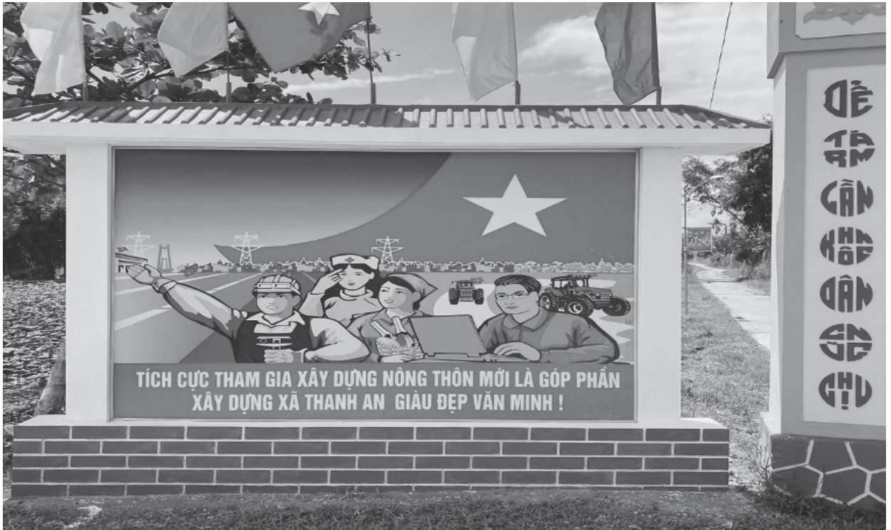
Các công trình, phần việc chào mừng đại hội đại biểu MTTQ Việt Nam các cấp trên địa bàn huyện Cam Lộ.

Chủ tịch Ủy ban MTTQ Việt Nam huyện Cam Lộ