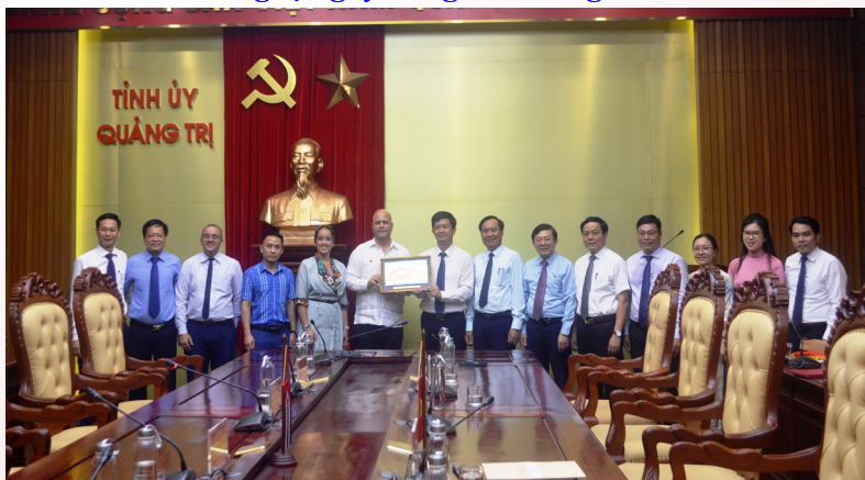
Đoàn đại biểu cấp cao Ủy ban bảo vệ Cách mạng Cuba do Ủy viên Trung ương Đảng Cộng sản Cuba, Ủy viên Hội đồng Nhà nước, Chủ tịch Ủy ban bảo vệ Cách mạng Cuba thăm và làm việc tại Quảng Trị

Tiếp tục duy trì mối quan hệ hữu nghị tốt đẹp giữa tỉnh Quảng Trị với 02 tỉnh Salavan, Savannakhet (Lào) và tỉnh Ubon Ratchathani (Thái Lan). MTTQ tỉnh đón tiếp 3 đoàn đại biểu cấp cao tỉnh Salavan, Savannakhet (Lào), Đoàn Ủy ban Bảo vệ Cách mạng Cuba đến thăm và làm việc tại tỉnh Quảng Trị. Nâng cao chất lượng chương trình “Kết nghĩa Bản-Bản” đối diện hai bên biên giới, tổ chức vận động các cơ quan, đơn vị nhận đỡ đầu, kết nghĩa với các đồn Biên phòng trên tuyến biên giới. Thực hiện các chương trình thăm hỏi, cứu trợ thiên tai, hỗ trợ xây dựng nhà