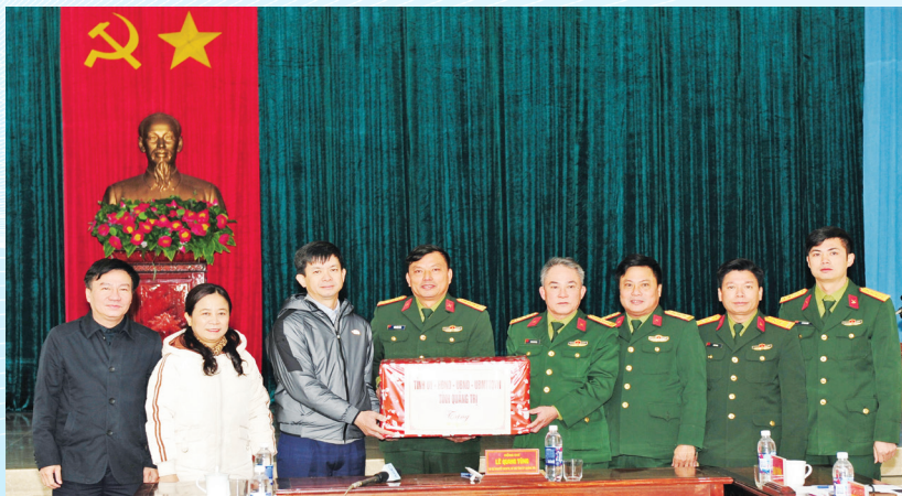
Bí thư Tỉnh ủy Lê Quang Tùng tặng quà cho Đoàn Kinh tế - Quốc phòng 337

Năm 2020 được tỉnh xác định là năm “Hành động quyết liệt - Về đích toàn diện - tạo đà bứt phá”. Đồng thời, thực hiện thành công “Mục tiếp kép” theo chủ trương của Thủ tướng Chính phủ, vừa tổ chức thực hiện tốt công tác phòng chống, tìm kiếm cứu nạn, khắc phục hậu quả nặng nề do thiên tai, bão lũ gây ra. 16/25 chỉ tiêu kinh tế - xã hội chủ yếu được thực hiện đạt và vượt; 100% các mục tiêu nhiệm vụ năm 2020 được triển khai và hoàn thành; huy động vốn trên địa bàn đạt 25.000 tỷ đồng, tăng 9,47% so với cuối năm 2019; thu ngân sách trên địa bàn đạt hơn 3.400 tỷ đồng, đạt 100% kế hoạch, tăng hơn 10% so với năm 2019; Vụ Đông Xuân 2019 – 2020 được mùa toàn diện, năng suất lúa đạt 58,7 tạ/ha, cao nhất từ trước đến nay. Toàn tỉnh đã hoàn thành việc sắp xếp đơn vị hành chính cấp xã theo Nghị quyết