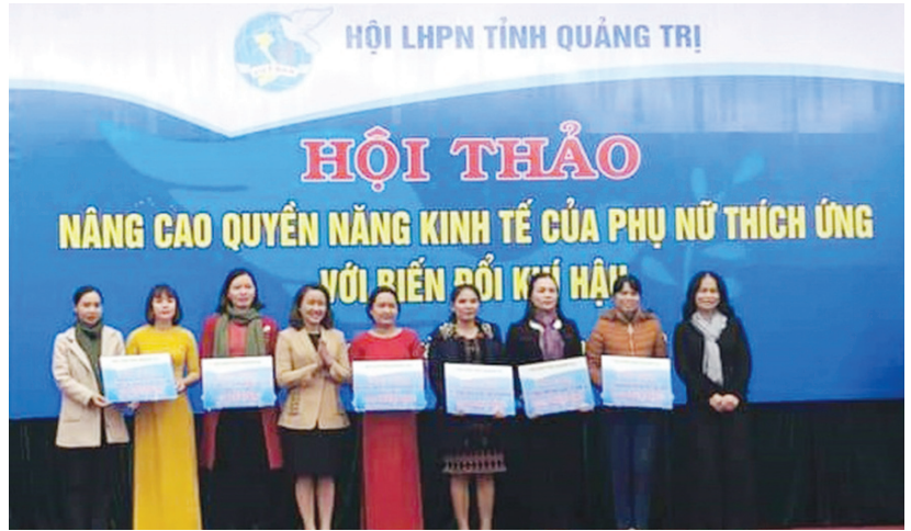
Hội thảo nâng cao quyền năng kinh tế của phụ nữ thích ứng với biến đổi khí hậu.

Xác định đổi mới chính là động lực của sự phát triển, vì vậy, ngay từ đầu nhiệm kỳ 2016-2021 Hội đã chuyển hướng chỉ đạo theo hướng, một mặt tiếp tục duy trì tốt các hoạt động hỗ trợ, giúp đỡ phụ nữ giảm nghèo, phát triển kinh tế gia đình, bảo vệ môi trường; mặt khác tập trung mạnh vào hoạt động hỗ trợ phụ nữ “Khởi nghiệp, khởi sự kinh doanh”, khơi dậy tiềm năng, sức sáng tạo của người phụ nữ, thúc đẩy quyền năng của phụ nữ trong