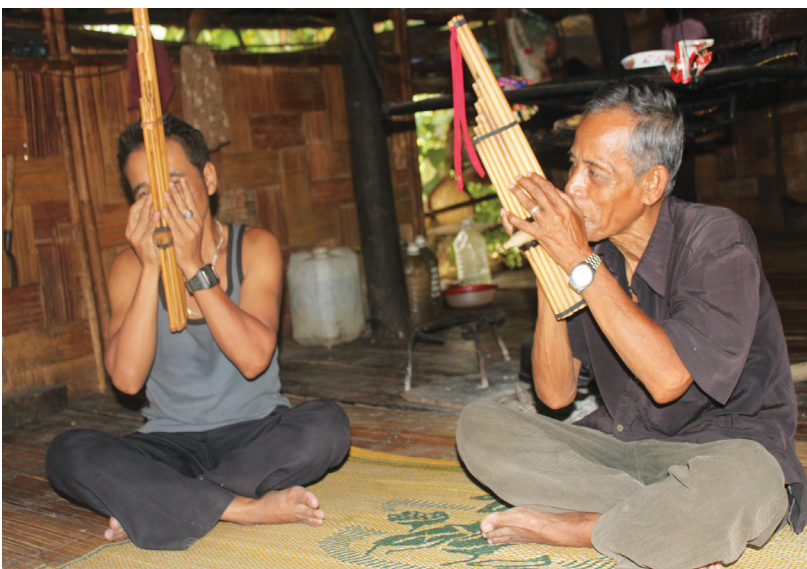
Bản sắc văn hóa của đồng bào Vân Kiều, Pa Cô được các Nghệ nhân lưu giữ và truyền cho con cháu.