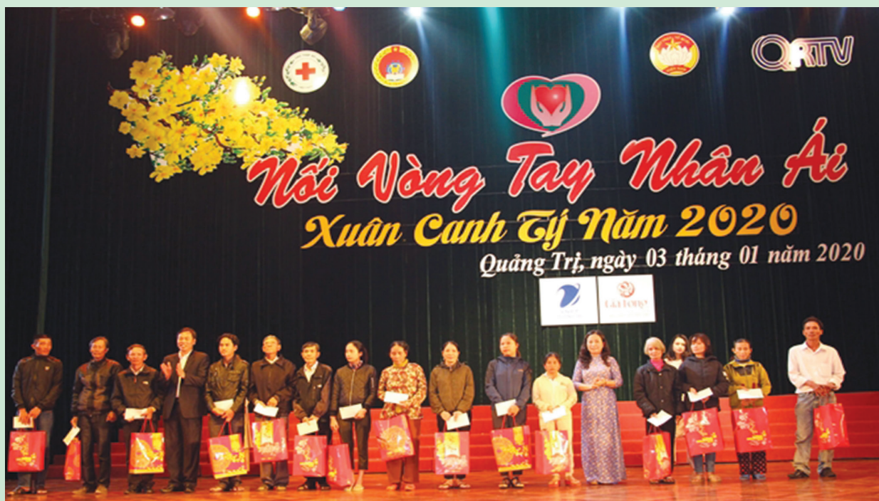
Chương trình Nối vòng tay nhân ái được tổ chức hằng năm.

Tết Nguyên đán Tân Sửu 2021 đang đến gần, hòa chung tinh thần “Cả nước chung tay vì người nghèo - không để ai bị bỏ lại phía sau”, các hoạt động chăm lo Tết cho người nghèo và các đối tượng đặc biệt