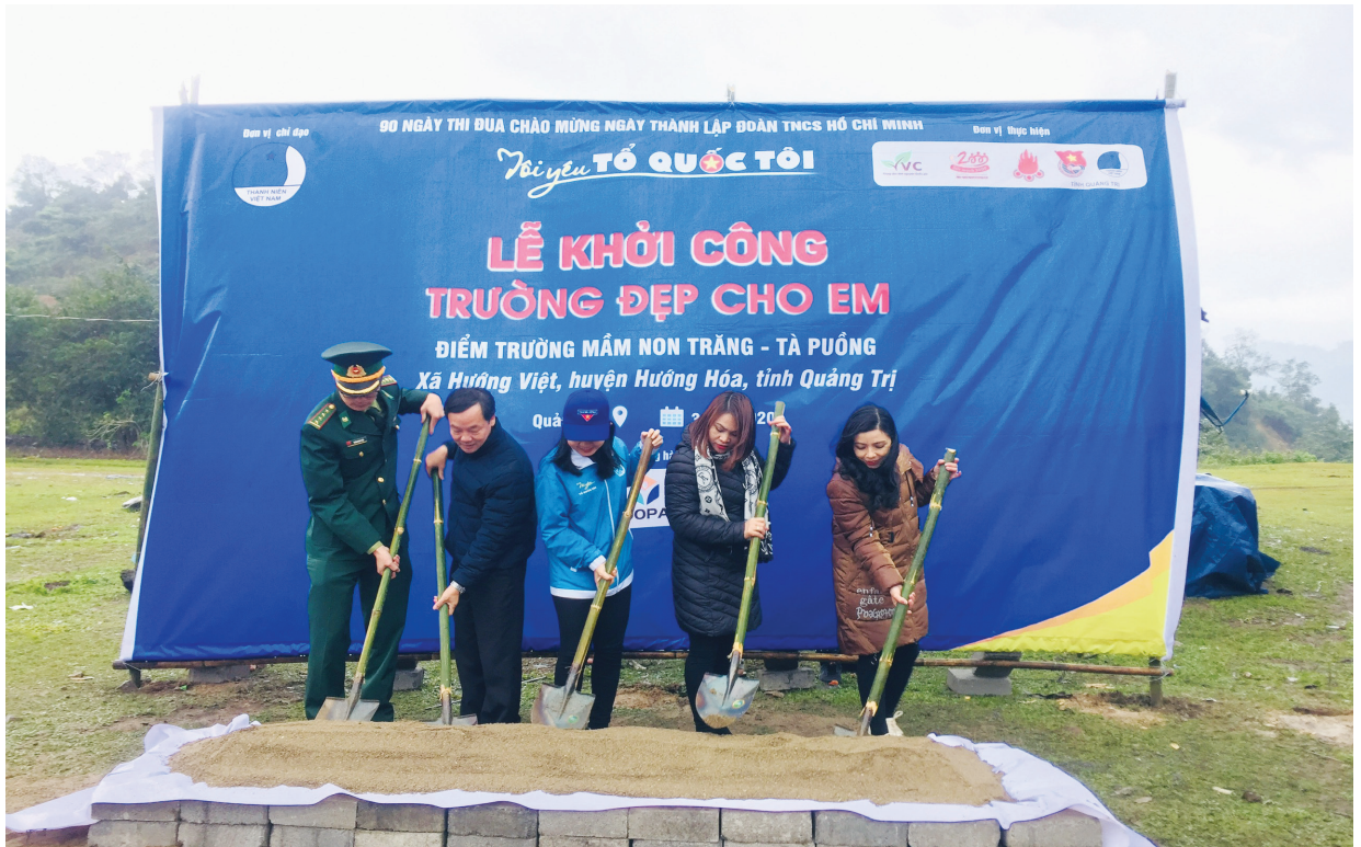
Lễ khởi công Trường đẹp cho em tại điểm trường Mầm non Trắng - Tà Puông, xã Hướng Việt.

và Nhân dân các giải pháp phòng, chống dịch COVID-19 với các hình thức đa dạng và phong phú. Đặc biệt là phối hợp Sở Y tế tổ chức Tọa đàm trực tuyến “Nhận thức và hành động của thanh niên trong phòng, chống dịch COVID-19” thu hút gần 12.000 lượt người xem chung và hơn 1.180 lượt chia sẻ đã lan tỏa, tạo hiệu ứng tốt trong hệ thống Đoàn thanh niên các cấp và người dân. Chiến dịch truyền thông “Hãy đeo khẩu trang nơi công cộng” và bộ ảnh cổ động