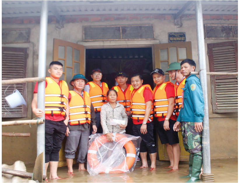
Quý từ thiện Hoa Chia Sẻ thăm, tặng quà cho người dân vùng lũ xã Hải Định, huyện Hải Lăng

Trong hoàn cảnh đó, tình dân tộc - nghĩa đồng bào trong năm 2020 đầy biến động một lần nữa lại bùng cháy sau dịch Covid-19. Một làn sóng mang tên “nhân