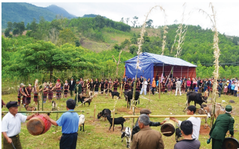
Người Tà Ôi vui với lễ hội Ariêu Ping truyền thống tại bản A La.

Đã thành tục lệ, sau lễ cúng đất trời, toàn bộ người dân tụ hội tại trước nhà già làng để cùng nhau hát múa bài hát mừng lúa mới. Trong những làn điệu hát múa thì cây nêu là vật dụng không thể thiếu, vì nó tượng trưng cho