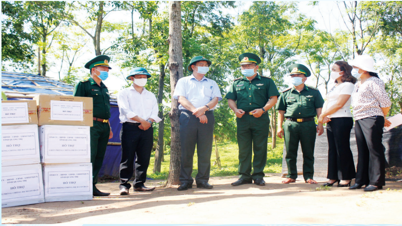
Phó Bí thư Thường trực Tỉnh uỷ Nguyễn Đăng Quang thăm cán bộ, chiến sỹ làm nhiệm vụ tại các chốt kiểm soát dịch bệnh COVID-19 trên tuyến biên giới Việt - Lào.

khó khăn, hạn chế, tồn tại của năm 2020, đòi hỏi sự nỗ lực, quyết tâm cao của hệ thống Mặt trận các cấp trong tỉnh. Với các nhiệm vụ trọng tâm cụ thể sau: