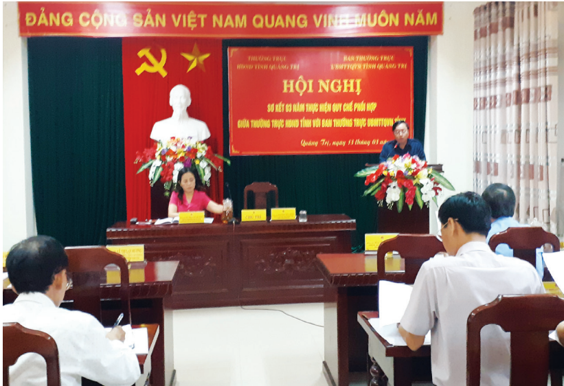
Hội nghị Sơ kết 3 năm thực hiện Quy chế phối hợp giữa Thường trực HĐND với Ban Thường trực Ủy ban MTTQ Việt Nam tỉnh

T rong hoạt động quản lý và thực thi nhiệm vụ của bất cứ cơ quan, đơn vị nào cũng đều có sự phối hợp giữa các cấp, các ngành, giữa cấp trên với cấp dưới, giữa các phòng ban, bộ phận và giữa các cán bộ, công chức, viên chức trong cùng cơ quan, đơn vị với nhau, trong thực hiện chức năng, nhiệm vụ của mình, Ủy ban MTTQ Việt Nam các cấp thường xuyên phối hợp với các cơ quan quyền lực Nhà nước, các cấp chính quyền và các tổ chức chính trị - xã hội để nâng cao hiệu quả, hiệu lực công tác Mặt trận, đặc biệt là sự phối hợp với TT HĐND các cấp.