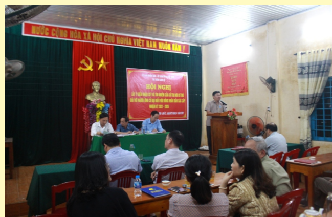
Hiệp thương lấy ý kiến nhận xét và tín nhiệm của cư trú nơi cư trú đối với người ứng cử Đại biểu hội đồng nhân dân các cấp nhiệm kỳ 2021 - 2026 tại khu phố 2, thị trấn Cam Lộ, huyện Cam Lộ