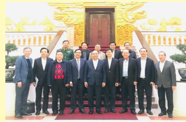
Thủ tướng Chính phủ Nguyễn Xuân Phúc làm việc với lãnh đạo tỉnh Quảng Trị về một số định hướng quan trọng phát triển địa phương trong thời gian tới.