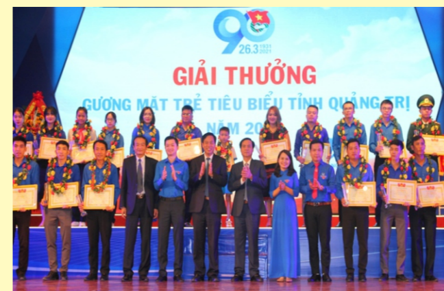
Kỷ niệm 90 năm Ngày thành lập Đoàn TNCS Hồ Chí Minh và trao Giải thưởng Gương mặt trẻ tiêu biểu tỉnh Quảng Trị năm 2020