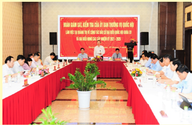
Đoàn giám sát, kiểm tra của Ủy ban Thường vụ Quốc hội do Phó Chủ tịch Quốc hội, Ủy viên Hội đồng bầu cử quốc gia Phùng Quốc Hiển làm trưởng đoàn vào làm việc với tỉnh Quảng Trị về công tác bầu cử đại biểu Quốc hội khóa XV và đại biểu HĐND các cấp nhiệm kỳ 2021-2026