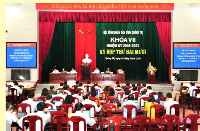
Kỳ họp thứ 20, HĐND tỉnh Quảng Trị khóa VII: Xem xét, quyết định những vấn đề cấp bách