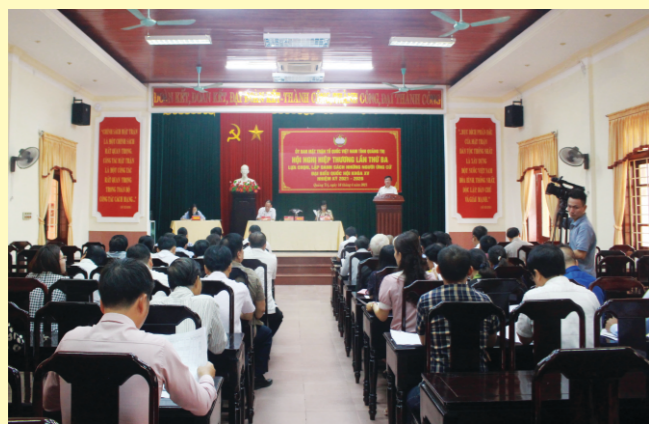
Hội nghị nghiệp thương lần thứ ba lựa chọn, lập danh sách người ứng cử Đại biểu Quốc hội khóa XV, nhiệm kỳ 2021 - 2026