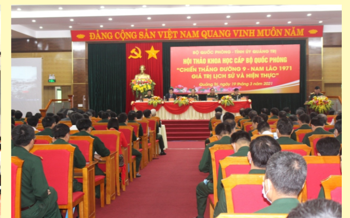
Hội thảo khoa học "Chiến thắng Đường 9- Nam Lào 1971: Giá trị lịch sử và hiện thực"