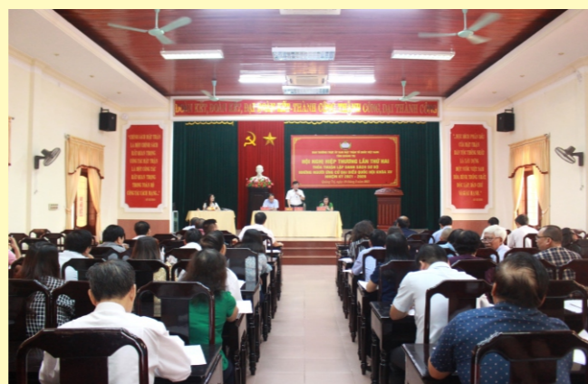
Hội nghị Hiệp thương lần thứ hai hoà thuận lập danh sách sơ bộ những người ứng cử đại biểu Quốc hội khóa XV, nhiệm kỳ 2021 - 2026