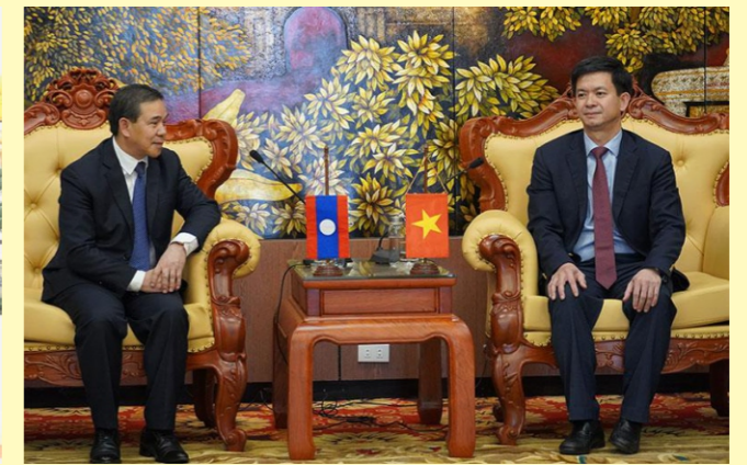
Đại sứ đặc mệnh toàn quyền nước Cộng hòa Dân chủ Nhân dân Lào thăm và làm việc tại Quảng Trị