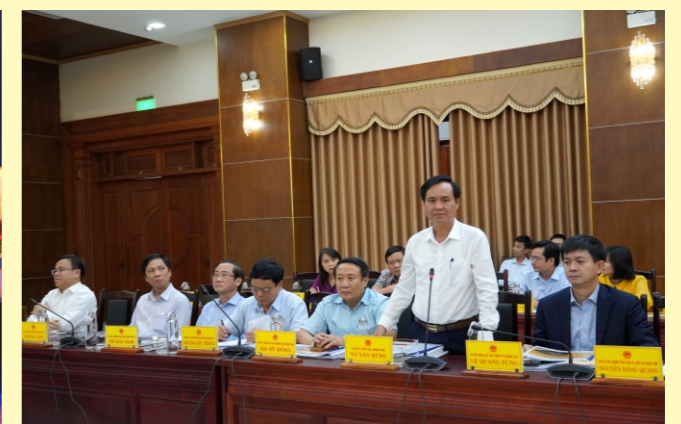
Báo cáo kết quả nghiên cứu dự án Cảng Hàng không Quảng Trị