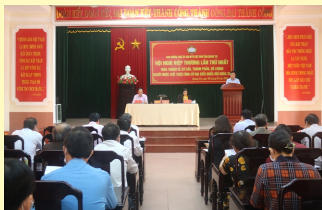
Hội nghị Hiệp thương lần thứ nhất giới thiệu người ứng cử đại biểu Quốc hội khóa XV