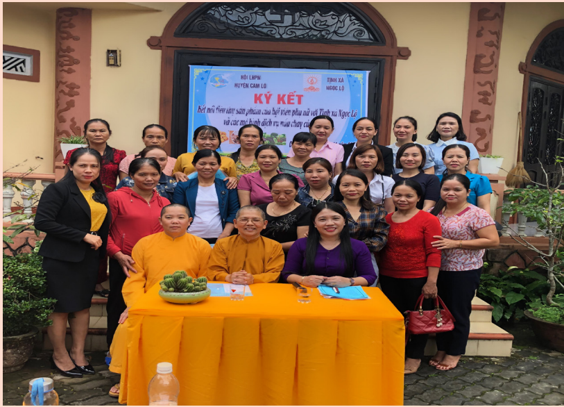
Hội LHPN huyện Cam Lộ và Tỉnh xá Ngọc Lộ ký kết kết nối tiêu thụ sản phẩm của hội viên phụ nữ với Tỉnh xá Ngọc Lộ và các mô hình dịch vụ nấu chay của Hội LHPN