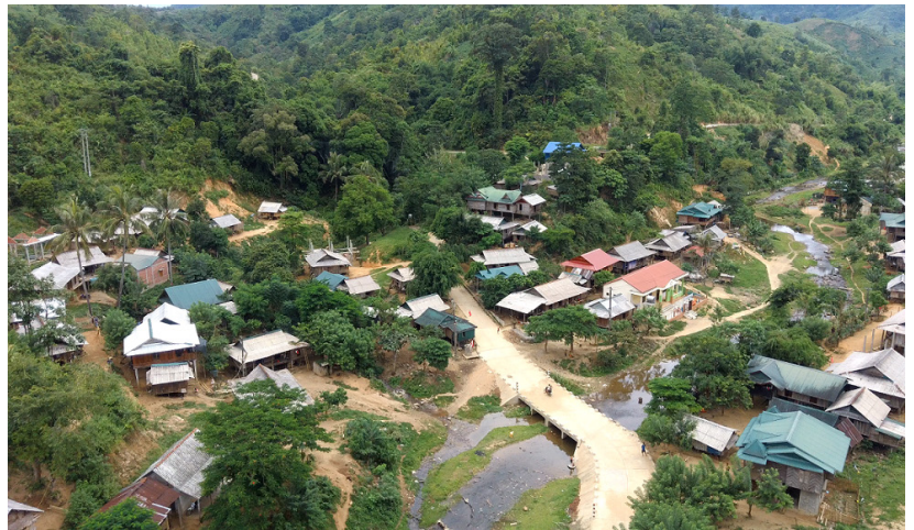
Diện mạo nông thôn của huyện Hướng Hóa ngày càng khởi sắc

dân cư, biết tập hợp quần chúng xây dựng khối đại đoàn kết dân tộc thông qua công tác tuyên truyền, giải thích, vận động bà con không nghe theo kẻ xấu, lợi dụng để xuyên tạc, xúi giục, chia rẽ trong nhân dân. Chính bằng