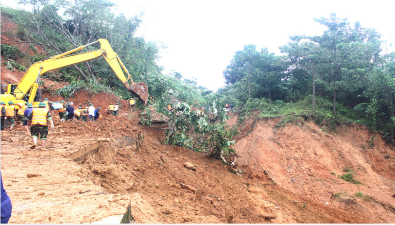
Mặt trận các cấp cùng chính quyền, lực lượng vũ trang, người dân tham gia khắc phục thiệt hại do mưa lũ, sạt lở đất tại huyện Hương Hoá.

của việc học tập và làm theo tư tưởng, đạo đức, phong cách Hồ Chí Minh, trong cán bộ, công chức, người lao động và Ủy ban MTTQ Việt Nam các cấp, đặc biệt ở xã phường, thị trấn và Ban công tác mặt trận ở thôn, bản, khu phố; đưa nội dung học tập và làm theo tấm gương đạo đức Hồ Chí Minh gắn với việc thực hiện Nghị quyết Đại hội lần thứ XIII của Đảng, Nghị quyết đại hội Đảng các cấp nhiệm kỳ 2020 - 2025, Nghị quyết Đại hội Ủy ban MTTQ Việt Nam các cấp nhiệm kỳ 2019 - 2024.