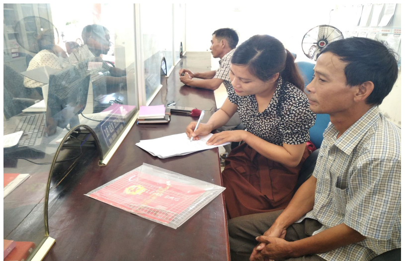
Người dân làm thủ tục tại bộ phận 1 cửa của Xã Hiền Thành được cán bộ xã trực tiếp hướng dẫn làm thủ tục.

quả quản lý nhà nước. Tiêu biểu có 5 mô hình giúp thực hiện có hiệu quả sáng kiến “Cải cách thủ tục hành chính gần dân, vì dân” gồm: mô hình “Thân thiện với người dân” tạo không gian, không khí thân thiện gần gũi, cởi mở để đón tiếp công dân đến thực hiện các thủ tục hành chính; mô hình “Chia sẻ, chúc mừng, động viên” đối với các hộ gia đình, cá nhân đến đăng ký khai sinh, đăng ký kết hôn, đăng ký khai tử sẽ gửi thư chúc mừng hoặc chia buồn; mô hình “Ngày không viết, không hẹn” thực hiện trong một ngày cố định trong tuần trong giờ hành chính do công chức, đoàn viên thanh niên hỗ trợ ghi thay các loại giấy tờ; mô hình “3 giảm” trong cải cách thủ tục hành chính” gồm giảm thủ tục, thời gian, chi phí trong thực hiện thủ tục hành chính;