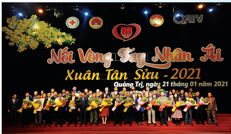
Mặt trận các cấp vận động các tầng lớp nhân dân, cơ quan, tổ chức, đơn vị, doanh nghiệp, tổ chức quốc tế, nhà hảo tâm trong và ngoài tỉnh tham gia đóng góp, ủng hộ “Quy Vĩ người nghèo” và “Tết cho người nghèo”

Việc tổ chức nghiên cứu, học tập, quán triệt và triển khai thực hiện Chỉ thị được tiến hành nghiêm túc theo tinh thần chỉ đạo, gắn thực hiện Nghị quyết Trung ương 4 khóa XI, XII về xây dựng, chỉnh đốn Đảng; 10/10 huyện, thị xã, thành phố đã có kế hoạch triển khai thực hiện Chỉ thị, triển khai các chương trình, tổ chức ký cam