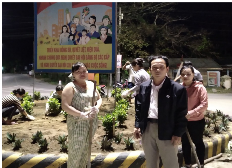
Chi hội Phụ nữ cơ sở thực hiện phong trào chỉnh trang nông thôn

Từ nhận thức về vai trò trách nhiệm của mình, các thành viên Ban TTND, Ban GSDTCCĐ luôn nêu cao tinh thần trách nhiệm trong công việc. Đơn cử như việc tổ chức triển khai thực hiện đầy đủ các nhiệm vụ đảm bảo chất lượng công việc, tham gia nắm bắt dư luận xã hội, tham gia hòa giải ở các khu dân cư và giải quyết đơn thư, khiếu nại; giám sát công tác giải phóng mặt bằng, giám sát các dự án trên địa bàn; giám sát việc vận động thu các loại quỹ; việc thực hiện quy chế dân chủ ở cơ sở, phản ánh những vấn đề dân sinh bức xúc, giám sát về những kiến nghị và giải quyết các kiến nghị của cử tri; giám sát việc chấp hành các chủ trương đường lối, chính sách của Đảng, pháp luật của Nhà nước; về việc thực hiện cải cách hành chính tại bộ phận một cửa đảm bảo sự hài lòng của người dân... làm tăng thêm lòng tin của quần chúng nhân dân đối với vai trò lãnh đạo của Đảng và sự quản lý, điều hành của chính quyền, giữ gìn đoàn kết nội bộ, nâng cao ý thức, trách nhiệm của các tập thể, cá nhân trong việc thực hiện nhiệm vụ và giải quyết công việc được