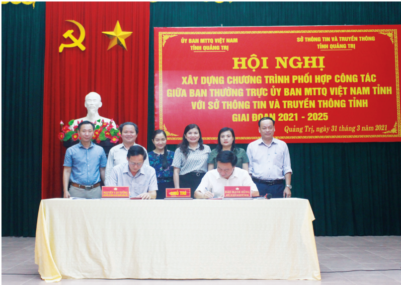
Ký kết Chương trình phối hợp công tác giữa Ban Thường trực Ủy ban MTTQ Việt Nam tỉnh với Sở Thông tin và Truyền thông, giai đoạn 2021 - 2025

hành chính theo khuôn mẫu, quy định có sẵn, chưa có tư duy đột phá, cải tiến để thay đổi lề lối, phương thức làm việc nhằm nâng cao chất lượng, hiệu lực, hiệu quả hoạt động quản lý nhà nước. Số cán bộ, công chức có khả năng làm việc trong môi trường quốc tế ở nhiều cơ quan, đơn vị còn rất hạn chế.