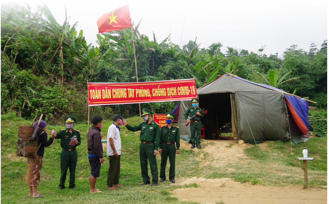
Chốt phòng, chống dịch Covid-19 Đồn Biên phòng Ba Nang đo thân nhiệt và phát khẩu trang cho nhân dân biên giới..

dịch bệnh; ban hành Chỉ thị của Đảng ủy, xây dựng kế hoạch ứng phó dịch Covid-19; chỉ đạo các đơn vị trên hai tuyến biên giới của tỉnh xây dựng kế hoạch và hướng dẫn các đơn vị cách xử lý các tình huống phòng chống dịch để không bị động bất ngờ. Trong bất luận hoàn cảnh nào, lực lượng BĐBP Quảng Trị luôn là những chiến sĩ trên tuyến đầu phòng, chống dịch bệnh; phối hợp với cấp ủy, chính quyền, nhân dân