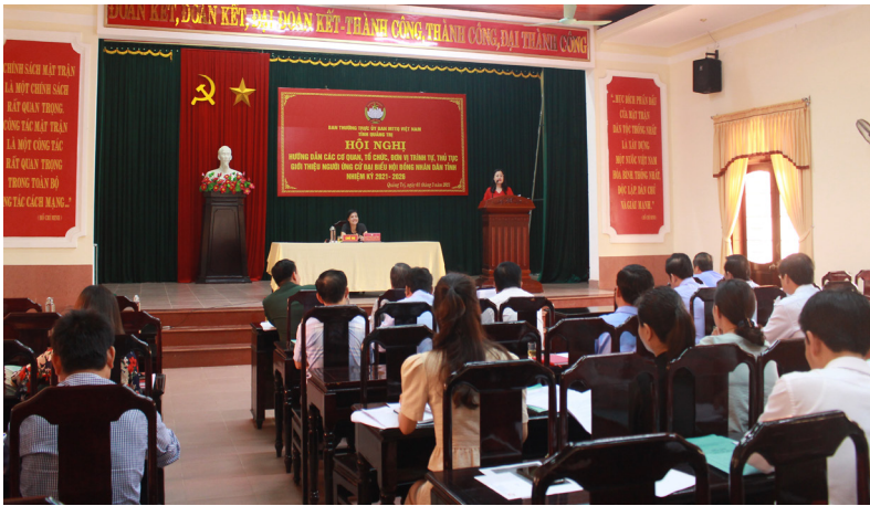
Hội nghị Hướng dẫn các cơ quan, tổ chức, đơn vị trình tự, thực hiện giới thiệu người ứng cử đại biểu Hội đồng nhân dân tỉnh nhiệm kỳ 2021 - 2026.

Phó Chủ tịch Thường trực Ủy ban MTTQ Việt Nam tỉnh