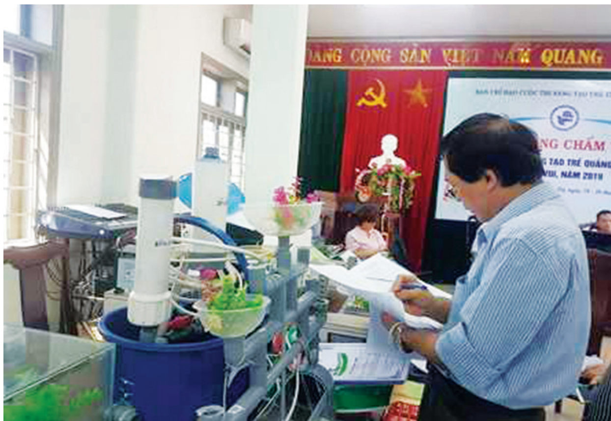
Ban Chỉ đạo cuộc thi Sáng tạo trẻ Quảng Trị đã tổ chức chấm thi Cuộc thi Sáng tạo trẻ Quảng Trị lần thứ VIII, năm 2019.

đã có nhiều mô hình, hoạt động hiệu quả, cách làm sáng tạo trên các lĩnh vực, góp phần phát triển kinh tế - xã hội, giữ vững quốc phòng - an ninh của địa phương. Nhằm đánh giá kết quả, đồng thời biểu dương khen thưởng các tập thể, cá nhân có thành tích trong triển khai thực hiện phong trào "Đoàn kết sáng tạo", năm 2020, UBMTTQ Việt Nam tỉnh tổ chức