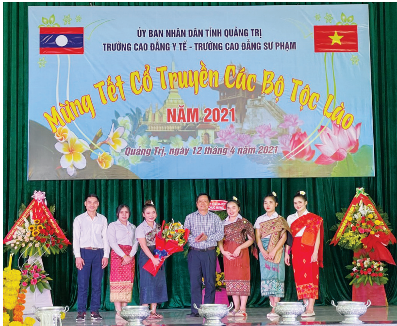
Trưởng Cao đẳng Y tế - Trưởng Cao đẳng Sư phạm Quảng Trị tổ chức lễ hội Tết Cổ truyền cho du học sinh Lào đang theo học tại Quảng Trị.

T rong lịch sử quan hệ quốc tế từ trước tới nay, mỗi quan hệ hữu nghị, đoàn kết đặc biệt và hợp tác toàn diện Việt Nam - Lào là một điển hình, một tấm gương mẫu mực, hiếm có về sự gắn kết bền chặt, thủy chung, trong sáng và đầy hiệu quả giữa hai dân tộc trong công cuộc đấu tranh vì độc lập, tự do và tiến bộ xã hội. Quan hệ hữu nghị, đoàn kết đặc biệt, hợp tác toàn diện đó được ghi dấu qua những chặng đường lịch sử. Là một trong những tình có chung đường biên giới với Lào, Quảng Trị luôn đặc biệt quan tâm tới mỗi quan hệ quốc tế “anh em” này, thường xuyên tìm hiểu về các phong tục tập quán, kịp thời chúc mừng nhân các ngày lễ trọng hoặc dịp Tết truyền thống của người