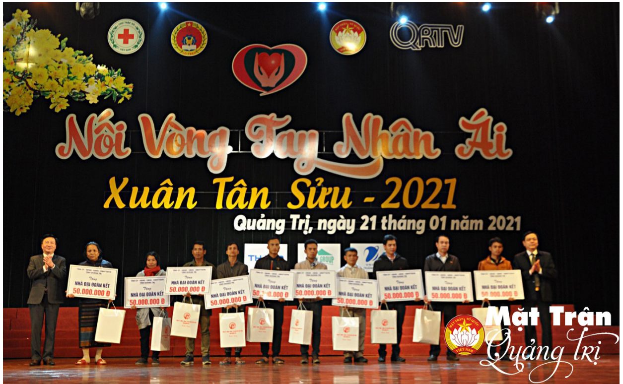
Chương trình Nói vòng tay nhân ái được tổ chức hằng năm - Ảnh: NP

UVBTVTU, Bí thư Đảng đoàn, Chủ tịch Ủy ban MTTQ Việt Nam tỉnh