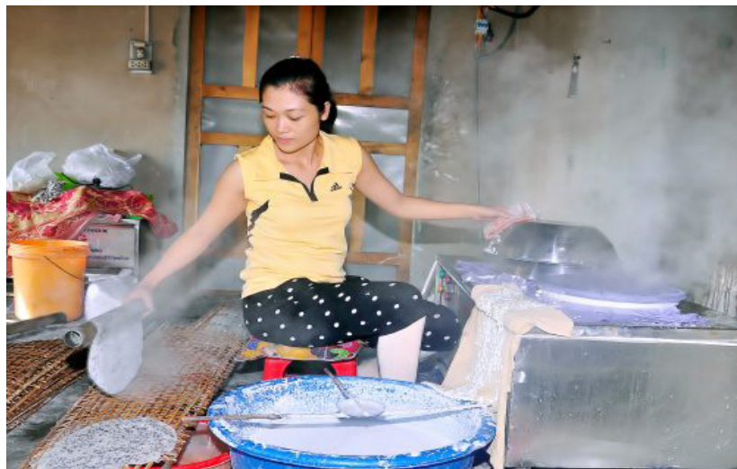
Hỗ trợ mô hình sản xuất giúp người dân thoát nghèo bền vững. Ảnh PT

Với mục tiêu "Không để ai bị bỏ lại phía sau", Ban Thường trực Ủy ban MTTQ Việt Nam huyện phát động tháng cao điểm "Vì người nghèo" với mong muốn hệ thống chính trị, các tổ chức, cá nhân, doanh nghiệp và nhân dân trên toàn địa bàn huyện tiếp tục bằng tình cảm, tấm lòng nhân ái, sẽ chia cùng MTTQ trong công tác chăm lo người nghèo, nhất là những hộ có hoàn cảnh khó khăn, bị ảnh hưởng bởi dịch Covid-19, giúp người dân nâng cao chất lượng cuộc sống, thoát nghèo bền vững.