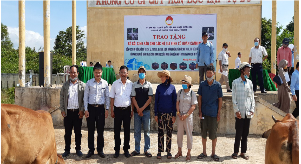
Mặt trận huyện phối hợp với Hội yêu hoa lan Hướng Hóa hỗ trợ bò giống cho người dân khôi phục sản xuất sau mưa lũ. Ảnh NVT

Chủ tịch Ủy ban MTTQ Việt Nam huyện Hướng Hóa