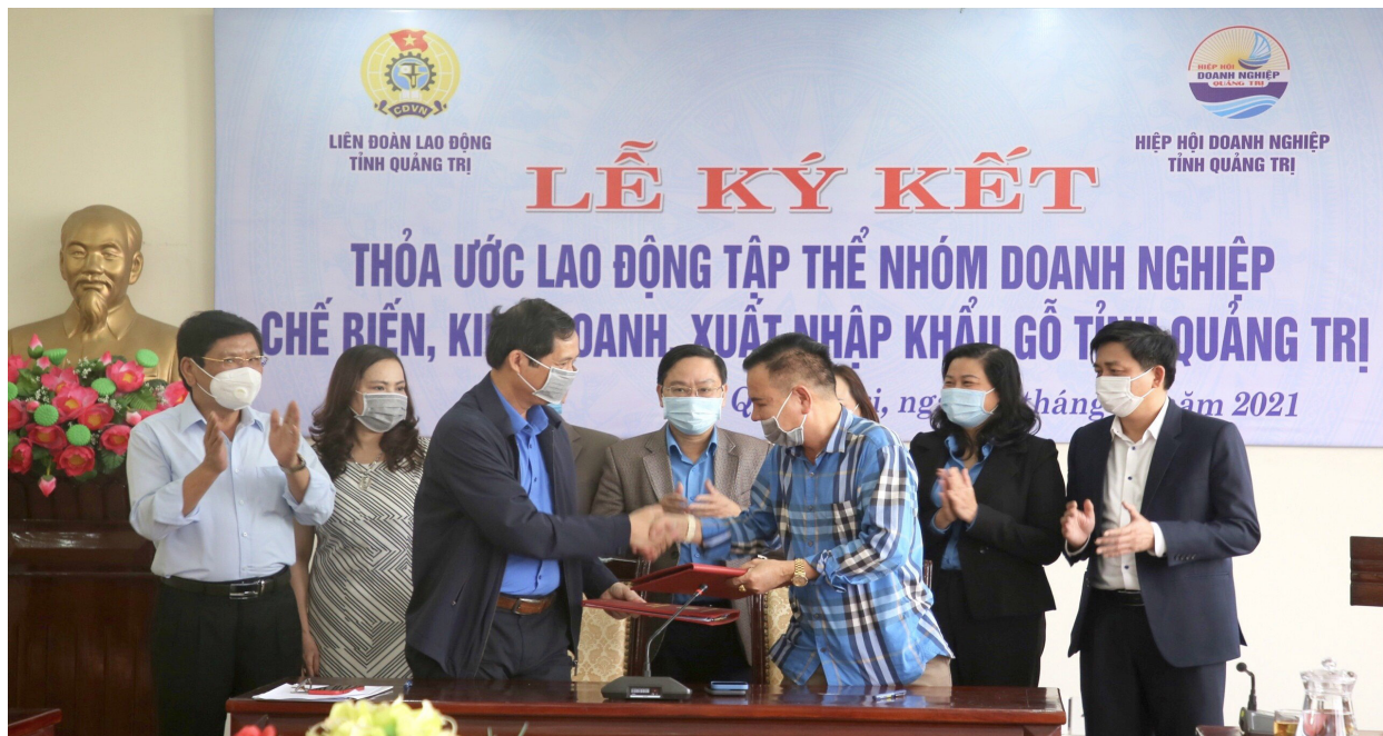
LĐLĐ tỉnh phối hợp Hiệp hội Doanh nghiệp tỉnh thương lượng, ký kết thỏa ước lao động tập thể nhóm doanh nghiệp chế biến, kinh doanh, xuất nhập khẩu gỗ trên địa bàn tỉnh

Năm 2021, đại dịch Covid-19 tiếp tục tác động trực tiếp đến tình hình kinh tế-xã hội, hoạt động các doanh nghiệp tiếp tục gặp khó khăn trong sản xuất kinh doanh, một số doanh nghiệp phải tạm dừng hoạt động, thu hẹp sản xuất, giải thể; khu vực sự nghiệp văn hoá, thể thao, du lịch, giáo dục, y tế... ảnh hưởng trong mọi tổ chức hoạt động, đã tác động tiêu cực đến tình hình đời sống, việc làm của công nhân, viên chức, lao động (CNVCLĐ). Phong trào CNVCLĐ và hoạt động Công đoàn theo đó cũng bị tác động trong thực hiện các