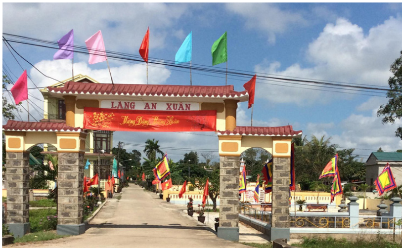
Cảnh quan làng An Xuân ngày càng khang trang

Hàng năm ngay từ đầu năm Ban Thường trực Ủy ban MTTQVN huyện đã xây dựng các nội dung, chỉ tiêu hành động, tổ chức ký cam kết thực hiện giữa Chủ tịch Ủy ban MTTQVN các xã, thị trấn với Ủy ban MTTQVN huyện. Tập trung, chỉ đạo tuyên truyền các chủ trương chính sách của Đảng, pháp luật của Nhà nước và nhiệm vụ chính trị của địa phương. Đặc biệt trong năm 2021 Mặt trận các cấp tổ chức triển khai hội nghị học tập quán triệt các nghị quyết, đề án của huyện như: NQ số 02-NQ/HU về “Xây dựng huyện Cam Lộ đạt chuẩn nông thôn mới kiểu mẫu, theo hướng nông nghiệp giá trị gia tăng cao, gắn với môi trường sáng - xanh - sạch - đẹp, giai đoạn 2021 - 2025”; NQ số 03-NQ/HU về “Phát triển công nghiệp, thương mại, dịch vụ và du lịch huyện giai đoạn 2021 - 2025, định hướng đến 2030”; Đề án số 01-ĐA/HU về “Nâng cao năng lực cán bộ; thu hút,