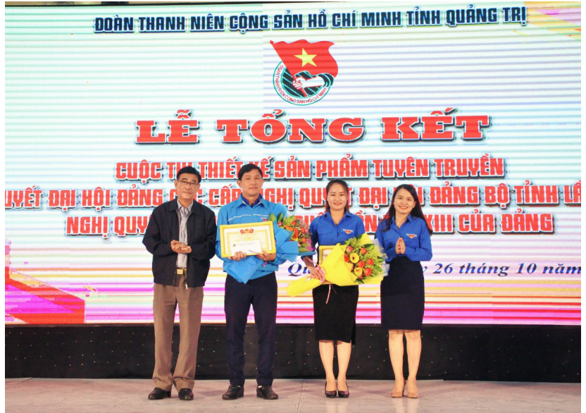
Lễ tổng kết Cuộc thi thiết kế sản phẩm tuyên truyền Nghị quyết Đại hội Đảng các cấp, Nghị quyết Đại hội Đảng bộ tỉnh lần thứ XVII, Nghị quyết Đại hội lần thứ XIII của Đảng.

Tính đến hết tháng 11/2021, các cấp bộ Đoàn toàn