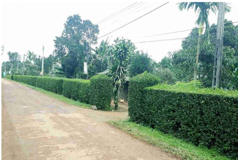
Một tuyến đường có hàng rào xanh ở khu dân cư Thiệt Xá, xã Cam Chính, Cam Lộ.

Văn phòng điều phối nông thôn mới Quảng Trị