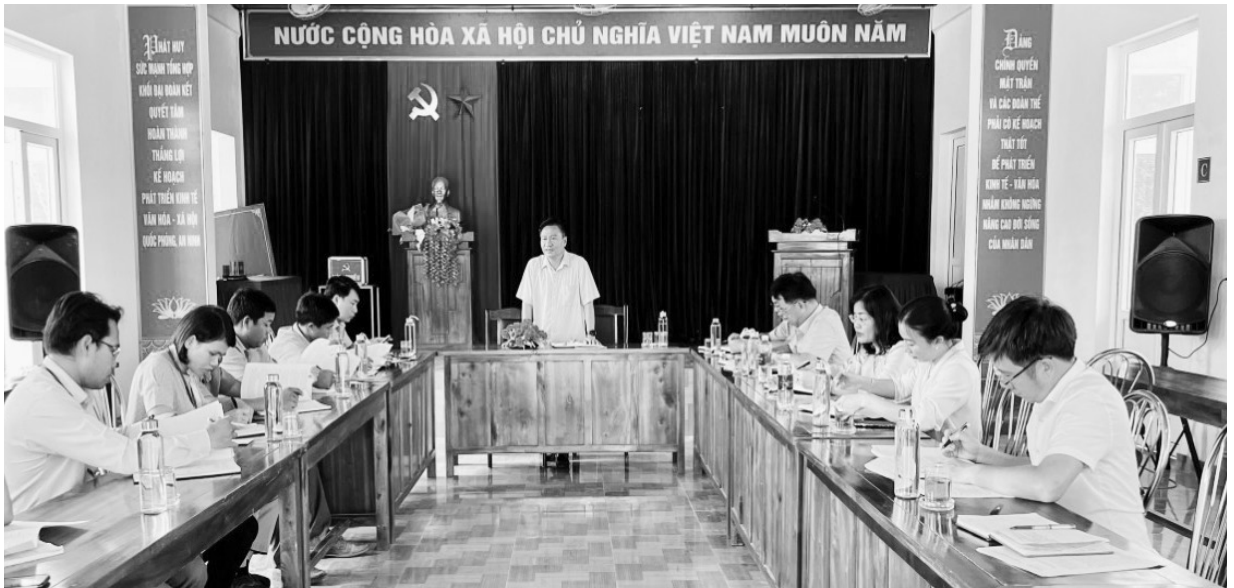
Đoàn giám sát Ủy ban MTTQ Việt Nam tỉnh Quảng Trị lắng nghe, tiếp thu ý kiến nguyện vọng của nhân dân xã Hương Phùng, huyện Hương Hoá.