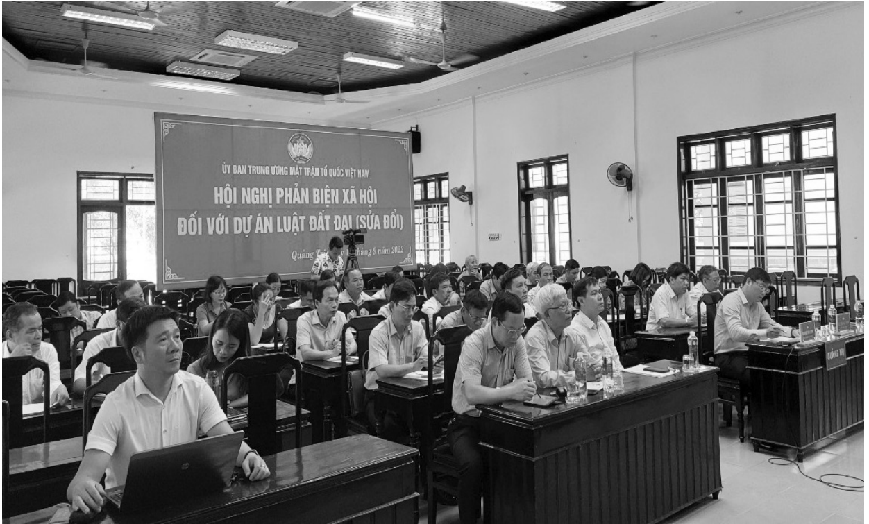
Các đại biểu tham dự Hội nghị phản biện xã hội đối với dự án Luật Đất đai (sửa đổi) do Ủy ban TW MTTQ Việt Nam tổ chức.

Công tác dân nguyện là một trong 7 nội dung về quyền, nhiệm vụ của MTTQ Việt Nam được Luật MTTQ và Hiến pháp ghi nhận. Nội hàm của công tác dân nguyện rất rộng, bao trùm lên nhiều lĩnh vực của đời sống xã hội, vì vậy để xác định được lĩnh vực nào là trọng tâm, trọng điểm trong mỗi giai đoạn là vấn đề mà mỗi cán bộ làm công tác Mặt trận luôn tâm niệm để đem đến lợi ích thiết thực nhất cho Nhân dân.