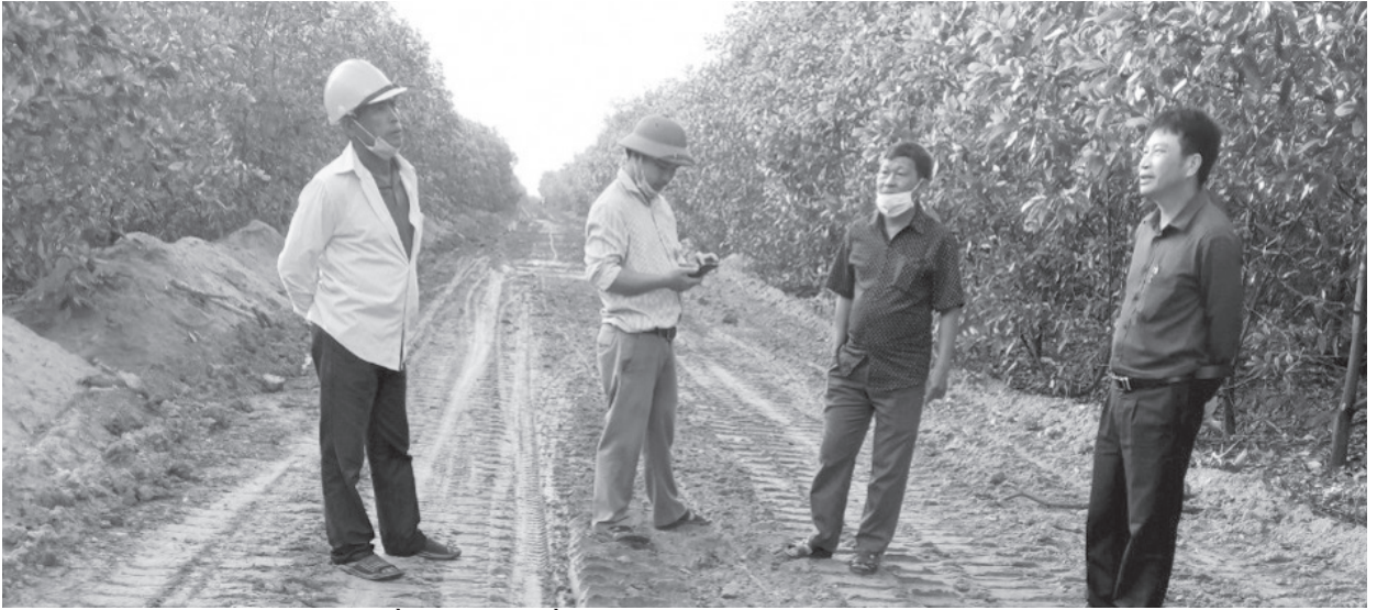
Ban Giám Giám sát đầu tư cộng đồng thực hiện giám sát tại công trình đường Lâm nghiệp xã Vĩnh Tú, huyện Vĩnh Linh.

nhằm đảm bảo lợi ích của cộng đồng dân cư, nâng cao chất lượng công trình và giảm thiểu gây ô nhiễm môi trường. Hoạt động giám sát đầu tư của cộng đồng cũng đồng thời phòng, chống xâm hại lợi ích cộng đồng trong quá trình chuẩn bị đầu tư, thực hiện đầu tư, quản lý vận hành, sử dụng các công trình.