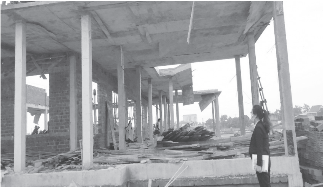
Ban Giám sát cộng đồng thực hiện giám sát tại công trình nhà văn hoá phường 1, thành phố Đông Hà.

Khu phố Tây Trì nằm ở Phường 1, thành phố Đông Hà có địa bàn rộng, đông dân cư gồm 600 hộ với 2700 nhân khẩu, chia thành 15 tổ ANND. Mặc dù tình hình kinh tế - xã hội của khu phố đã có nhiều thay đổi so với những năm trước, tuy nhiên, đời sống nhân dân vẫn còn gặp nhiều khó khăn, cơ sở hạ tầng chưa đồng bộ, ý thức trách nhiệm của quần chúng chưa cao, các công trình xây dựng đang triển khai trong cùng thời điểm là những vấn đề ảnh hưởng trực tiếp đến đời sống hằng ngày của người dân. Trong những năm qua, Ban giám sát đầu