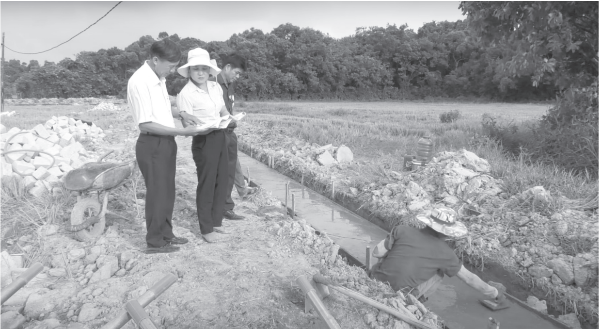
Ban GSĐTCCĐ xã Vĩnh Long, huyện Vĩnh Linh đang thực hiện giám sát công trình mương thủy lợi đang xây dựng trên địa bàn xã.

Qua 3 năm thực hiện Nghị quyết Đại hội MTTQ Việt Nam huyện Vĩnh Linh lần thứ XVI, nhiệm kỳ 2019-2024, Ban Giám sát đầu tư của cộng đồng (GSĐTCCĐ) ở các xã phường, thị trấn trên địa bàn huyện Vĩnh Linh đã giám sát 338 công trình. Những kết quả tích cực này đã thể hiện vai trò của Ban GSĐTCCĐ ngày càng được chú trọng nâng cao đã góp phần phát huy tối đa nguồn đầu tư, hỗ trợ đặc lực địa phương trong quá trình đẩy mạnh phát triển kinh tế-xã hội, xây dựng nông thôn mới, đô thị văn minh.