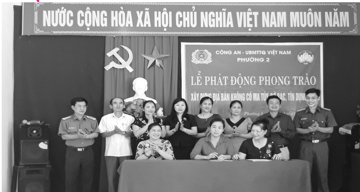
Công an - MTTQ Việt Nam phường 2, thành phố Đông Hà, phát động phong trào Xây dựng địa bàn không có ma túy, cờ bạc, tín dụng đen.

Đảng, xây dựng chính quyền; giúp cấp ủy, chính quyền các cấp nắm chắc tình hình, tâm tư, nguyện vọng của Nhân dân; đồng thời thực hiện tốt chức năng bảo vệ quyền và lợi ích hợp pháp, chính đáng của Nhân dân, là cơ sở chính trị, là “cầu nối” góp phần củng cố vững chắc mối quan hệ mật thiết giữa Đảng, chính quyền với Nhân dân.