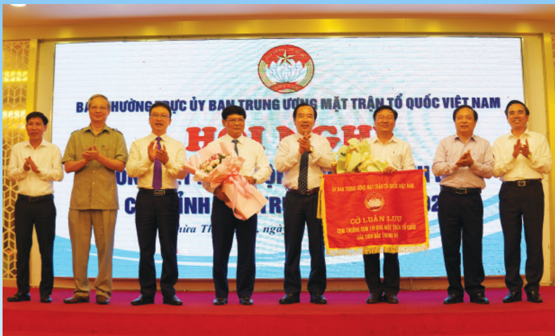
Đồng chí Ngô Sách Thực, Phó Chủ tịch Ủy ban TW MTTQ Việt Nam trao cờ luân lưu cụm trường cụm thi đua Bắc trung bộ cho Ủy ban MTTQ Việt Nam tỉnh Quảng Trị