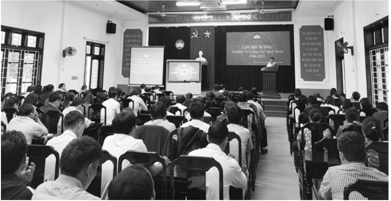
Tập huấn triển khai hệ thống các phần mềm ứng dụng trong Công tác Mặt trận dành cho cán bộ cốt cán Mặt trận các cấp trong tỉnh. Ảnh NP

viên chủ trì; ứng phó hiệu quả với những hạn chế giao tiếp do dịch bệnh Covid-19; (iii) Niềm tin có được từ Nhân dân, tổ chức, nhà hảo tâm nhờ công khai, minh bạch và thực hành dân chủ sâu rộng trong mọi hoạt động của Mặt trận; (iv) Công cụ hiệu quả nhất về quản trị, nâng cao năng lực giám sát của Nhân dân đối với các hoạt động, nhất là hoạt động cứu trợ, thiện nguyện.