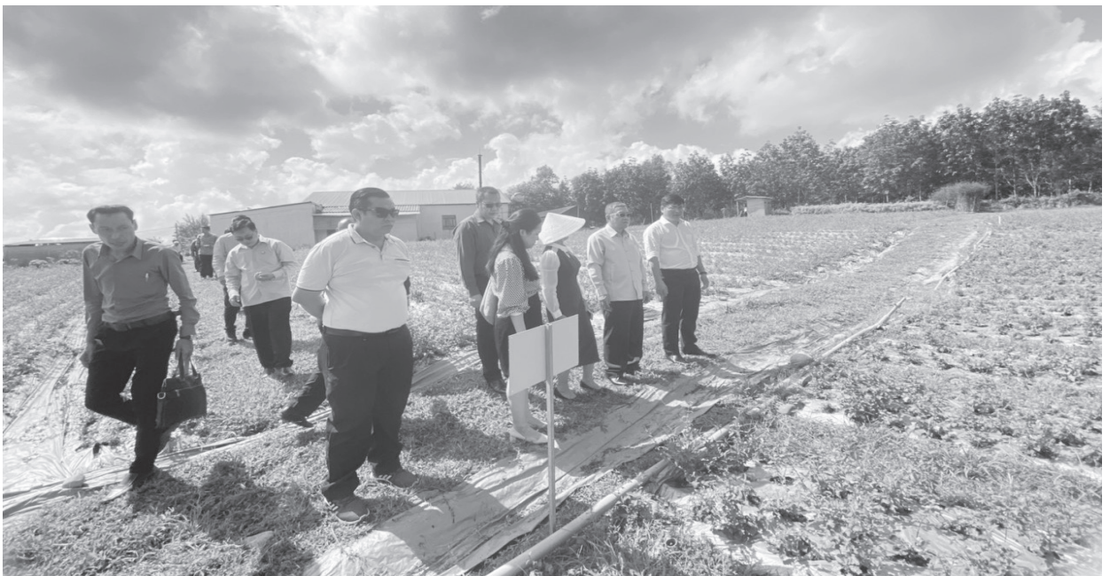
Đoàn công tác Ủy ban Trung ương Mặt trận Lào xây dựng đất nước, tham quan các mô hình sản xuất nông nghiệp tại tỉnh Quảng Trị.

6/2022, Ủy ban MTTQ Việt Nam tỉnh đã tổ chức đoàn đại biểu Mặt trận và Dân vận sang thăm, hội đàm và trao đổi kinh nghiệm trong công tác vận động quần chúng với Ủy ban Mặt trận Lào xây dựng đất nước tỉnh Salavan (tỉnh Salavan – Lào); Tháng 7/2022, Ban Thường trực Ủy Ban MTTQ Việt Nam tỉnh đã đón đoàn Ủy ban Mặt trận Lào xây dựng đất nước tỉnh Savannakhet sang thăm, hội đàm trao đổi kinh nghiệm công tác mặt trận tại tỉnh Quảng Trị; Tháng 11/2022, đoàn Ủy ban Trung ương Mặt trận Lào xây