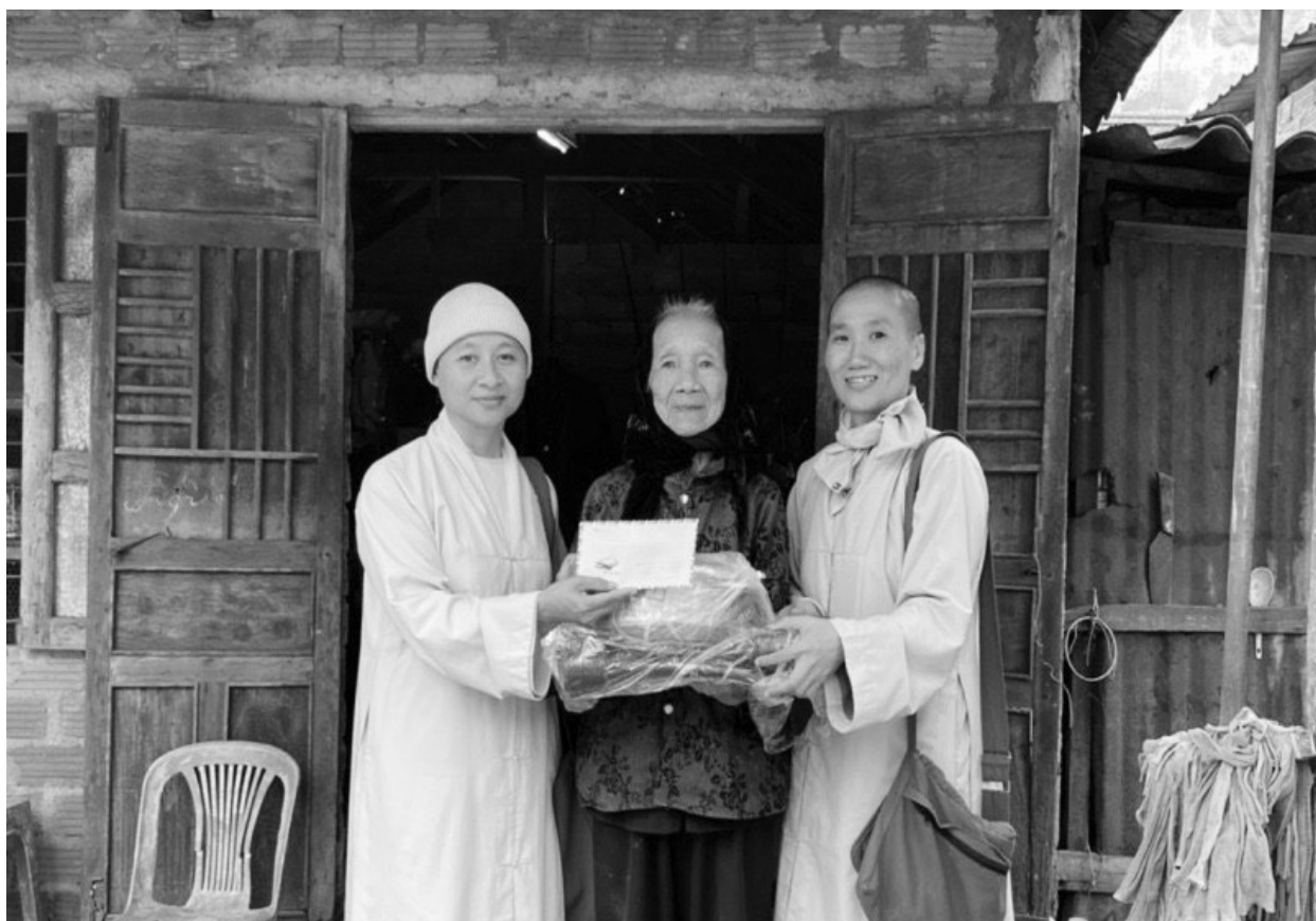
Phật giáo Hải Lăng chăm lo tết cho người nghèo, người có hoàn cảnh khó khăn.

đó: Ban Từ thiện xã hội huyện trao 1.944 suất quà, trị giá 775.040.000 đồng; các Chùa, Niệm Phật đường trên địa bàn huyện trao 2.765 suất quà; hỗ trợ xây dựng 02 căn nhà tình thương; tặng 10 xe đạp; trao 3 tấn gạo; tổ chức cấp phát cơm từ thiện cho các bệnh nhân có hoàn cảnh khó khăn tại Trung tâm y tế huyện Hải Lăng; trợ cấp gạo hàng tháng, trao quà trung thu cho các cháu thiếu nhi, tổng trị giá: 1.336.650.000 đồng. Riêng trong dịp Tết Nguyên đán Nhâm Dần 2022, Ban Trị sự Giáo hội Phật giáo Việt Nam huyện và các Chùa, Niệm Phật