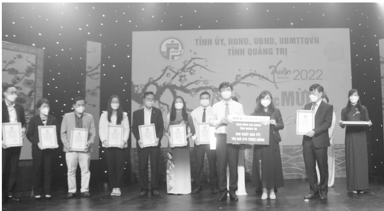
Lãnh đạo tỉnh tiếp nhận ủng hộ của các cá nhân, tổ chức cho Chương trình Nói vòng tay nhân ái Xuân Nhâm Dần 2022.

nhân ái – Tết cho người nghèo và nạn nhân chất độc da cam” Xuân Quý Mão 2023 được Ủy ban Mặt trận TQVN, sở Lao động, Thương binh và Xã hội, Hội chữ Thập đỏ và Đài Phát thanh – Truyền hình tỉnh Quảng Trị phối hợp phát động và triển khai từ ngày 15 tháng 11 năm 2022 và kết thúc vào ngày 20 tháng 01 năm 2023. Chương trình sẽ phát sóng trực tiếp trên sóng truyền hình, Fanpage, kênh youtube của Đài PTTH Quảng Trị, Fanpage Mặt trận Quảng Trị và kết nối các đài truyền hình trong khu vực vào lúc 20h00 ngày 03/01/2023 tại Trung tâm Văn hóa điện ảnh tỉnh. Ban Tổ chức chương trình phấn đấu vận động 20.000 suất quà để trao tặng cho các gia đình nghèo, cận nghèo, gia