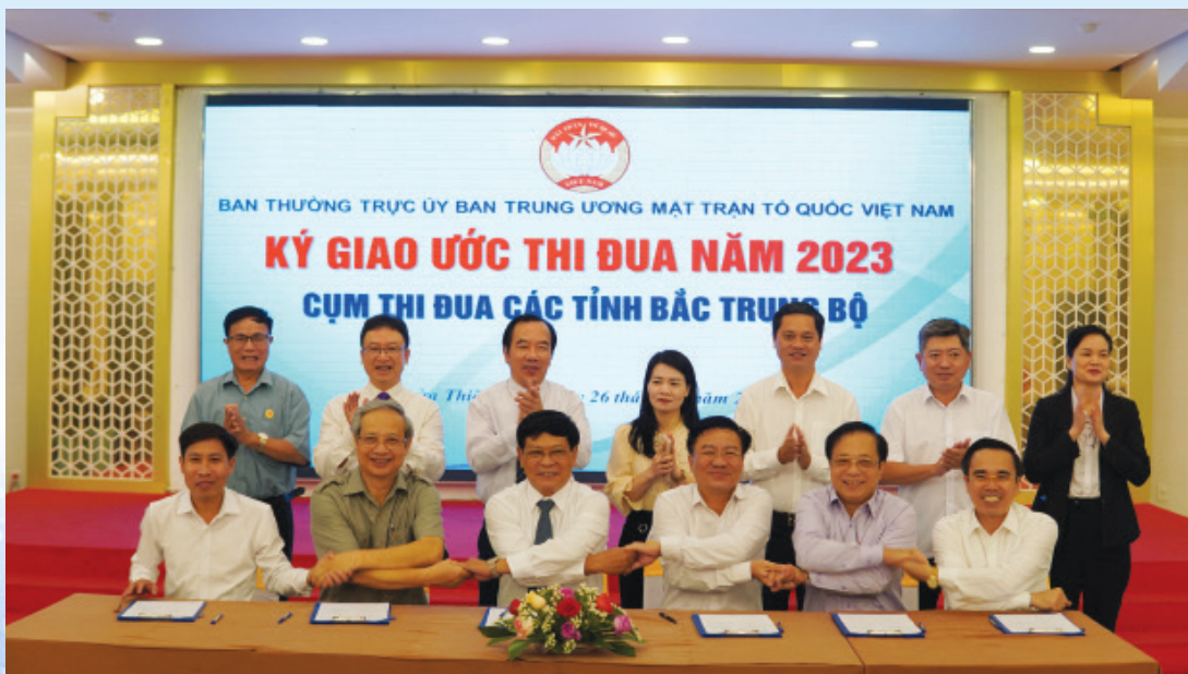
Cụm thi đua Bắc trung bộ ký giao ước thi đua năm 2023