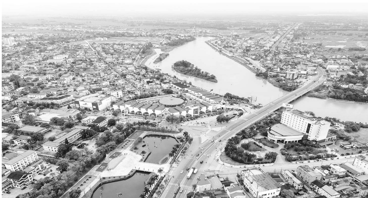
Thành phố Đông Hà hôm nay.

Trong quá trình thực hiện công tác vận động xây dựng đô thị văn minh, MTTQ các cấp của thành phố đã chủ động thực hiện chương trình phối hợp thống nhất hành động với chính quyền, các ban, ngành, đoàn thể triển khai thực hiện đến tận cán bộ, công chức, đoàn viên, hội viên và đến từng hộ gia đình nhằm tạo ra một phong trào rộng khắp ở khu dân cư trên toàn địa bàn thành phố.