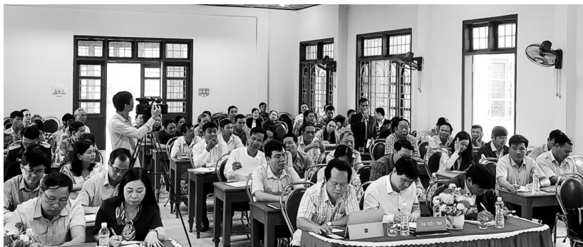
Hội nghị tiếp xúc cử tri sau kỳ họp thứ tư, Quốc hội Khoá XV tại địa bàn thành phố Đông Hà.

Thứ hai, Mặt trận Tổ quốc Việt Nam và các đoàn thể chính trị - xã hội các cấp thường xuyên tuyên truyền, vận động nhân dân chủ động tiếp cận, tự giác tham gia hưởng ứng các chủ trương, chính sách của Đảng, pháp luật của Nhà nước và địa phương. Nâng cao hiệu quả, ý nghĩa và tính thiết thực trong phát động các phong trào thi đua, các cuộc vận động; các hoạt động phối hợp với chính quyền các cấp; vị trí, vai trò, hiệu quả hoạt động của Mặt trận Tổ quốc Việt Nam và các tổ chức chính trị - xã hội đối với thực hiện dân chủ ở cơ sở. Kịp thời, nhạy bén trong nắm bắt tâm tư, nguyện vọng của các tầng lớp nhân dân