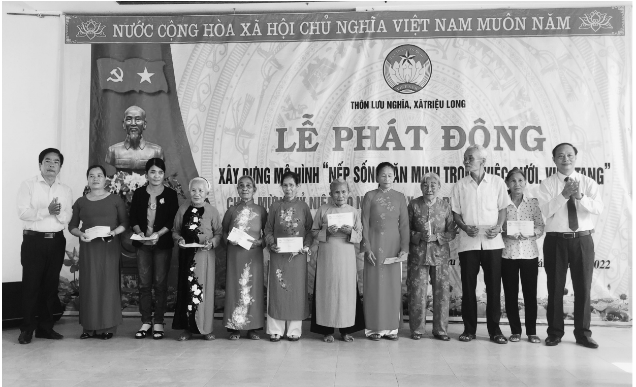
Lễ phát động mô hình “Nếp sống văn minh trong việc cưới, việc tang” tại KDC Lưu Nghĩa, xã Triệu Long, huyện Triệu Phong

Sáng 24/11/2021, tại Hội nghị Văn hóa toàn quốc triển khai thực hiện Nghị quyết Đại hội lần thứ XIII của Đảng về lĩnh vực văn hóa, đồng chí Tổng Bí thư Nguyễn Phú Trọng đã nhấn mạnh: “Có thể nói, phát triển văn hoá là một trong những vấn đề trọng tâm, một nội dung nổi bật trong Văn kiện Đại hội XIII của Đảng. Đây là lần đầu tiên trong văn kiện Đại hội Đảng, Đảng ta đề cập một cách toàn diện và sâu sắc đến lĩnh vực văn hoá,