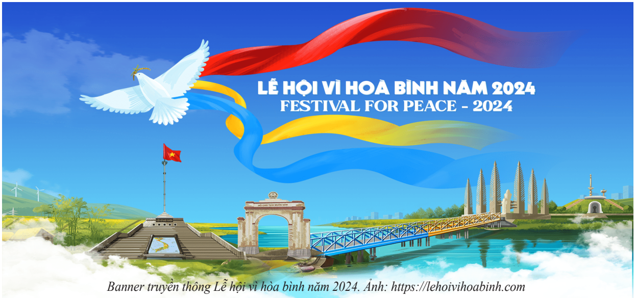
Banner truyền thông Lễ hội vì hòa bình năm 2024.

D ại hội đại biểu MTTQ Việt Nam tỉnh Quảng Trị lần thứ XIII, nhiệm kỳ 2024-2029 sẽ diễn ra từ ngày 08 đến ngày 09/8/2024 tại thành phố Đông Hà. Đây là sự kiện chính trị quan trọng đối với MTTQ Việt Nam và các tầng lớp Nhân dân tỉnh Quảng Trị; góp phần củng cố niềm tin của Nhân dân đối với Đảng và Nhà nước, phát huy sức mạnh khối đại đoàn kết toàn dân tộc, tạo khí thế, xung lực mới trong công cuộc xây dựng và bảo vệ Tổ quốc; đồng thời, phát huy mạnh mẽ tính tự chủ, năng động, sáng tạo và tôn trọng nguyên tắc hiệp thương dân chủ trong tổ chức và hoạt động của MTTQ Việt Nam.