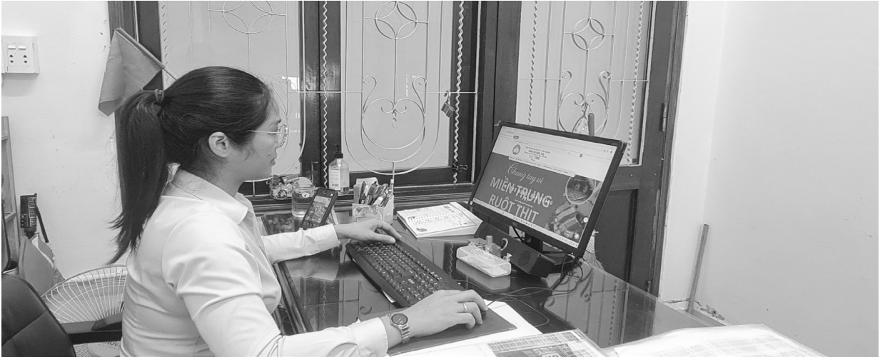
Cán bộ công chức Ủy ban MTTQ Việt Nam thành phố Đông Hà ứng dụng dụng CNTT trong công việc.

Trong thời gian qua, Ủy ban MTTQ Việt Nam thành phố Đông Hà đã tích cực, chủ động triển khai thực hiện hệ thống phần mềm ứng dụng chuyển đổi số nhằm đem lại tiện ích, giảm thời gian, chi phí góp phần thực hiện đổi mới phương thức hoạt động hiệu lực, hiệu quả trong mọi hoạt động của MTTQ các cấp thành phố.