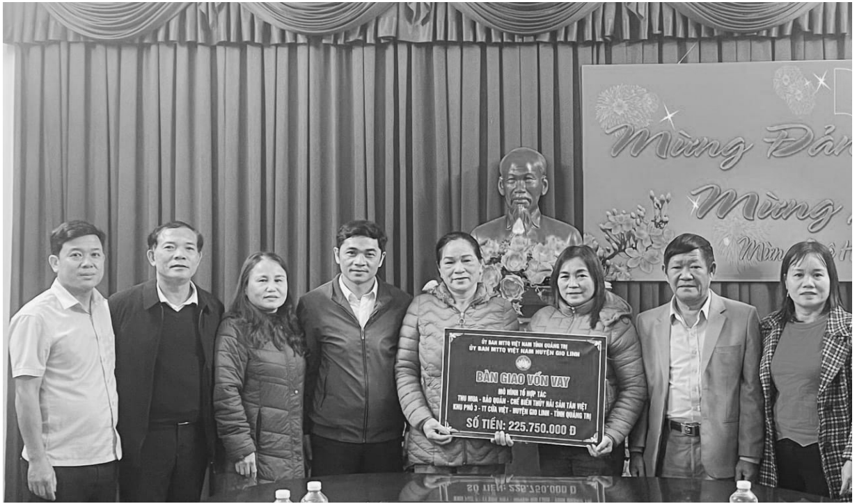
Ủy ban MTTQ Việt Nam huyện Gio Linh bàn giao vốn vay cho mô hình Hợp tác thu mua, bảo quản, chế biến thủy hải sản Tân Việt.

gia Tổ hợp tác cảm ơn sự hỗ trợ của Ủy ban MTTQ Việt Nam các cấp và hi vọng trong thời gian tới sẽ tiếp tục nhận được nhiều sự quan tâm hơn nữa để chúng tôi có động lực phấn đấu trong cuộc sống”.