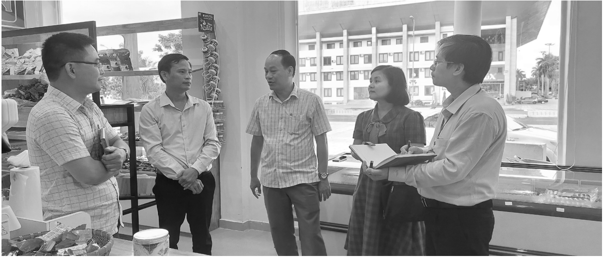
Ban Chỉ đạo Cuộc vận động "Người Việt Nam ưu tiên dùng hàng Việt Nam" tỉnh kiểm tra, khảo sát các mô hình sản xuất, kinh doanh thực hiện Cuộc vận động "Người Việt Nam ưu tiên dùng hàng Việt Nam".

Cuộc vận động "Người Việt Nam ưu tiên dùng hàng Việt Nam" là chủ trương lớn của Đảng, có ý nghĩa quan trọng đối với sự phát triển của đất nước, thể hiện niềm tự hào, tự tôn dân tộc của mỗi người dân, góp phần nâng cao ý thức của người tiêu dùng trong nước đối với hàng hóa nội địa. Đồng thời cũng là thời cơ thuận lợi cho các doanh nghiệp khẳng định năng lực, bản lĩnh của mình, không ngừng nâng cao hiệu quả quản lý, đổi mới cải tiến kỹ thuật và công nghệ sản xuất nhằm tạo ra được những sản phẩm có chất lượng cao, tạo dựng và giữ vững thương hiệu hàng hóa Việt Nam trên thị trường trong nước và quốc tế.