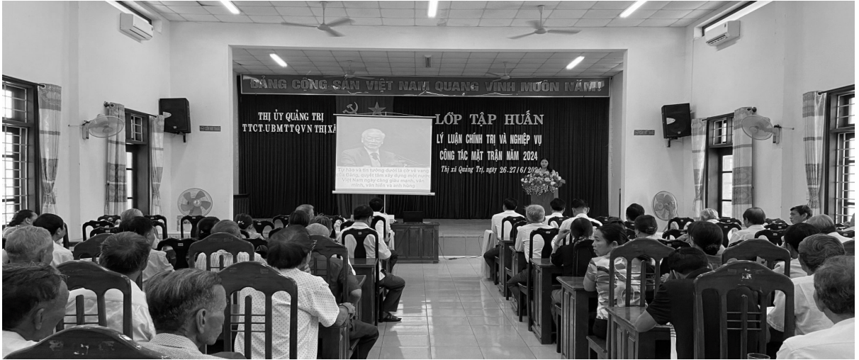
Ủy ban MTTQ Việt Nam thị xã tập huấn lý luận chính trị và nghiệp vụ công tác Mặt trận năm 2024.

Chủ tịch Ủy ban MTTQ Việt Nam thị xã Quảng Trị