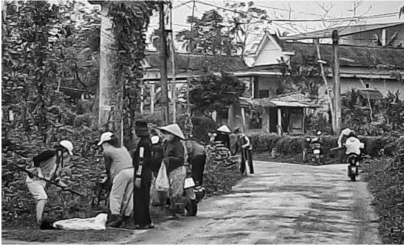
Người dân giáo xứ Tân Lương, xã Hải Chánh ra quân dọn vệ sinh môi trường

30% người dân theo đạo Công giáo và khoảng 5% theo Phật giáo. Do địa bàn rộng, người dân có đạo và không có đạo sống đan xen, là đơn vị được sáp nhập từ 3 thôn nên tình hình dân cư khá phức tạp. Trước tình hình đó, giáo xứ Tân Lương xây dựng mô hình “Xứ đạo bình yên, đảm bảo an ninh trật tự và chung tay xây dựng nông thôn mới” và hoạt động có hiệu quả cao.