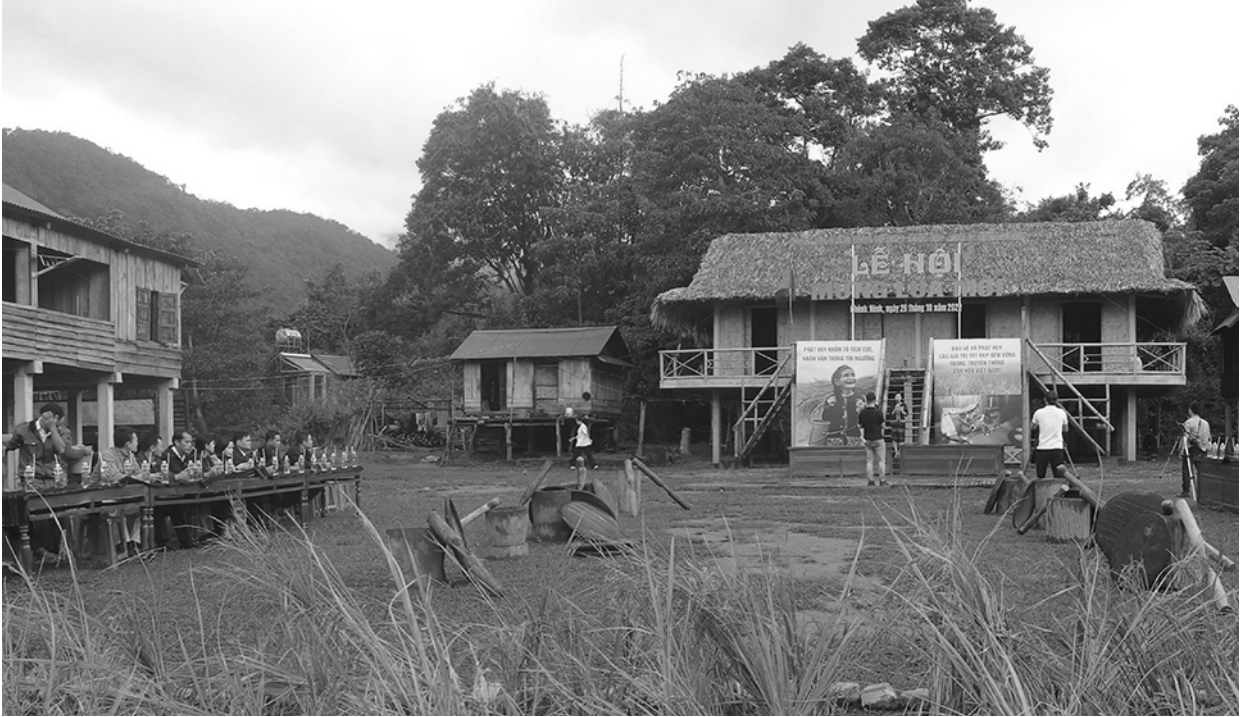
Nông dân Hương Hóa đẩy mạnh sản xuất, bảo vệ chủ quyền an ninh biên giới.

Hương Hóa là huyện miền núi, biên giới, nằm về phía Tây của tỉnh Quảng Trị, có diện tích tự nhiên 1.150,86km 2 với dân số trên 100 nghìn người, gồm 03 dân tộc chủ yếu Kinh, Vân Kiều, Pa Kô; trong đó đồng bào dân tộc thiểu số chiếm gần 50%. Toàn huyện có 19 xã và 02 thị trấn gồm 149 thôn, bản, khối, xóm; trong đó có 11 xã, thị trấn biên giới tiếp giáp với huyện Mường Noong, huyện Sê Pôn (tỉnh Savannakhet) và huyện Sa Muội (tỉnh Salavan) của nước Cộng hòa dân chủ nhân dân Lào với chiều dài biên giới gần 127km.