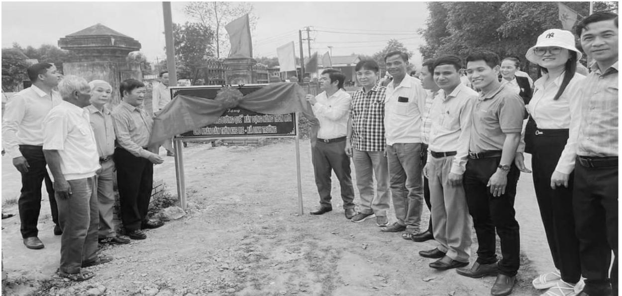
BTT UBMT huyện và các xã, thị trấn bàn giao công trình đường điện

Chủ tịch Ủy ban MTTQ Việt Nam huyện Gio Linh