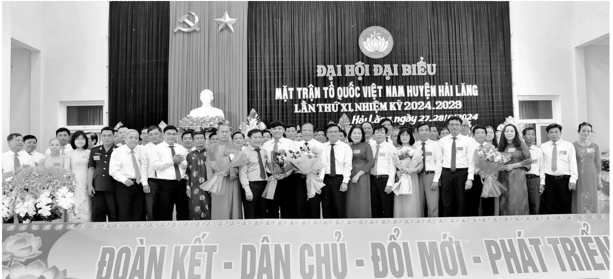
Đại hội đại biểu MTTQ Việt Nam huyện Hải Lăng lần thứ XI, nhiệm kỳ 2024 - 2029, với tinh thần "Đoàn kết - Dân chủ - Đổi mới - Phát triển".

Phó Chủ tịch Ủy ban MTTQ Việt Nam huyện Hải Lăng