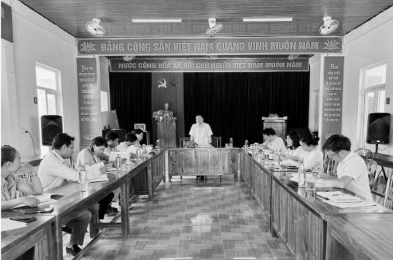
Đoàn công tác Ủy ban MTTQ Việt Nam tỉnh làm việc, nắm bắt tình hình nhân dân, đơn thư của người dân và hoạt động giám sát liên quan các dự án điện gió tại huyện Hướng Hóa.

Thời gian qua, hoạt động của Ban Thanh tra nhân dân (TTND), Ban Giám sát đầu tư của cộng đồng (GSĐTCCĐ) trên địa bàn tỉnh Quảng Trị ngày càng có vai trò quan trọng trong phát huy dân chủ cơ sở. Cùng với đó, sự tham gia của người dân với tinh thần tự nguyện, nỗ lực, tâm huyết trong hoạt động giám sát, góp phần ổn định an ninh trật tự, an toàn xã hội, xây dựng, phát triển kinh tế - xã hội địa phương.