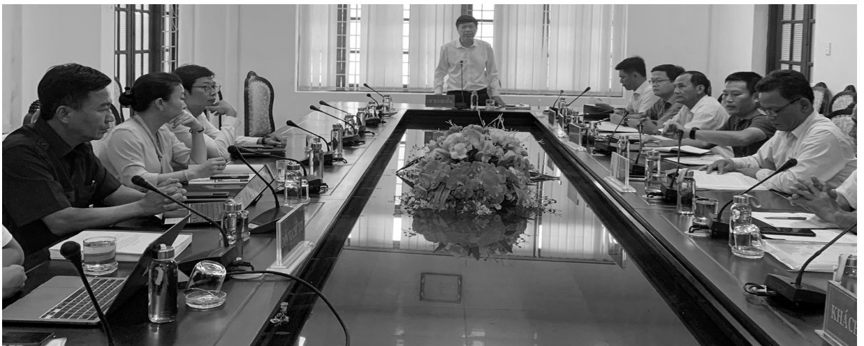
Nghiệm thu đề tài KH&CN cấp tỉnh: Xây dựng hệ thống phần mềm hỗ trợ thông tin, nhằm nâng cao hiệu quả trong công tác quản lý, điều hành để đảm bảo tính kịp thời, chính xác, an toàn và minh bạch hóa các hoạt động thiện nguyện trên địa bàn tỉnh Quảng Trị

triển khai, thực hiện như: Liên đoàn Lao động tỉnh với chương trình “75 nghìn sáng kiến vượt khó, phát triển”, “1 triệu sáng kiến- nỗ lực vượt khó, sáng tạo, quyết tâm chiến thắng đại dịch COVID-19”; Hội Cựu Chiến binh với phong trào “Vận động đoàn viên, hội viên hưởng ứng phong trào thi đua giúp nhau giảm nghèo và làm kinh tế giỏi”; mô hình “5 không 3 sạch”; vận động, hỗ trợ hội viên nghèo, hội viên khó khăn, hoạn nạn bằng các mô hình “hỗ trợ bò giống sinh sản”, “mô hình trồng nghệ” của Hội LHPN tỉnh; Hội Nông dân tỉnh với phong trào “Nông dân thi đua sản xuất, kinh doanh giỏi, đoàn kết giúp nhau làm giàu và giảm nghèo bền vững”; Tỉnh đoàn với mô hình ra mắt và vận hành website Quangtrimart.vn - Kênh hỗ trợ tiêu thụ sản phẩm của thanh niên khởi nghiệp Quảng Trị online; Mô hình “Đưa nước