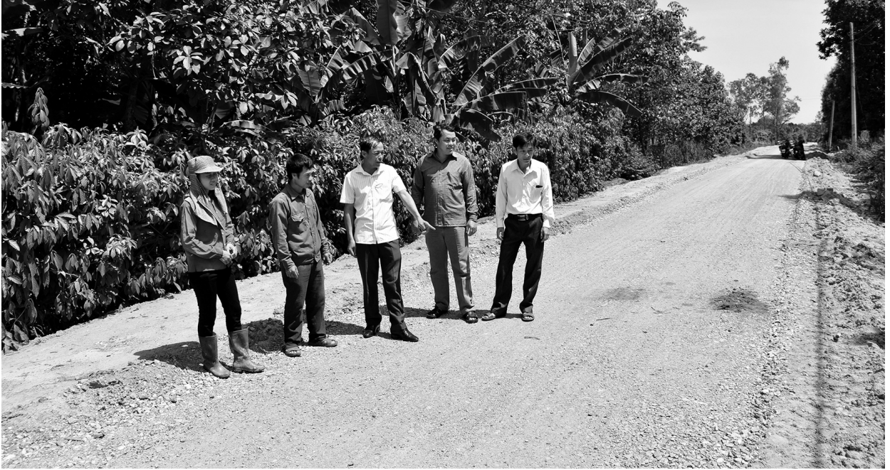
Người dân xã Trung Nam, huyện Vĩnh Linh giám sát việc thi công các công trình trên địa bàn

Đại diện, bảo vệ quyền và lợi ích hợp pháp, chính đáng của nhân dân là quyền, là vai trò, đồng thời là chức năng quan trọng của Mặt trận Tổ quốc Việt Nam trong tập hợp, xây dựng khối đại đoàn kết toàn dân tộc và bảo vệ Tổ quốc. Bằng nhiều hoạt động thiết thực, thời gian qua, Mặt trận Tổ quốc (MTTQ) huyện Vĩnh Linh đã thực hiện tốt quyền, vai trò, chức năng này, từ đó đã phát huy được sức dân trong tiến trình xây dựng và phát triển của quê hương.