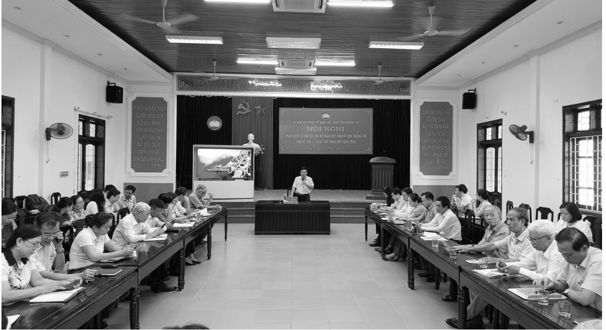
Ban Thường trực Ủy ban MTTQ Việt Nam tỉnh tổ chức Hội nghị phản biện dự thảo Quy hoạch tỉnh Quảng Trị thời kỳ 2021-2030, tầm nhìn đến năm 2050.