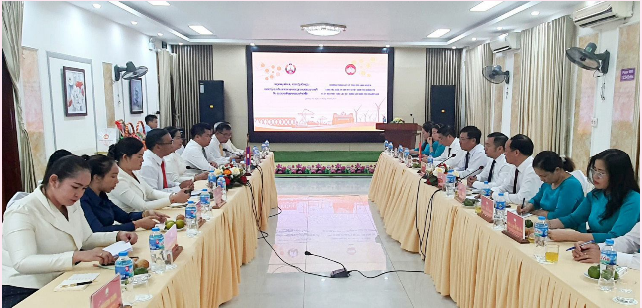
Hội đàm trao đổi kinh nghiệm công tác giữa Ủy ban MTTQ Việt Nam tỉnh và Ủy ban Mặt trận Lào xây dựng đất nước tỉnh Champasak.

2 nước. Tổ chức các hoạt động tiêu biểu trong khuôn khổ đối ngoại nhân dân: Thường niên 2 năm/lần, Ủy ban MTTQ Việt Nam tỉnh Quảng Trị và Ủy ban Mặt trận Lào Xây dựng đất nước tỉnh Salavan, Savannakhet, Champasak tổ chức ký kết biên bản ghi nhớ hợp tác, thường xuyên tổ chức Hội nghị gặp gỡ, trao đổi kinh nghiệm; Tổ chức thực hiện công tác hỗ trợ an sinh xã hội, trong đó, năm 2024, Ủy ban MTTQ Việt Nam tỉnh đã hỗ trợ 05 suất học bổng, mỗi suất 9 triệu đồng, tổng trị giá 45 triệu đồng cho 05 em sinh viên nghèo của các bản kết nghĩa dọc biên giới Lào - Việt Nam của huyện Sa Muội, tỉnh Salavan đang học tập tại Trường Cao đẳng Y tế Quảng Trị; tặng ngôi nhà tình nghĩa Việt - Lào trị giá 80 triệu đồng cho gia đình bà Ta Me ở Bản Phin B, huyện Sa Muội, tỉnh Salavan; hỗ trợ 30 suất quà, mỗi suất 1 triệu đồng, tổng trị giá 30 triệu đồng cho 30 cá nhân tiêu biểu trong cộng đồng các bộ tộc Lào có nhiều đóng góp trong xây dựng tình hữu nghị tại tỉnh Champasak.