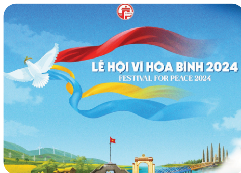
Bộ nhận diện Lễ hội Vì Hòa Bình 2024.