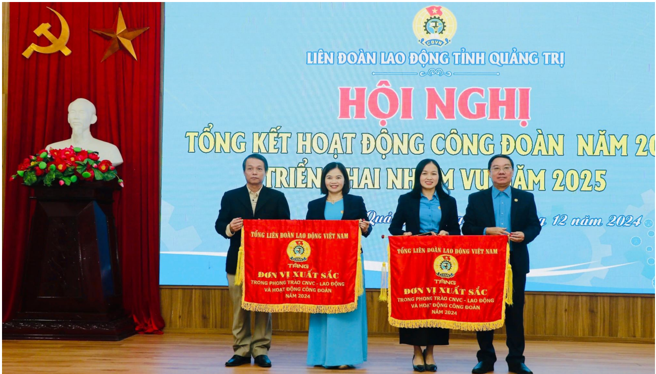
Hội nghị tổng kết hoạt động công đoàn năm 2024 và triển khai nhiệm vụ năm 2025

Năm 2024, với Chủ đề: “Tập trung đưa Nghị quyết Đại hội Công đoàn các cấp vào cuộc sống; thi đua lập thành tích chào mừng kỷ niệm 95 năm Ngày thành lập Công đoàn Việt Nam và 35 năm tái lập tỉnh Quảng Trị”, các cấp Công đoàn tỉnh Quảng Trị đã hăng hái thi đua, hướng về cơ sở, chủ động triển khai hoạt động có trọng tâm, trọng điểm và đạt được nhiều kết quả nổi bật.