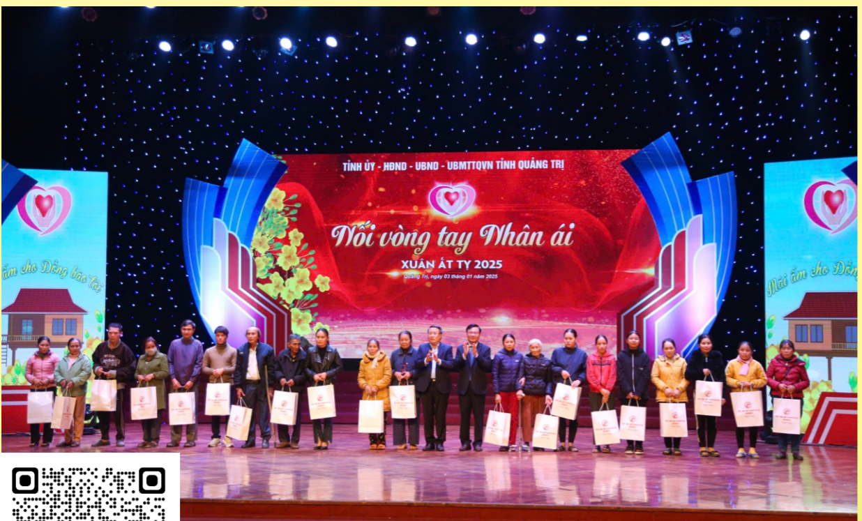
Quyền Chủ tịch UBND tỉnh Hà Sỹ Đồng và Chủ tịch Ủy ban MTTQ Việt Nam tỉnh Đào Mạnh Hùng tặng quà cho người nghèo