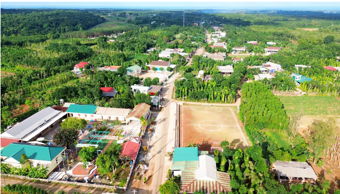
Diện mạo từ nông thôn đến đô thị ở huyện Vĩnh Linh không ngừng đổi thay, khởi sắc