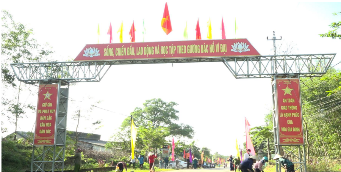
Xã Vĩnh Thủy phát động ra quân vệ sinh môi trường, hưởng ứng xây dựng khu dân cư “sáng, xanh, sạch, đẹp, an toàn, văn minh”

P hong trào xây dựng mô hình khu dân cư “sáng, xanh, sạch, đẹp, an toàn, văn minh” thời gian qua tại các địa phương trên địa bàn huyện Vĩnh Linh ngày càng triển khai đi vào thực tế và tạo sức lan tỏa sâu rộng. Từ đó đã mang lại hiệu quả thiết thực, góp phần xây dựng nên nhiều khu dân cư kiểu mẫu, nâng cao những tiêu chí nông thôn mới - đô thị văn minh ở mỗi xã, thị trấn.