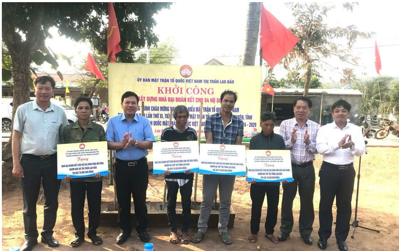
Ủy ban MTTQ Việt Nam thị trấn Lao Bảo, huyện Hướng Hóa khởi công xây dựng nhà Đại đoàn kết cho hộ nghèo.

X ây dựng nông thôn mới là một trong những nhiệm vụ chính trị trọng tâm được MTTQ và các tổ chức chính trị - xã hội các cấp tập trung triển khai, thực hiện. Trong những năm qua, Mặt trận Tổ quốc và các tổ chức chính trị - xã hội các cấp trong tỉnh đã bám sát cơ sở, bám sát từng tiêu chí hướng về địa bàn khu dân cư, phát huy tinh thần sáng tạo và tự quản của Nhân dân, triển khai thực hiện các cuộc vận động, các phong trào thi đua yêu nước bằng nhiều hình thức, cách làm sáng tạo, thiết thực, hiệu quả, tạo kết quả thực chất, vì mục tiêu cuối cùng là nâng cao chất