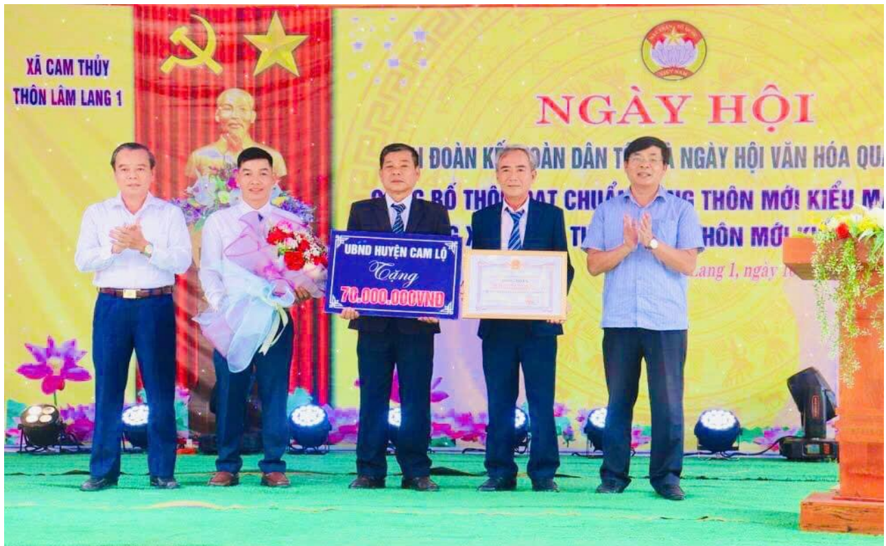
UBND huyện Cam Lộ trao giấy khen và kinh phí hỗ trợ thôn Lâm Lang 1, xã Cam Thủy đạt chuẩn nông thôn mới kiểu mẫu.

2024 và cơ bản hoàn thành các tiêu chí huyện NTM kiểu mẫu vào năm 2025. Trong thời gian tới, huyện xác định các giải pháp cụ thể như sau: