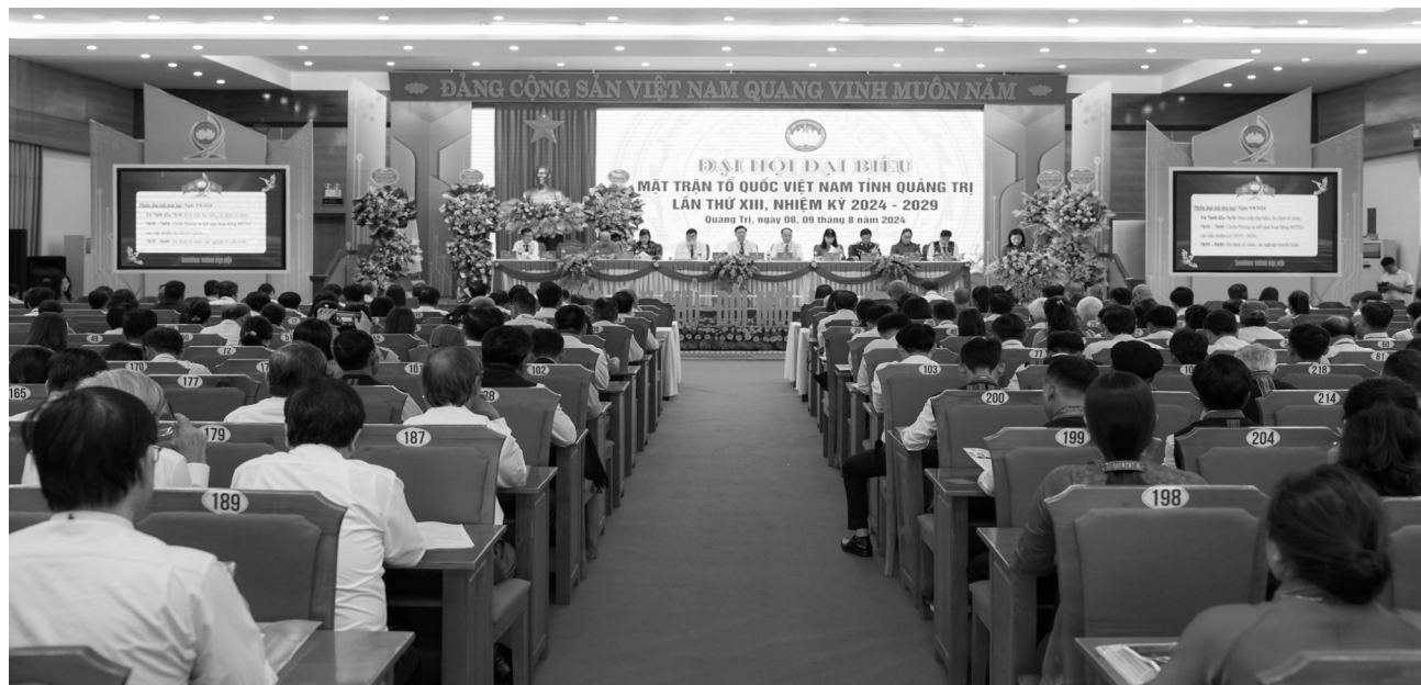
Đại hội đại biểu MTTQ Việt Nam tỉnh Quảng Trị lần thứ XIII, nhiệm kỳ 2024 - 2029.

UVBTV Tỉnh ủy, Bí thư Đảng đoàn, Chủ tịch Ủy ban MTTQ Việt Nam tỉnh