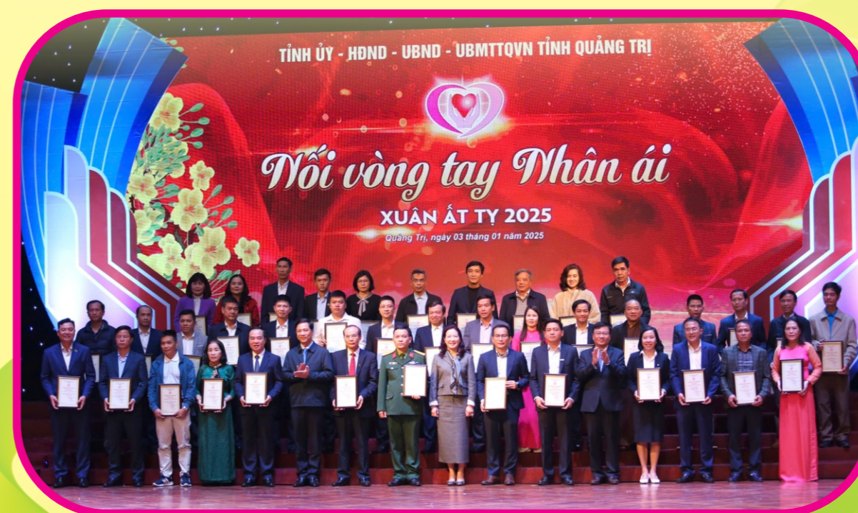
Chương trình "Nói vòng tay nhân ái" xuân Ất Tỵ - 2025 được tổ chức vào tối ngày 03/01/2025 đã nhận được nhiều phần quà và kinh phí ủng hộ của các tổ chức, cá nhân hảo tâm trong và ngoài tỉnh với tổng trị giá khoảng 170 tỉ đồng và 30.000 suất quà Tết cho người nghèo.