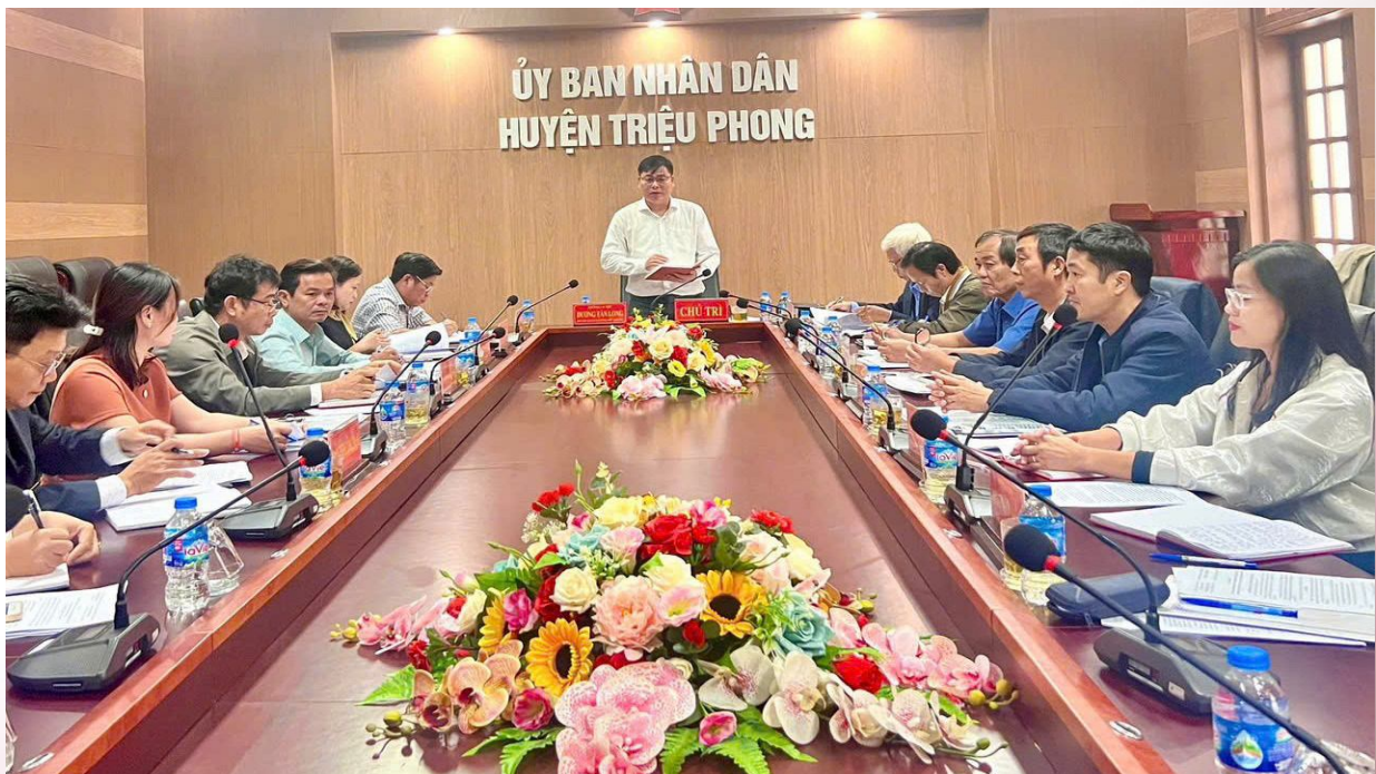
Các HĐTV Ủy ban MTTQ Việt Nam tỉnh tham gia giám sát chuyên đề thực hiện pháp luật về tiếp công dân, giải quyết khiếu nại, tố cáo của Chủ tịch Ủy ban nhân dân các cấp năm 2024

Thứ năm, hoạt động của các tổ chức tư vấn cần thường xuyên duy trì, giữ mối liên hệ, trao đổi, cung cấp thông tin và công tác thực hiện nhiệm vụ với Ban Thường trực, các ban chuyên môn của Ủy ban MTTQ Việt Nam cùng cấp và tổ chức tư vấn trong hệ thống Mặt trận các cấp. Phát huy dân chủ, tập trung trí tuệ, tăng cường nghiên cứu các cơ chế, chính sách và tình hình thực tiễn để nâng cao chất lượng tham gia, tư vấn, đề xuất của các tổ chức tư vấn./