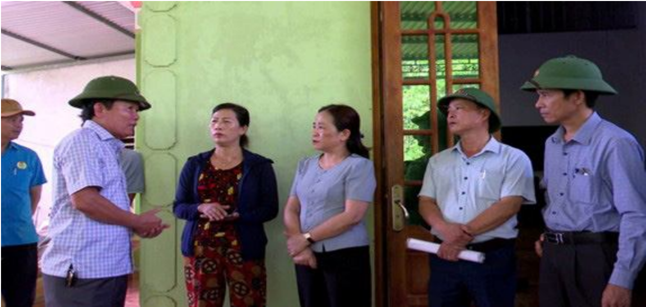
Các đồng chí lãnh đạo tỉnh, lãnh đạo huyện Gio Linh gặp gỡ, trao đổi với các hộ dân đang vướng mắc về công tác GPMB.

Chủ tịch Ủy ban MTTQ Việt Nam huyện Gio Linh