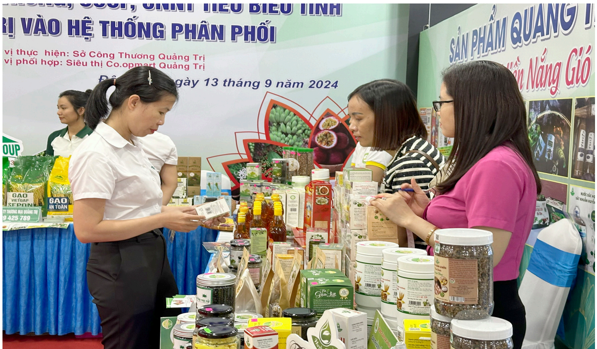
Các doanh nghiệp tham gia trưng bày sản phẩm tại chương trình hợp tác, kết nối sản phẩm đặc trưng, sản phẩm OCOP, công nghiệp nông thôn tiêu biểu tỉnh Quảng Trị vào hệ thống phân phối năm 2024

Cuộc vận động “Người Việt Nam ưu tiên dùng hàng Việt Nam” được Bộ Chính trị phát động từ năm 2009. Qua 15 năm triển khai, Cuộc vận động đã đạt được nhiều kết quả tích cực, nhận được sự hưởng ứng nhiệt tình của đông đảo Nhân dân. Cuộc vận động được các cấp, các ngành trong tỉnh triển khai thực hiện bằng nhiều hình thức và từng bước làm thay đổi nhận thức, hành vi của người tiêu dùng khi ưu tiên mua và sử dụng hàng hóa có xuất xứ từ Việt Nam.