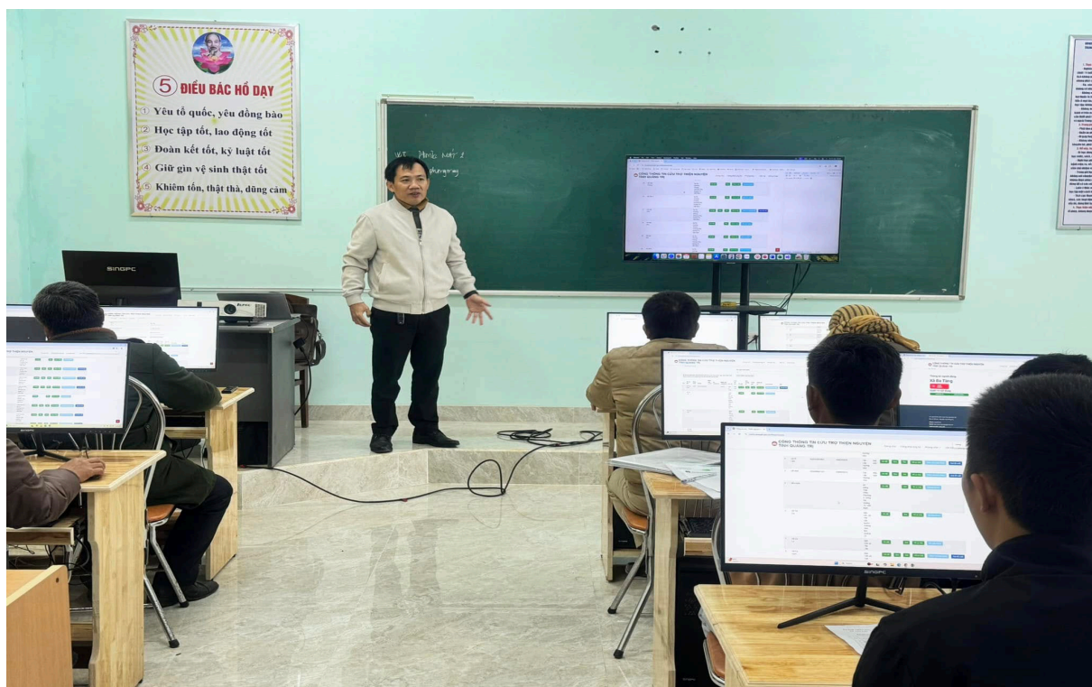
Ban thường trực Ủy ban MTTQ Việt Nam tỉnh Quảng Trị tổ chức tập huấn ứng dụng công nghệ thông tin trong công tác mặt trận cho cán bộ mặt trận các cấp huyện Hướng Hóa.

Phát triển khoa học, công nghệ, đổi mới sáng tạo và chuyển đổi số quốc gia trong giai đoạn hiện nay để có lực lượng sản xuất hiện đại, nhằm xây dựng mô hình chủ nghĩa xã hội Việt Nam trong kỷ nguyên mới. Vì vậy, cần sự quan tâm, ủng hộ của tất cả người dân và doanh nghiệp. Mỗi người, tùy theo năng lực, khả năng của mình, hãy tích cực tham gia phong trào “học tập số” để trở thành những “công dân số”, góp phần đạt mục tiêu Nghị quyết 57-NQ/TW đề ra./.