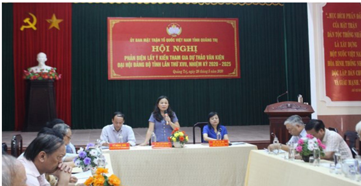
Hội nghị phản biện, lấy ý kiến tham gia dự thảo văn kiện Đại hội Đảng bộ tỉnh Quảng Trị lần thứ XVII.

Thời gian qua, công tác phản biện của MTTQ Việt Nam các cấp trong tỉnh luôn nhận được sự quan tâm lãnh đạo, chỉ đạo kịp thời của các cấp ủy Đảng, sự phối hợp tạo điều kiện thuận lợi của chính quyền và các cơ quan, đơn vị liên quan. Hoạt động phản biện của MTTQ Việt Nam các cấp trong tỉnh đã trở thành một nhiệm vụ quan trọng, trong công tác tham gia xây dựng Đảng, xây dựng chính quyền.