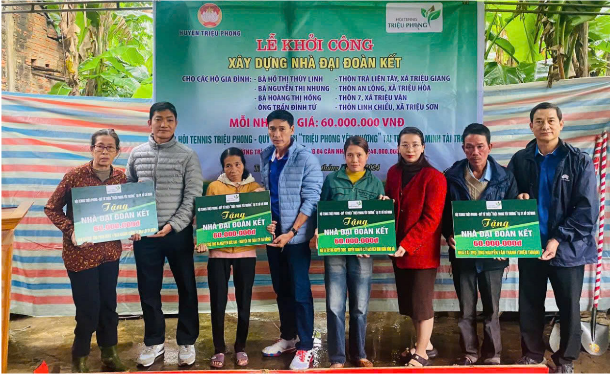
Hội Tennis “Triệu Phong yêu thương” trao biểu tượng trưng hỗ trợ nhà Đại đoàn kết cho các hộ nghèo.

Thời gian qua, Hội Tennis “Triệu Phong yêu thương” sinh sống, làm việc tại Thành Phố Hồ Chí Minh đã có nhiều cách làm hay để hướng về quê hương thông qua nhiều hoạt động nhân đạo từ thiện, qua đó góp phần cùng với huyện Triệu Phong làm tốt công tác an sinh xã hội.