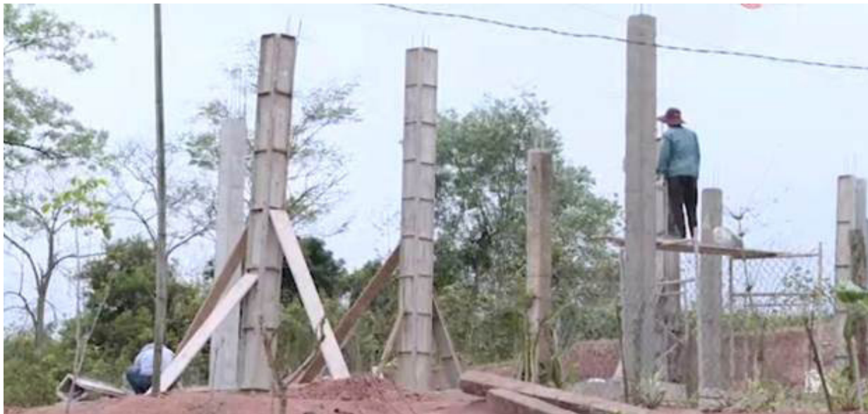
Ngôi nhà của ông Hồ Sản, xã Lĩa đang được xây dựng

Thực hiện Chỉ thị số 42 ngày 15/1/2025 của Ban Thường vụ (BTV) Tỉnh ủy về tăng cường sự lãnh đạo của các cấp ủy đảng đối với chương trình xóa nhà tạm, nhà đột nát trên địa bàn tỉnh; thông báo Kết luận số 01 ngày 9/1/2025 của Ban Chỉ đạo (BCĐ) xóa nhà tạm, nhà đột nát tỉnh, ngày 17/1/2025, BTV Huyện ủy Hướng Hóa ban hành Quyết định số 2202 thành lập BCĐ huyện Hướng Hoá.