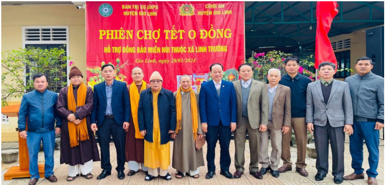
Phật giáo huyện Gio Linh tổ chức phiên chợ O đồng.

Quảng Trị là mảnh đất mang các giá trị văn hoá, lịch sử đặc trưng, dấu ấn riêng của mảnh đất Miền Trung “Gió Lào – Cát trắng”, chiến tranh và thiên nhiên khắc nghiệt hình thành con người Quảng Trị phẩm chất đáng quý góp phần xây dựng và phát triển văn hoá xã hội trong bối cảnh hội nhập Quốc tế. Những giá trị văn hoá, lịch sử đó không thể không kể đến sự đóng góp của Phật giáo Tĩnh nhà. Như chúng ta đã biết, Phật giáo Quảng Trị từ lâu đã gắn bó mật thiết với đời sống của nhân dân, không chỉ với vai trò là một tôn giáo mà còn là một phần quan trọng trong quá trình phát triển văn hóa, đạo đức và xã hội của địa phương. Trải qua nhiều biến cố lịch sử, từ thời kỳ chiến tranh khốc liệt đến những năm tháng đất nước đổi mới, Phật giáo vẫn luôn đồng hành cùng dân tộc, góp phần xây dựng quê hương Quảng Trị ngày càng giàu mạnh, văn minh. Từ khi Giáo hội Phật giáo Việt Nam