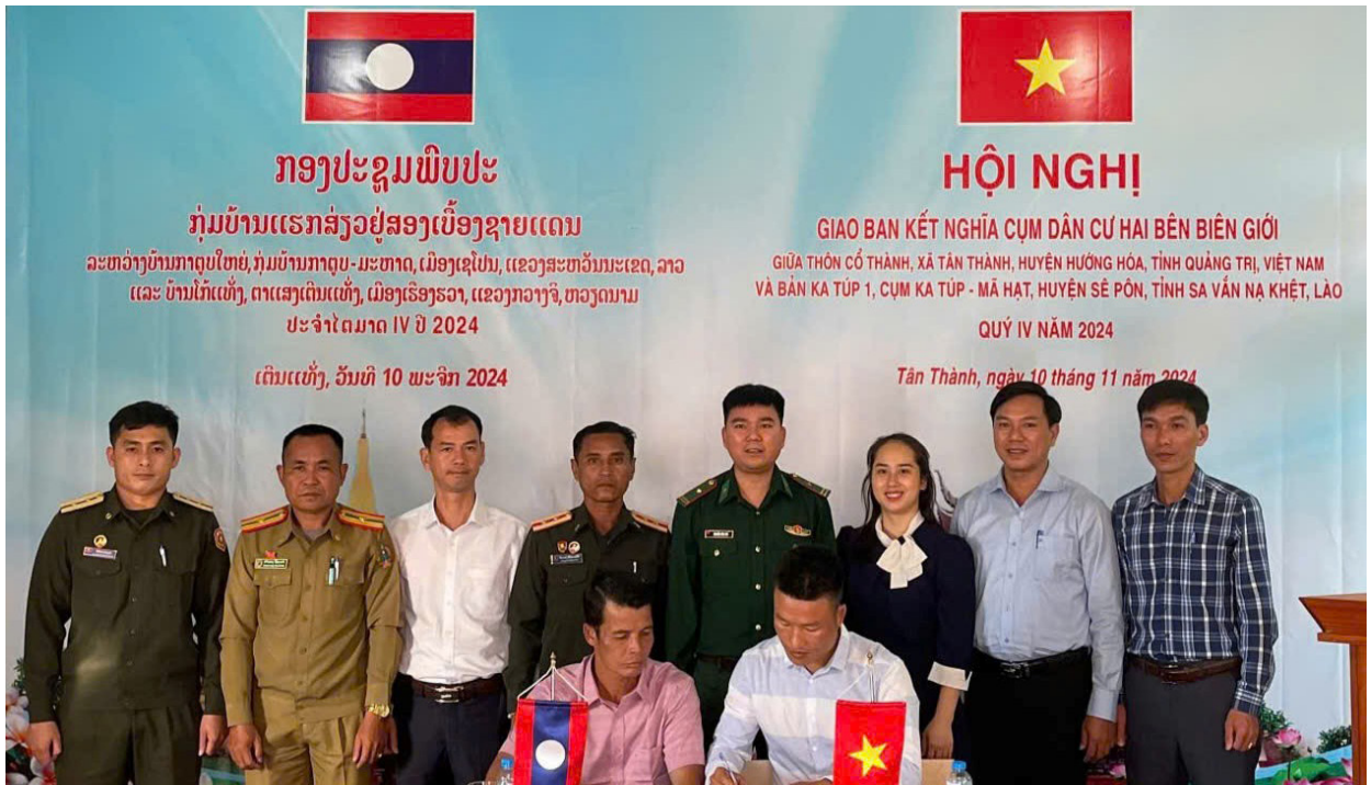
Giao ban kết nghĩa Cùm dân cư hai bên biên giới giữa thôn Cổ Thành, xã Tân Thành và bản Ka Túp 1, Cùm Ka Túp - Mã Hạt.

Phó Chủ tịch Ủy ban MTTQ Việt Nam huyện Hướng Hóa