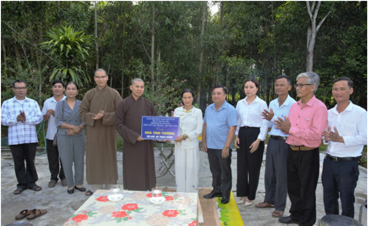
Ban Trị sự GHPG Việt Nam thị xã Quảng Trị tặng “Nhà Tình thương” cho hộ dân tại xã Triệu Thượng, huyện Triệu Phong.

Hải Lăng...Ban Từ thiện xã hội Phật giáo tỉnh. Những hoạt động này không chỉ giúp cải thiện chất lượng cuộc sống mà còn thể hiện rõ tinh thần từ bi, nhân ái của đồng bào có đạo, góp phần giảm bớt khó khăn, mang lại niềm vui, hy vọng cho những người không may mắn trong xã hội.