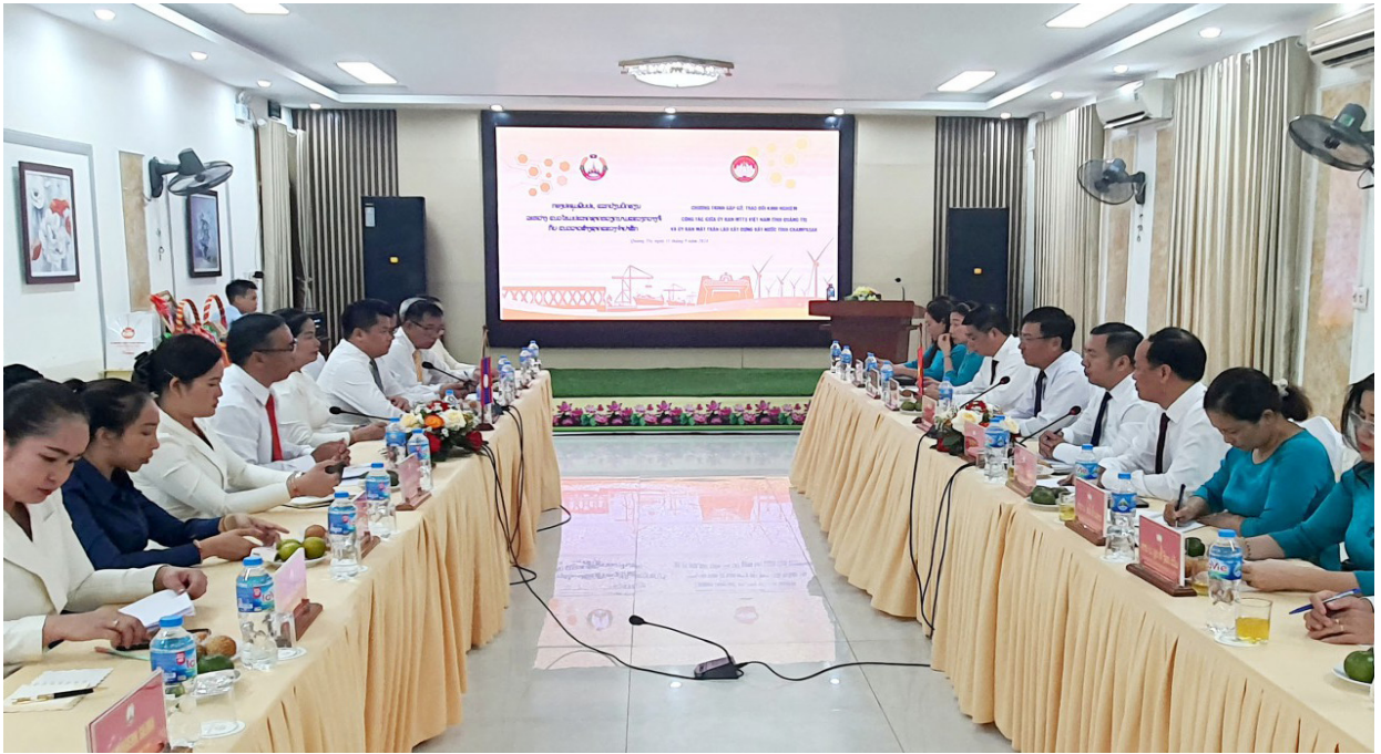
Hội đàm trao đổi kinh nghiệm công tác giữa Ủy ban MTTQ Việt Nam tỉnh và Ủy ban Mặt trận Lào xây dựng đất nước tỉnh Champasak.

“Quần chúng tham gia tự quản đường biên, cột mốc, giữ gìn an ninh trật tự thôn bản, khu vực biên giới”, nâng cao chất lượng mô hình “Kết nghĩa Bản-Bản” (Quảng Trị - Salavan (06 cặp) và Quảng Trị - Savannakhet (20 cặp) đổi diện hai bên biên giới; tổ chức sơ kết 15 năm kết nghĩa cụm dân cư hai bên biên giới; tổ chức “Chợ phiên biên giới Lao Bảo” với 50 gian hàng của các tiểu thương ở tỉnh Quảng Trị và các bản làng giáp biên giới của huyện Sê Pôn, tỉnh Savanakhet, Lào góp phần quảng bá các sản phẩm nông sản, sản phẩm đặc trưng của địa phương và mang đến cho du khách cơ hội trải nghiệm văn hóa đặc sắc của các dân tộc vùng cao thông qua những chương trình biểu diễn nghệ thuật dân gian, âm nhạc truyền thống. Hằng năm, nhân kỷ niệm Ngày