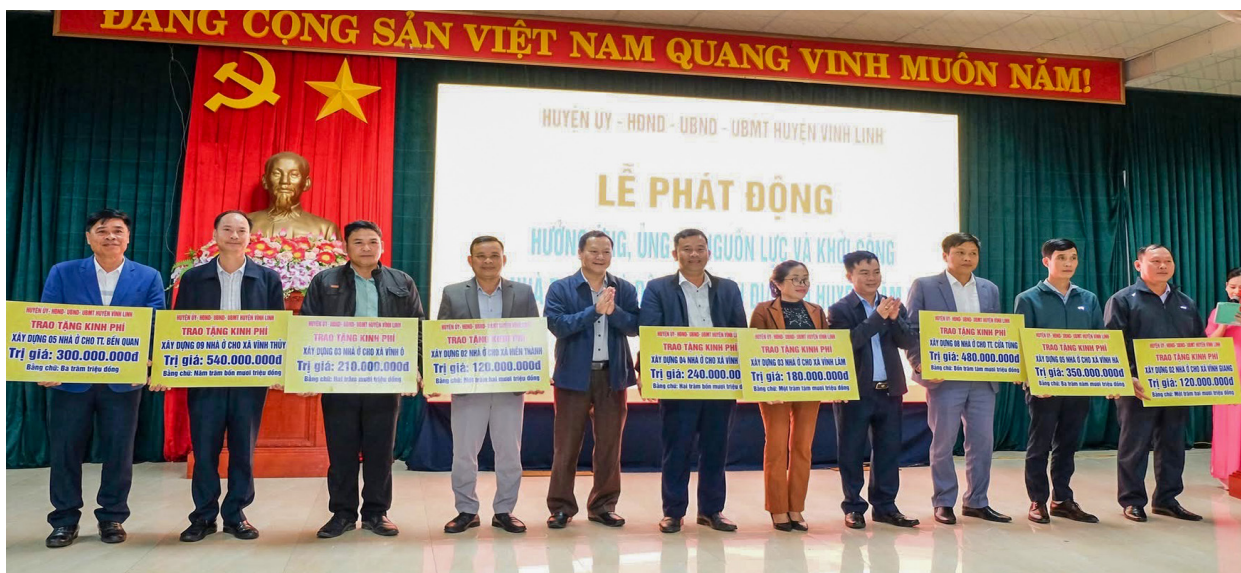
Huyện Vĩnh Linh tiếp nhận nguồn quỹ từ các đơn vị tài trợ chương trình xóa nhà tạm, nhà đột nát

Vĩnh Linh là địa phương có số lượng người có công lớn, có 3 xã miền núi, hằng năm thường xuyên chịu tác động từ thiên tai nên tình trạng nhà ở của người dân chưa được xây mới, nhà xuống cấp, đột nát còn cao. Thời gian qua, Vĩnh Linh đã tranh thủ sự hỗ trợ tích cực từ trung ương, tỉnh, nhiều doanh nghiệp, đơn vị và huy động sự vào cuộc của cả hệ thống chính trị để đẩy mạnh chương trình xóa nhà tạm, nhà đột nát trên địa bàn. Từ năm 2020 đến nay, đặc biệt triển khai Đề án 197 của UBND tỉnh - Ủy ban MTTQ Việt Nam tỉnh về “Huy động nguồn lực thực