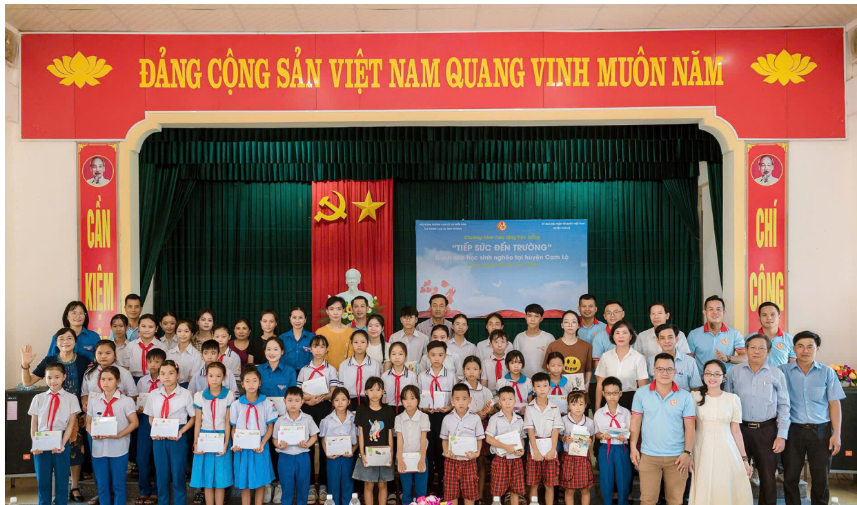
Hội Đồng hương Cam Lộ tại TP. Hồ Chí Minh trao học bổng Tiếp sức đến trường cho học sinh trên địa bàn huyện Cam Lộ.

Mặc dù phải sống xa quê, bươn chải với cuộc sống mưu sinh nhưng những người con của huyện Cam Lộ hiện đang sinh sống và làm việc ở thành phố Hồ Chí Minh cũng như các tỉnh phía Nam luôn nặng lòng hướng về với quê hương bằng nhiều việc làm ý nghĩa thiết thực góp phần giúp đỡ con em của quê hương mình.