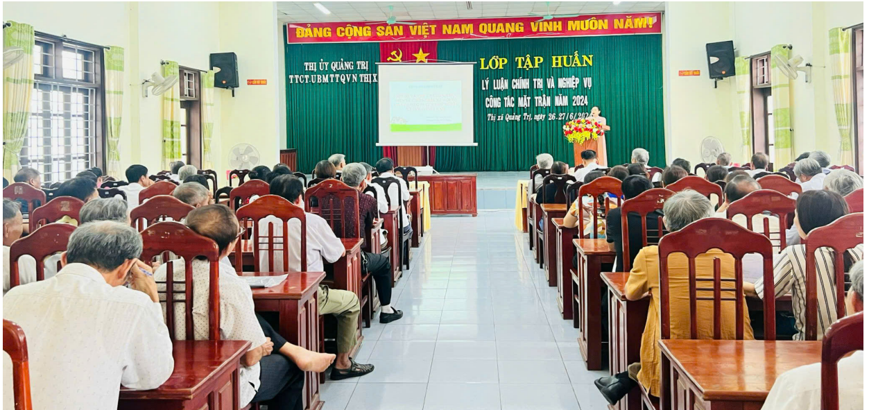
Ủy ban MTTQ Việt Nam thị xã Quảng Trị tổ chức tập huấn Công tác Mặt trận năm 2024.

Trong thời, Chủ tịch Hồ Chí Minh kính yêu đã khẳng định: “Cán bộ là cái gốc của mọi công việc”, “Công việc thành công hay thất bại đều do cán bộ tốt hay kém”. Thực tiễn cho thấy, những kết quả chung của toàn hệ thống MTTQ Việt Nam luôn có những đóng góp hết sức quan trọng của những người làm công tác Mặt trận, nhất là ở cơ sở - những hạt nhân tiêu biểu, những “thỏi nam châm” có sức hút đặc biệt trong việc tập hợp, xây dựng khối đại đoàn kết toàn dân tại các địa phương và địa bàn dân cư. Xác định vai trò, nhiệm vụ quan trọng của cán bộ làm công tác Mặt trận, các cấp ủy đảng, chính quyền, Mặt trận thị xã Quảng Trị luôn quan tâm, phối hợp, chú trọng nâng cao chất lượng đội ngũ cán bộ Mặt trận