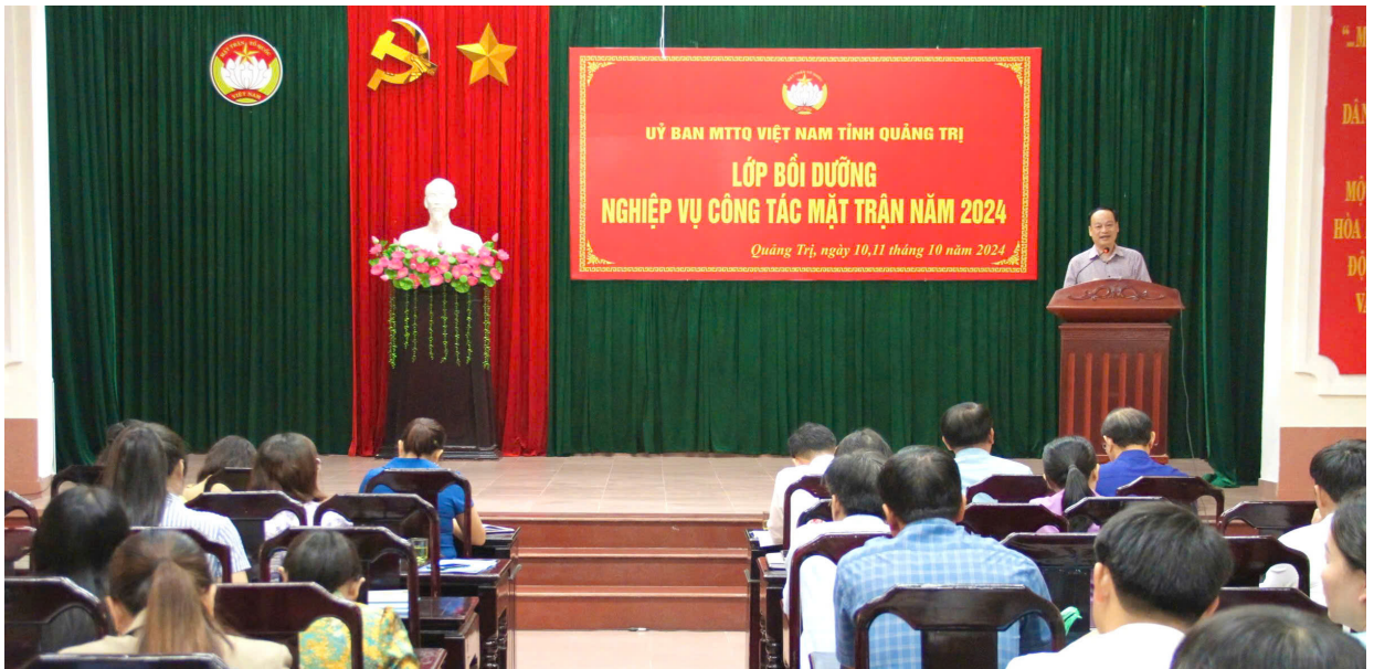
Lớp bồi dưỡng Nghiệp vụ Công tác mặt trận năm 2024.

Trong công tác đào tạo, bồi dưỡng cán bộ, Chủ tịch Hồ Chí Minh đã khẳng định: "Học để làm việc, làm người, làm cán bộ", bởi "cán bộ là gốc của mọi công việc", phải biết cách lựa chọn, sử dụng và không ngừng bồi dưỡng cán bộ để cái vốn quý đó ngày càng to lớn lên theo yêu cầu, nhiệm vụ của cách mạng.