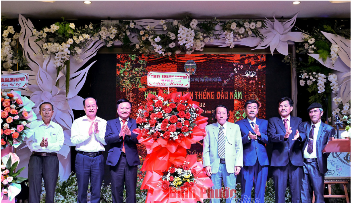
Lãnh đạo tỉnh Quảng Trị tặng hoa và chúc mừng Ban chấp hành Hội đồng hương Quảng Trị ở Bình Phước.