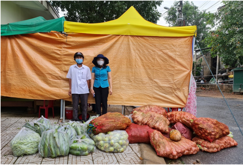
UBMTTQ Việt Nam thành phố Đông Hà tiếp nhận hỗ trợ rau củ quả của người dân.

Trong những ngày thành phố thực hiện Chỉ thị 16-CT/TTg ngày 31/3/2020 của Thủ tướng Chính phủ về thực hiện các biện pháp cấp bách phòng, chống dịch Covid-19, MTTQ Việt Nam thành phố các cấp đã phát huy truyền thống đại đoàn kết, huy động sức mạnh của toàn dân tộc, huy động mọi nguồn lực hỗ trợ Nhân dân vượt qua khó khăn do ảnh hưởng của dịch bệnh.