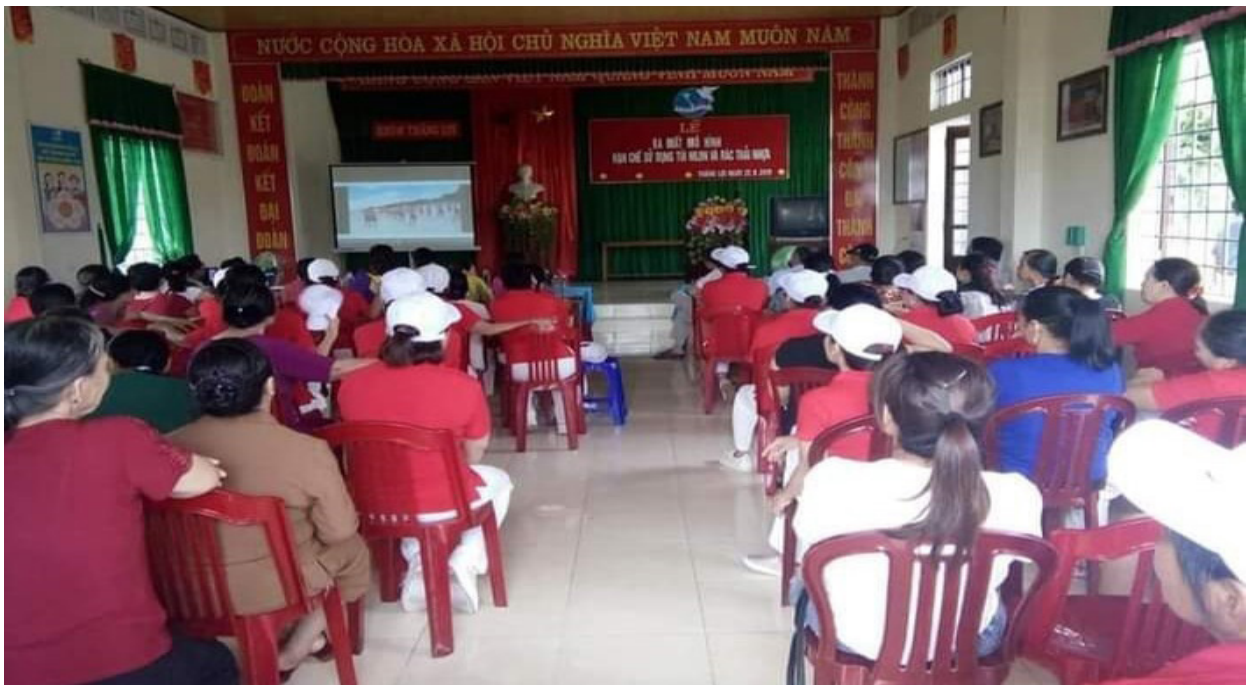
Lễ ra mắt mô hình hạn chế sử dụng túi ni lon và rác thải nhựa của Hội LHPN TT Hồ Xá

đói giảm nghèo, xóa nhà tạm bợ dột nát và phòng chống tội phạm ” khu dân cư Lao Động; mô hình “ Bảo vệ môi trường, ứng phó biến đổi khí hậu ” khu dân cư Thống Nhất; 17 Mô hình “ Phân xử lý rác thải tại hộ gia đình ”; 17 mô hình “ Con đường tự quản ”, “ Hạn chế sử dụng túi ni lon và rác thải nhựa ”, “ Phụ nữ với an toàn giao thông ” nòng cốt là phụ nữ, CCB, Đoàn TN. Trong đó, các thành viên chú trọng tuyên truyền, vận động các tầng lớp nhân dân tích cực