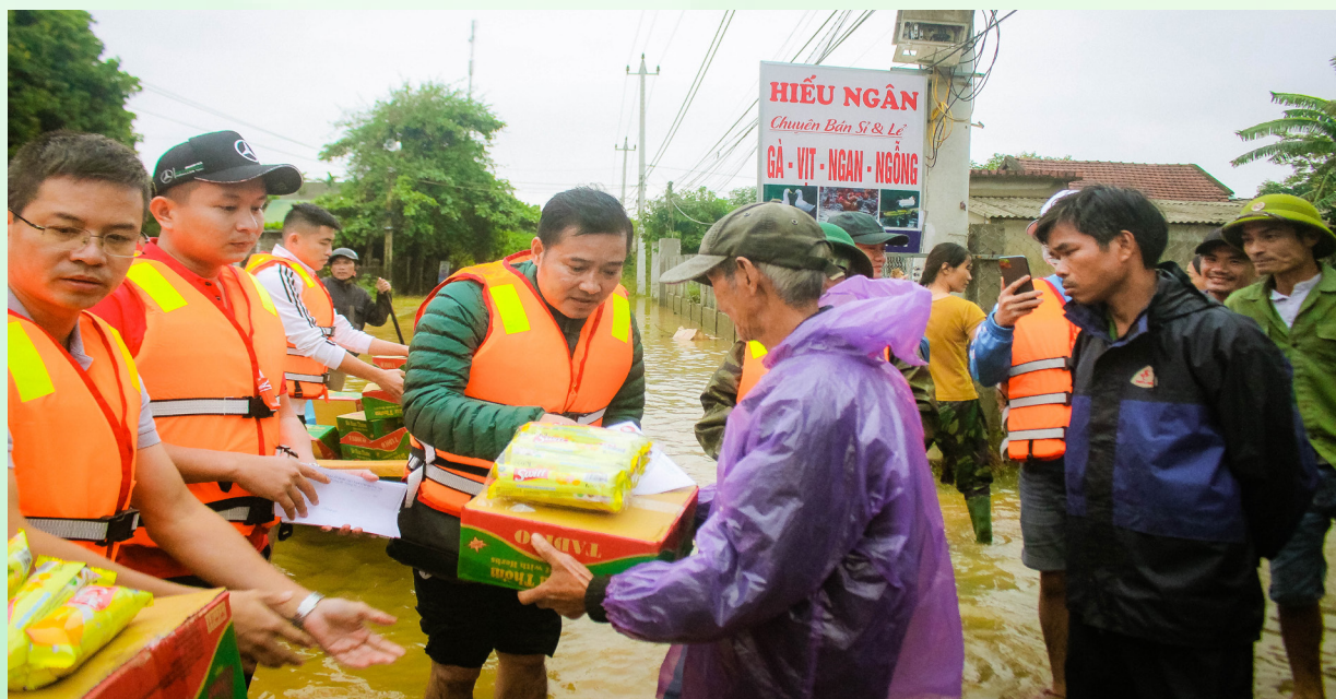
Thông qua Ủy ban MTTQ Việt Nam tỉnh đại diện Hoa chia sẻ đến trao quà tại xã Vĩnh Lâm, huyện Vĩnh Linh

Vấn đề minh bạch trong hoạt động từ thiện đang nhận được quan tâm rất lớn của xã hội, bởi ngày càng