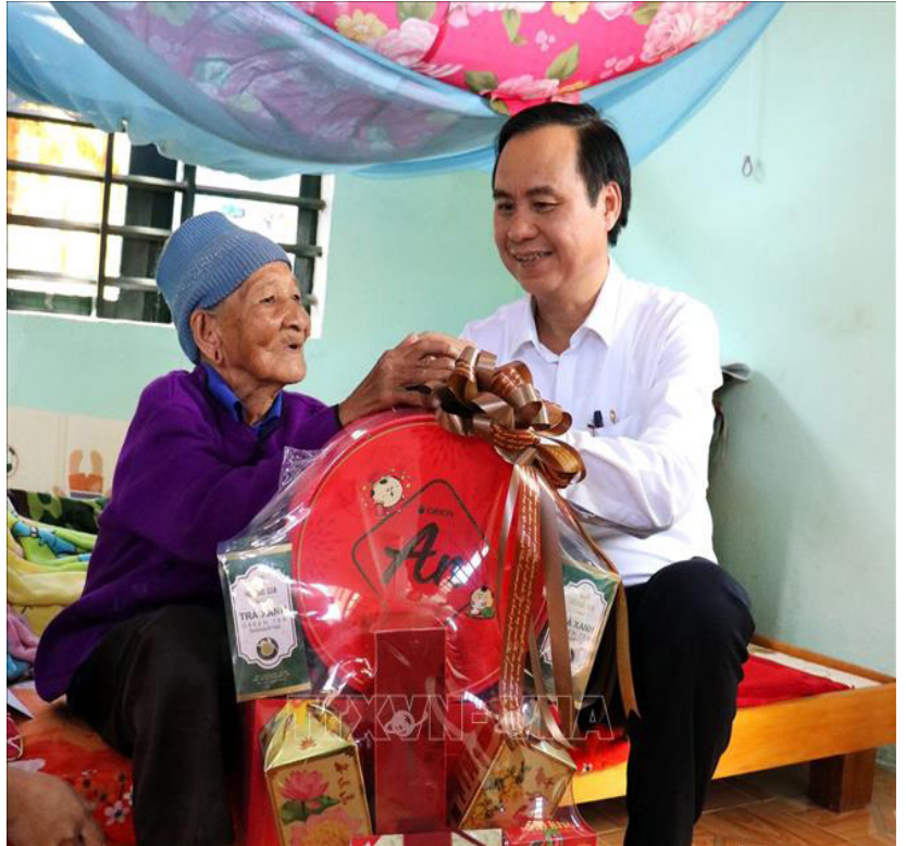
Đồng chí Võ Văn Hưng - Phó Bí thư Tỉnh ủy, Chủ tịch UBND tỉnh thăm và tặng quà Tết cho Mẹ Việt Nam anh hùng Căn Thung ở xã A Bung, huyện Đakrông.

Ủy ban Mặt trận Tổ quốc Việt Nam (UBMTTQVN) các cấp là cơ quan thường trực của Ban vận động Quỹ “Vì người nghèo” các cấp đứng ra vận động sự vào cuộc của toàn xã hội thực hiện phong trào này. Cùng với việc đẩy