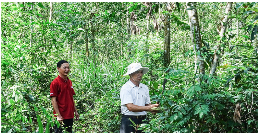
Trông rừng theo chứng chỉ FSC đem lại hiệu quả kinh tế cao tại HTX Phú Hưng, Hải Phú, Hải Lăng

13-NQ/TW; các chỉ thị, nghị quyết của Trung ương, của tỉnh về phát triển kinh tế tập thể, kinh tế hợp tác tới cán bộ, đảng viên, hội viên, đoàn viên, các hợp tác xã, xã viên và người lao động trong HTX. Qua đó góp phần nâng cao nhận thức và tầm quan trọng của việc tham gia phát triển kinh tế tập thể, xây dựng mô hình HTX kiểu mới.