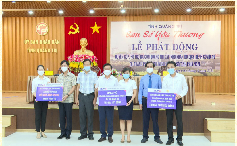
Lãnh đạo tỉnh tiếp nhận ủng hộ chương trình "San sẻ yêu thương" hỗ trợ bà con Quảng Trị do dịch bệnh tại thành phố Hồ Chí Minh và các tỉnh phía nam

Những đợt lũ lịch sử tháng 10 năm 2020 đã để lại hậu quả hết sức nghiêm trọng về tính mạng, tài sản của nhân dân và nhà nước trên địa bàn toàn tỉnh: 57 người chết và mất tích, 53 người bị thương; 110.842 lượt nhà dân bị ngập sâu dài ngày, trong đó có 3.365 nhà dân bị