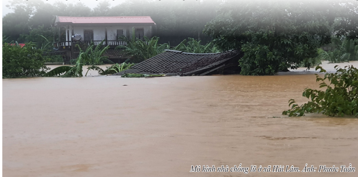
Mô hình nhà chống lũ ở xã Hải Lâm.

Đến nay, trên địa bàn huyện đã xây dựng được tổng số 121 nhà cao tầng, trong đó: 20 nhà cao tầng là trụ sở UBND các xã, thị trấn; 94 nhà cao tầng