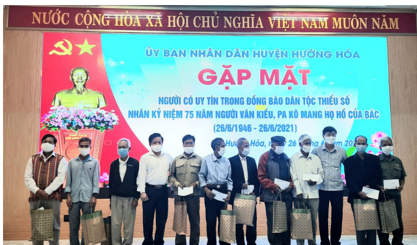
Hướng Hoá tổ chức gặp mặt người có uy tín trong đồng bào dân tộc thiểu số Vạn Kiều, Pa Kô.

Chủ tịch Ủy ban MTTQ Việt Nam huyện Hướng Hoá