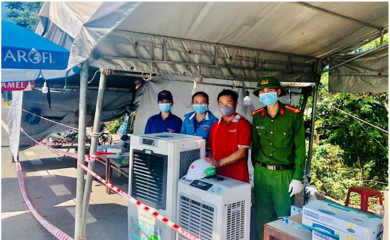
Hỗ trợ các thiết bị phục vụ lực lượng làm việc tại các chốt kiểm soát dịch giáp ranh với thành phố Đông Hà (trong thời gian thành phố giãn cách xã hội theo Chỉ thị 16)

thương đã làm mờ đi nét lóng ngóng, sự vụng về trong lúc đỡ dành em bé khóc đòi bố mẹ. Có những đêm trời mưa to, sấm sét vang dội, lán trực chốt không thể nào che chắn hết được cho cán bộ làm nhiệm vụ, vậy là cả khu phong tỏa hôm đó sáng đèn, không ai có thể ngủ được khi mà “người thân” của mình đang phải chịu mưa to, gió lớn. Càng thấm hiểu những khó khăn, trở ngại, những hi sinh, cống hiến của lực lượng trực chốt bao nhiêu, bà con khu phong tỏa càng cố gắng vượt qua thiếu thốn hằng ngày, bỏ lại niềm vui của sự tự do, quên đi chút mệt mỏi của cảm giác tù túng để cùng nhau chấp hành tốt quy định, chung tay đẩy lùi dịch bệnh một cách nhanh nhất, đồng lòng cùng chính quyền địa phương chiến thắng đại dịch. Chúng tôi nói với nhau rằng, nghỉ tích cực sẽ hành động tích cực và sống tích cực, phong tỏa tạm thời là dịp để bà