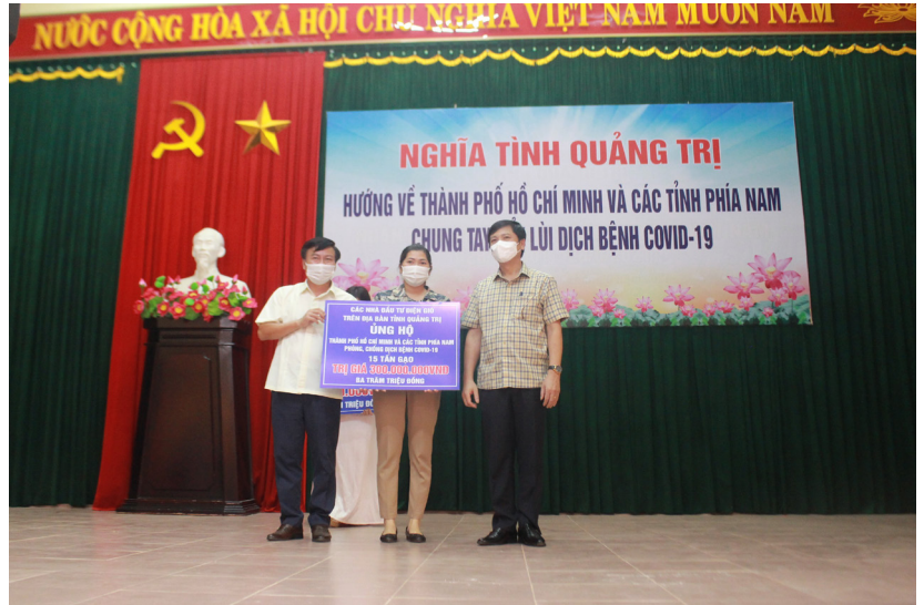
Lãnh đạo tỉnh tiếp nhận ủng hộ Chương trình Nghĩa tình Quảng Trị hướng về thành phố Hồ Chí Minh và các tỉnh phía Nam chung tay đẩy lùi dịch bệnh Covid-19

Mặt trận Tổ quốc các cấp trong tỉnh đã tăng cường tập hợp, phát huy sức mạnh khối đại đoàn kết toàn dân tộc; đa dạng hóa các hình thức tập hợp các tầng lớp nhân dân; đẩy mạnh các phong trào thi đua yêu nước, các cuộc vận động trong các cấp, các ngành và các tầng lớp nhân dân. Tập trung tuyên truyền, vận động các cơ quan, đơn vị, doanh nghiệp triển khai các giải pháp tháo gỡ khó khăn, thúc đẩy phát triển sản xuất kinh doanh; thực hiện