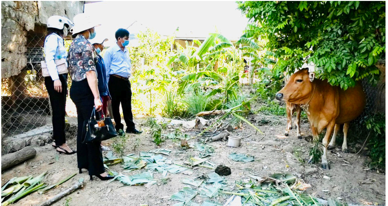
Hỗ trợ bò giống cho hộ nghèo tại phường An Đôn.

1 hết sức xúc động và phần khởi khi được Ủy ban Mặt trận thị xã hỗ trợ kinh phí 10 triệu đồng để mua con giống, phát triển kinh tế gia đình. Bà Tuyền chia sẻ thêm: “Trước đây, gia đình tôi đã được Ủy ban Mặt trận thị xã hỗ trợ kinh phí để xây dựng nhà Đại đoàn kết. Đến nay, được hỗ trợ thêm kinh phí để mua con giống, nên tôi rất xúc động trước sự