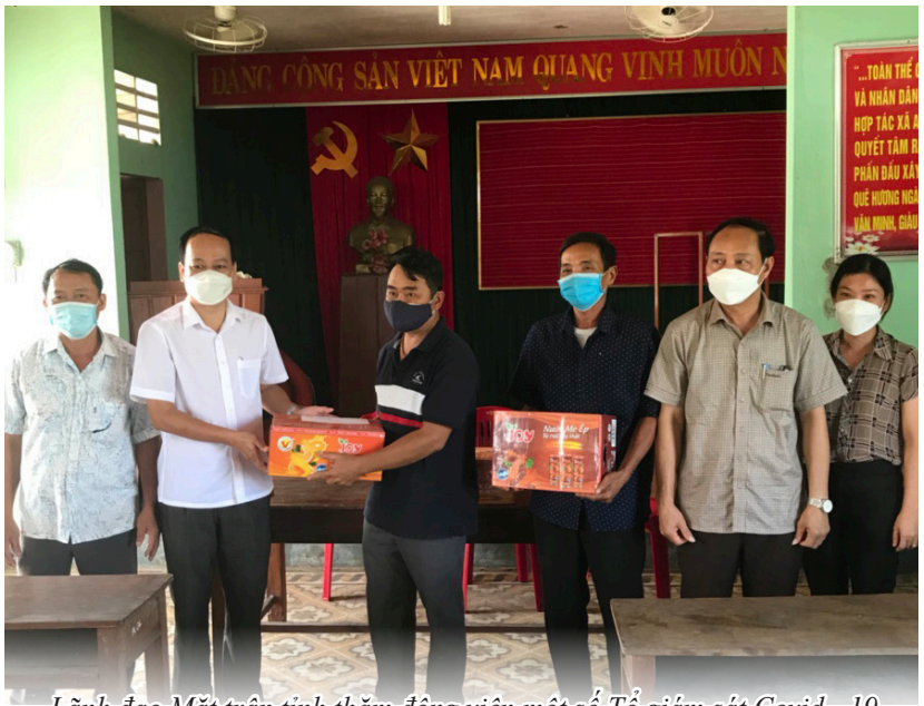
Lãnh đạo Mặt trận tỉnh thăm động viên một số Tổ giám sát Covid - 19 cộng đồng tại huyện Triệu Phong.

Ngoài ra các thành viên còn tình nguyện, tích cực giúp cho Ban chỉ đạo, UBND xã thống kê lập danh từng đối tượng phục vụ công tác tổng hợp danh