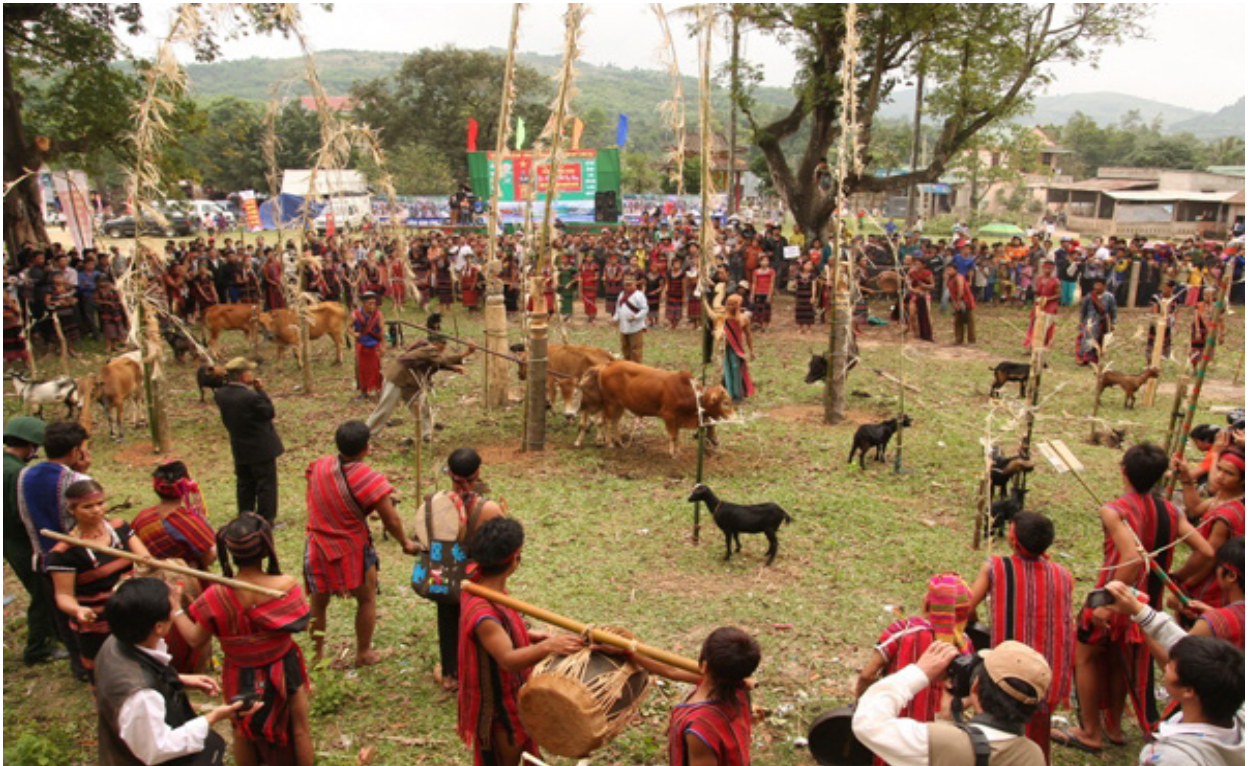
Lễ hội A Riêu Ping ở xã Tà Rụt

Huyện Đakrông có tỷ lệ đồng bào dân tộc thiểu số chiếm trên 80%, chủ yếu dân tộc Vân Kiều, Pa Cô... Mỗi dân tộc nơi đây đều có những nét văn hóa truyền thống, phong tục tập quán rất riêng, tạo nên bản sắc độc đáo. Vì vậy việc bảo tồn phát huy các giá trị văn hóa đồng bào dân tộc thiểu số trên địa bàn huyện là nhiệm vụ quan trọng, góp phần làm phong phú thêm nền văn hóa cộng đồng. Đồng thời tạo động lực để phát triển đời sống kinh tế, xã hội, ổn định chính trị, an ninh quốc phòng tại địa phương.