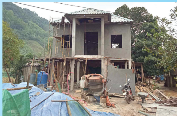
Từ nguồn vốn hỗ trợ từ Đề án 197 cùng với sự hỗ trợ của gia đình, người thân anh Hồ Văn Xoã, xã Mò Ô, huyện Đakrông xây dựng căn nhà khang trang -Ảnh: N.P

5. Triển khai Đề án 197 về “Huy động nguồn lực thực hiện chính sách hỗ trợ xây mới nhà ở cho hộ nghèo trên địa bàn tỉnh Quảng Trị, giai đoạn 2022-2026”. Từ khi phát động đến nay, đã vận động, phối hợp hỗ trợ, đối ứng xây dựng mới 1.398 nhà với tổng trị giá 82,70 tỷ đồng. Phấn đấu thực hiện đạt mục tiêu xây mới 3.672 nhà ở cho hộ nghèo; đến cuối năm 2025 toàn tỉnh cơ bản không còn hộ gia đình nghèo ở nhà tạm bợ.