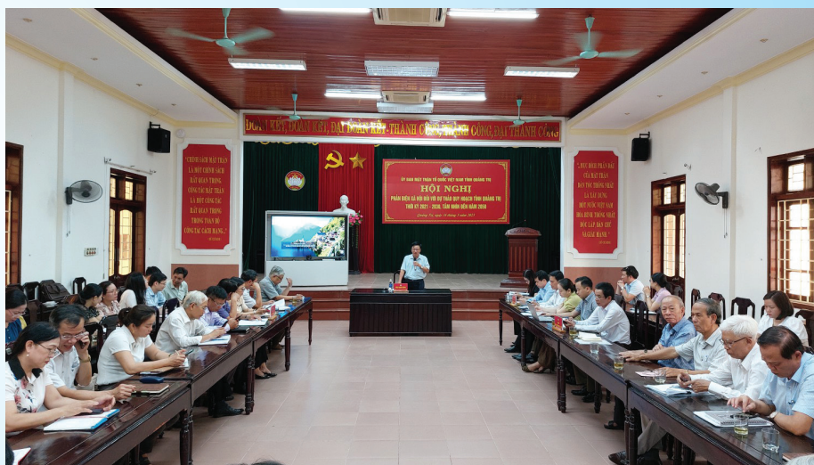
Ban Thường trực Ủy ban MTTQ Việt Nam tỉnh tổ chức Hội nghị phân biện dự thảo Quy hoạch tỉnh Quảng Trị thời kỳ 2021-2030, tầm nhìn đến năm 2050

4. Phát huy dân chủ, tham gia xây dựng Đảng, xây dựng chính quyền; giám sát và phản biện xã hội gắn với thực hiện 2 đề án “Tăng cường thực hành dân chủ ở khu dân cư” và đề án “Nâng cao chất lượng công tác nắm bắt thông tin, tình hình dư luận xã hội trong Nhân dân của Mặt trận cơ sở”. Công tác giám sát, phản biện xã hội của MTTQ các cấp và các tổ chức chính trị-xã hội đã thể hiện rõ nét hơn chức năng đại diện, bảo vệ quyền và lợi ích hợp pháp, chính đáng của đoàn viên, hội viên và Nhân dân.