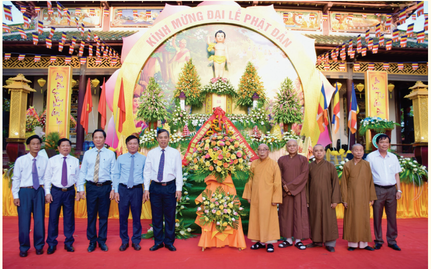
Các đồng chí lãnh đạo tỉnh tặng hoa chúc mừng Giáo hội Phật giáo Việt Nam tỉnh Quảng Trị nhân Đại lễ Phật đản Phật lịch 2567-Dương lịch 2023

Những năm qua, với sự quan tâm lãnh đạo, hướng dẫn của cấp ủy, chính quyền và MTTQ Việt Nam các cấp nên các hoạt động tôn giáo trên địa bàn cơ bản ổn định, nhu cầu sinh hoạt tín ngưỡng tôn giáo của Nhân dân được đáp ứng; chức sắc, chức việc, tín đồ các tôn giáo luôn phấn khởi, tin tưởng vào sự lãnh đạo của các cấp ủy, chính quyền, cùng chung sức với các tầng lớp nhân dân hưởng ứng, tham gia thực hiện các chương trình mục tiêu quốc gia giảm nghèo bền vững và xây dựng nông thôn mới như phong trào: “Quảng Trị chung sức xây dựng nông thôn mới”, kết hợp với