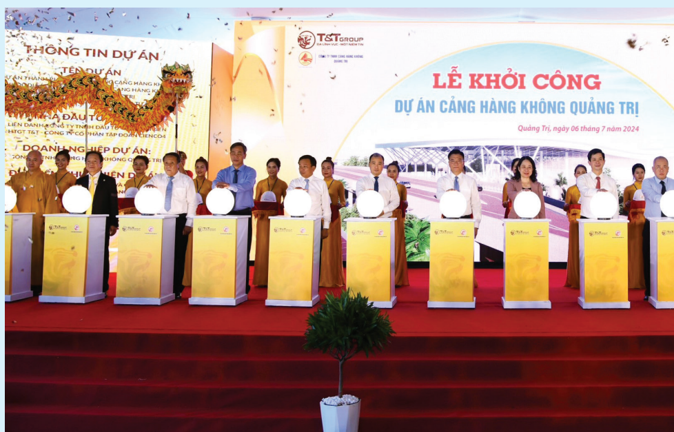
Khởi công Cảng hàng không Quảng Trị

7,71%, hộ cận nghèo chiếm 5,45%. Hoạt động “Đền ơn, đáp nghĩa”, phụng dưỡng Bà mẹ Việt Nam anh hùng, chăm sóc người có công thiết thực, ý nghĩa và hiệu quả. Đến nay, toàn tỉnh có 99,1% hộ gia đình người có công có mức sống bằng hoặc cao hơn mức sống của người dân địa phương nơi cư trú. Công tác dân tộc, tôn giáo, đại đoàn kết toàn dân được thực hiện tốt, tạo sự đồng thuận xã hội. QP-AN được giữ vững, chính trị