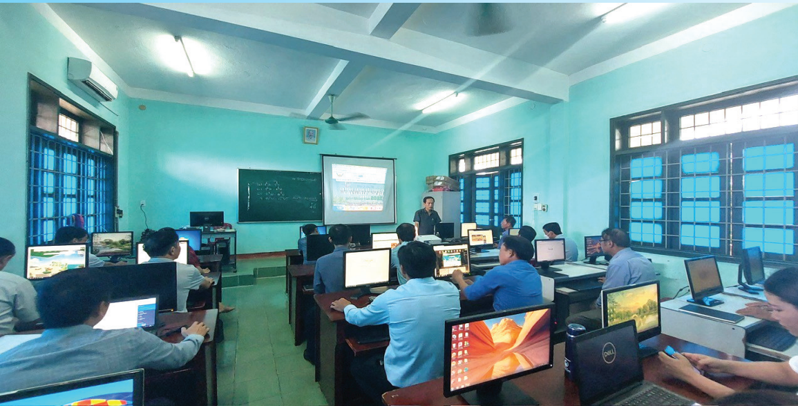
Ủy ban MTTQ Việt Nam huyện Hải Lăng triển khai ứng dụng công nghệ thông tin trong công tác mặt trận

1. Đổi mới công tác tuyên truyền, vận động, tập hợp các tầng lớp nhân dân, gắn với việc thực hiện chuyển đổi số trong toàn hệ thống mặt trận từ tỉnh đến cơ sở. Phương thức tuyên truyền, vận động của MTTQ Việt Nam và các tổ chức thành viên tiếp tục đổi mới thích ứng với sự phát triển nhanh của công nghệ số, đáp ứng nhu cầu nắm bắt thông tin kịp thời, cụ thể của xã hội; vận dụng tối đa các phương tiện truyền thông đại chúng và mạng xã hội cho công tác truyền thông. Nội dung tuyên truyền tập trung theo hướng có chủ đề, gắn với các đợt sinh hoạt chính trị, diễn đàn Nhân dân, cụ thể hóa các trọng tâm vận động của trung ương và Tỉnh ủy