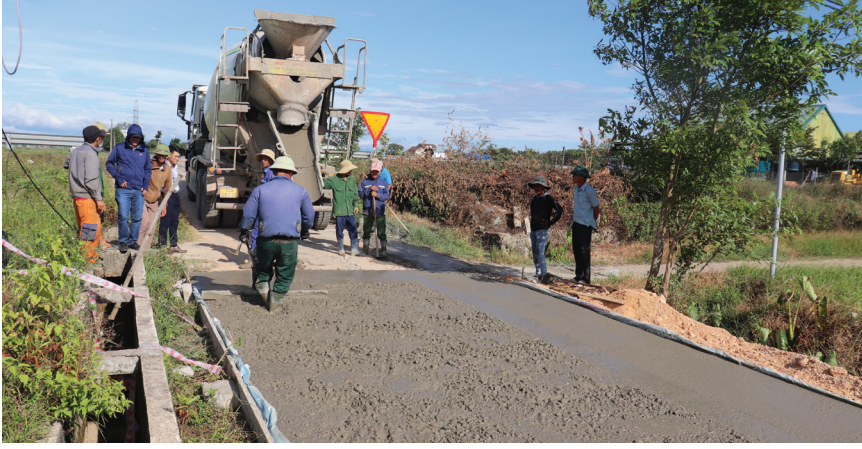
Người dân KDC Vinh Quang Thượng thi công công trình “Tuyến đường kiểu mẫu” trị giá gần 1 tỉ đồng do Ủy ban MTTQ Việt Nam tỉnh hỗ trợ.