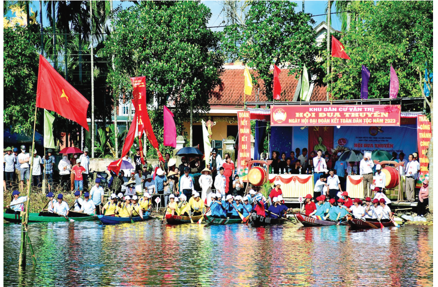
Vào dịp Ngày hội Đại đoàn kết hằng năm (18/11) khu dân cư Văn Trí, xã Hải Phong, huyện Hải Lăng đều tổ chức Hội đua thuyền truyền thống

Ban Thường vụ Tỉnh ủy Quảng Trị đã chỉ đạo Ủy ban MTTQ Việt Nam tỉnh chủ trì phối hợp với các cấp ủy, chính quyền, các tổ chức trong hệ thống chính trị các cấp trong tỉnh về tận khu dân cư tham gia các hoạt động cùng với Nhân dân, qua đó củng cố khối đại đoàn kết toàn dân tộc, khơi dậy tình làng nghĩa xóm, động viên Nhân dân phát huy tinh đoàn kết, tích cực tham gia các cuộc vận động, phong trào thi đua yêu nước tại địa phương. Những kết quả ngày hội mang lại được đánh giá rất tích cực. Với tinh thần “Đoàn kết, hợp lực, tự quản” các