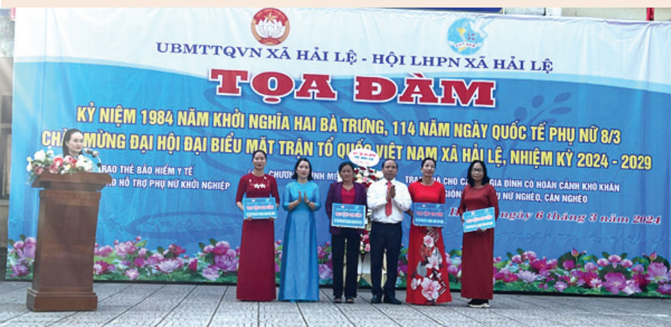
MTTQ Việt Nam và Hội LHPN xã Hải Lê trao mô hình sinh kế cho phụ nữ phát triển sản xuất