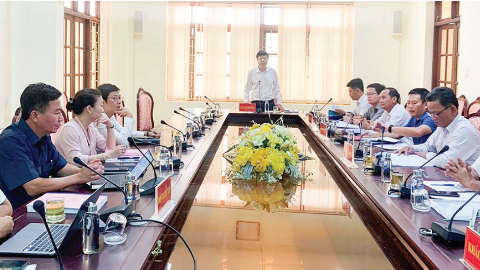
Hội đồng tư vấn nghiệm thu đề tài công nghệ thông tin của Ủy ban MTTQ Việt Nam tỉnh