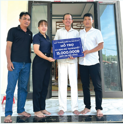
MTTQ Việt Nam thị trấn Hồ Xá, huyện Vĩnh Linh trao kinh phí hỗ trợ xây dựng nhà Đại đoàn kết