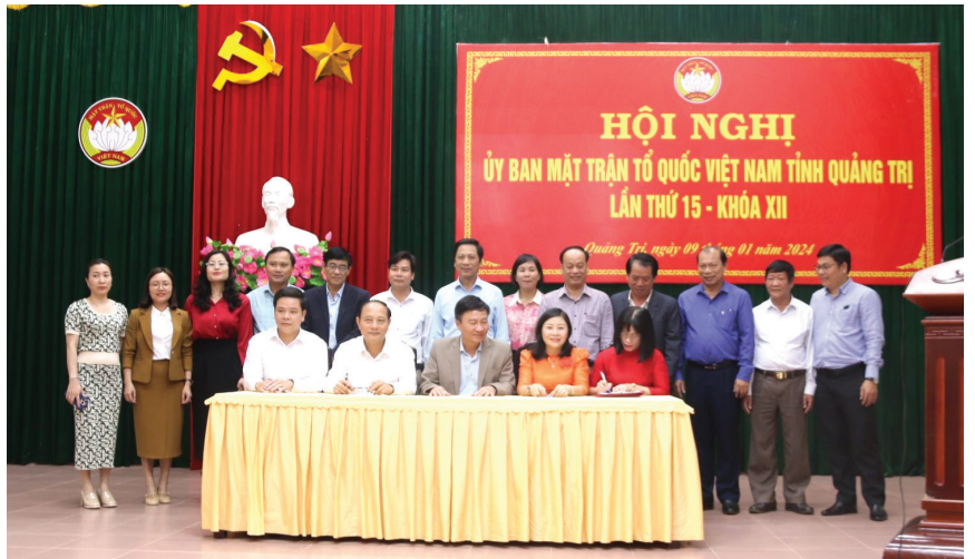
Ủy ban MTTQ Việt Nam tỉnh Quảng Trị ký kết giao ước thi đua năm 2024

Mặt trận Tổ quốc Việt Nam kể từ ngày ra đời đến nay đã có bề dày lịch sử 94 năm thực hiện sứ mệnh đại đoàn kết toàn dân tộc dưới sự lãnh đạo của Đảng. Đại đoàn kết toàn dân tộc cũng là truyền thống quý báu, là nguồn sức mạnh to lớn của cách mạng nước ta, là một trong những tư tưởng lớn của Chủ tịch Hồ Chí Minh. Đảng ta, Chủ tịch Hồ Chí Minh luôn khẳng định đại đoàn kết là gốc, là động lực tạo nên sức mạnh cực kỳ to lớn, đảm bảo mọi thành công của cách mạng. “Đoàn kết, đoàn kết, đại đoàn kết; thành công, thành công, đại thành công”.