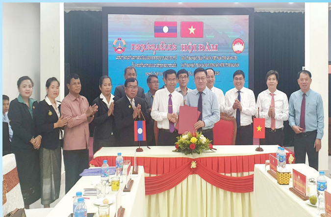
Ký kết biên bản ghi nhớ hợp tác giai đoạn 2024-2026 giữa Ủy ban MTTQ Việt Nam tỉnh và Ủy ban Mặt trận Lào xây dựng đất nước tỉnh Salavan

3. Công tác đối ngoại nhân dân được mở rộng; nội dung, phương thức hoạt động ngày càng được đổi mới. MTTQ Việt Nam tỉnh phối hợp chặt chẽ với các sở, ban, ngành liên quan và các tổ chức chính trị-xã hội tăng cường hoạt động đối ngoại nhân dân với nhiều nội dung hoạt động phong phú, đa dạng. Tiếp tục duy trì mối quan hệ hữu nghị, hợp tác giữa Ủy ban MTTQ Việt Nam tỉnh với Ủy ban Mặt trận Lào xây dựng đất nước tỉnh Salavan, Savannakhet, Champasak (Lào).