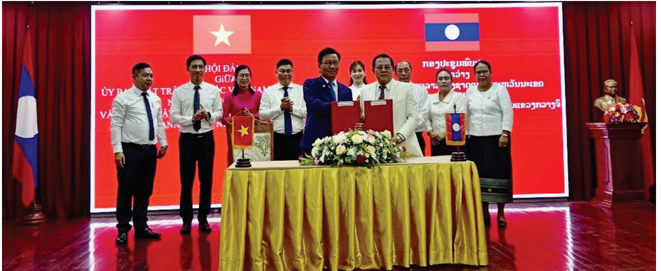
Ủy ban MTTQ Việt Nam tỉnh Quảng Trị và Ủy ban Mặt trận Lào xây dựng đất nước tỉnh Savannakhet ký kết Biên bản ghi nhớ giai đoạn 2024-2026