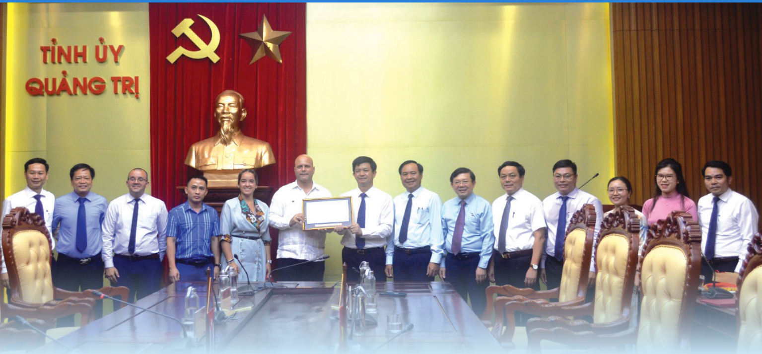
Đoàn đại biểu cấp cao Ủy ban bảo vệ cách mạng Cuba do Ủy viên Trung ương Đảng Cộng sản Cuba, Ủy viên Hội đồng Nhà nước, Chủ tịch Ủy ban bảo vệ cách mạng Cuba Gerardo Hernandez Nordelo thăm và làm việc tại Quảng Trị

Ổn định, trật tự an toàn xã hội được đảm bảo. Hoạt động đối ngoại Đảng, ngoại giao Nhà nước và đối ngoại nhân dân được thực hiện đồng bộ, có hiệu quả, tạo sự tin cậy với các đối tác nước ngoài.