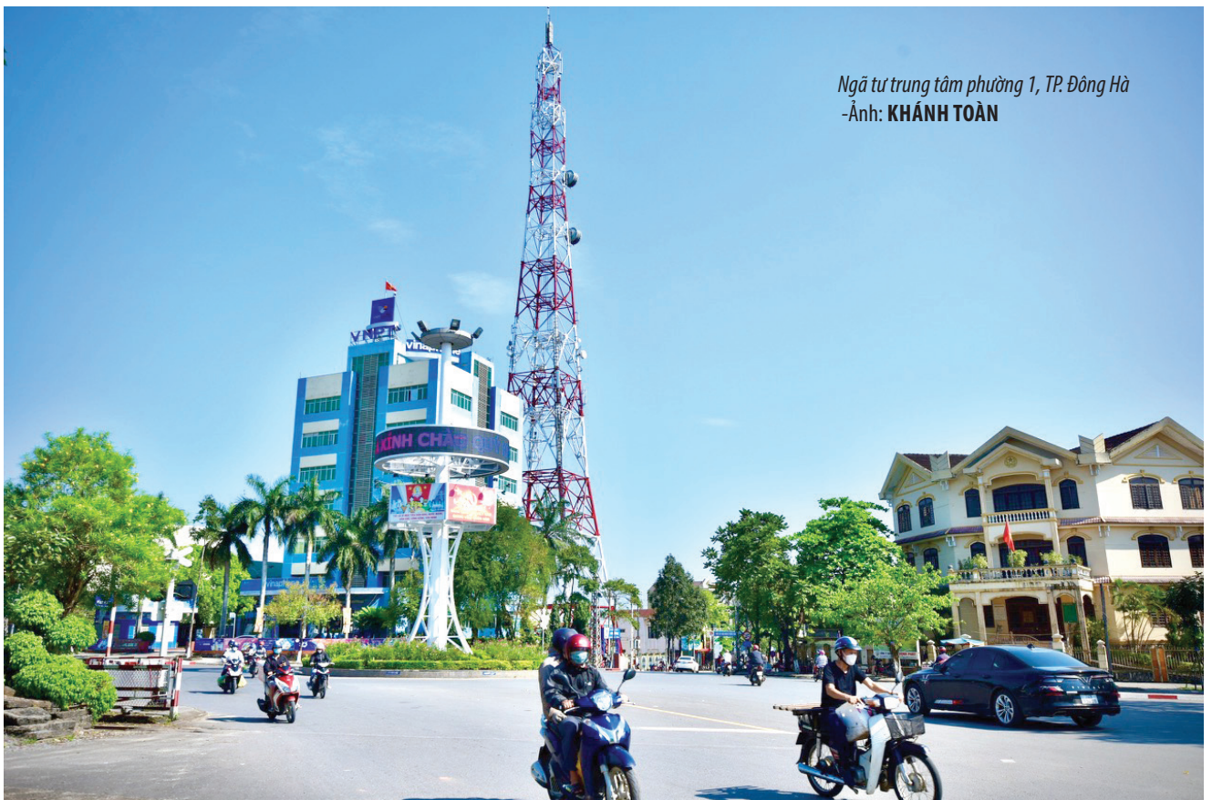
Ngã tư trung tâm phường 1, TP. Đông Hà -Ảnh: KHÁNH TOÀN

Có thể thấy, mô hình Tổ tự quản toàn diện trên địa bàn Phường 1, TP. Đông Hà đã bước đầu phát huy tác dụng và mang lại hiệu quả thiết thực, ý nghĩa. Thông qua hoạt động của tổ, các chương trình, kế hoạch hành động đã được cụ thể hóa, thiết thực hơn, góp phần nâng cao đời sống của các tầng lớp nhân dân, giữ vững ổn định chính trị, trật tự an toàn xã hội; bảo đảm cho các hoạt động ở cơ sở diễn ra bình thường, khơi dậy ý chí, khát vọng phấn đấu vươn lên của mỗi người dân.