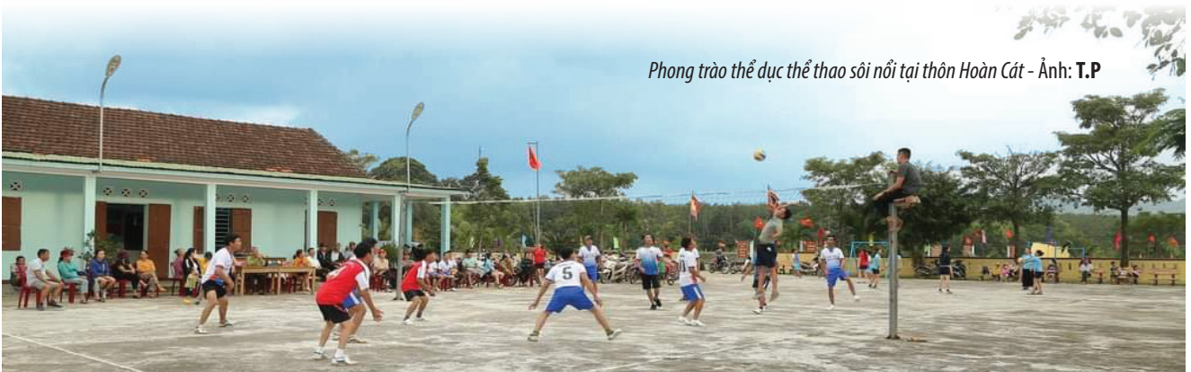
Phong trào thể dục thể thao sôi nổi tại thôn Hoàn Cát

Với những gì các địa phương đã và đang làm được hy vọng mô hình ý nghĩa này sẽ được triển khai và nhân rộng trong thời gian tới.