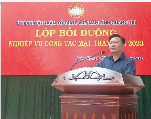
Ông Đào Mạnh Hùng, UVBTV Tỉnh ủy, Chủ tịch Ủy ban MTTQ Việt Nam tỉnh phát biểu khai mạc lớp bồi dưỡng nghiệp vụ công tác mặt trận năm 2023