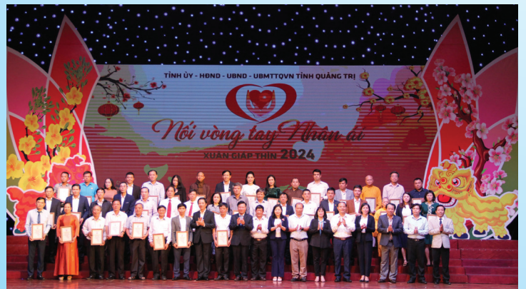
Lãnh đạo tỉnh tiếp nhận ủng hộ và trao biển ghi nhận tấm lòng vàng cho các tổ chức, cá nhân đóng góp ủng hộ chương trình Nói vòng tay nhân ái Xuân Giáp Thìn 2024

2. Vận động Nhân dân thi đua lao động sáng tạo; tiếp tục bám sát địa bàn dân cư, huy động tốt các nguồn lực xã hội cho công tác cứu trợ, hỗ trợ an sinh, ổn định xã hội, giảm nghèo, thực hiện thắng lợi nhiệm vụ phòng chống dịch bệnh và phục hồi nhanh nền kinh tế của tỉnh sau COVID-19.