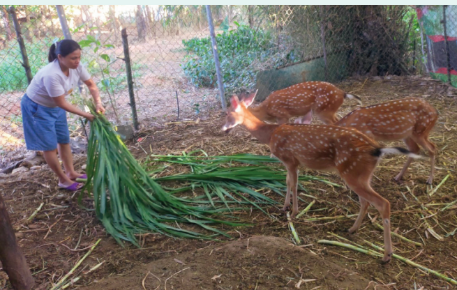
Mô hình nuôi hươu giúp người dân ở xã Triệu Nguyên tăng thêm thu nhập, ổn định đời sống - Ảnh: K.S

Bên cạnh những thuận lợi, quá trình chăn nuôi đang phát triển tốt thì đến năm 2020 địa bàn xã gặp phải trận lũ quá lớn, quá dài ngày làm thiệt hại kinh tế rất lớn trong đó thiệt hại đàn vật nuôi khá nhiều, riêng đàn hươu bị chết 26 con. “Khắc phục khó khăn gặp phải trong thời gian đầu nuôi hươu, các hộ dân tiếp tục duy trì mô hình. Việc chăn nuôi hươu dễ hơn rất nhiều so với các loại khác và cho thu nhập khá cao, bình quân mỗi con hươu từ năm thứ 3 trở đi cho thu nhập từ 6-10 triệu/năm, nếu giống tốt và chăn nuôi tốt thì có con lên đến 20 triệu/năm. Hiện tại các hộ gia đình đã bắt đầu phát triển đàn bằng cách nuôi thêm hươu cái để nhân đàn. Mô hình đã góp phần giúp người nghèo có điều kiện vươn lên thoát nghèo bền vững; đa dạng hóa các mô hình xóa đói giảm nghèo ở xã miền núi”, Chủ tịch Ủy ban MTTQVN xã Triệu Nguyên Nguyễn Ngọc Hiệp khẳng định.