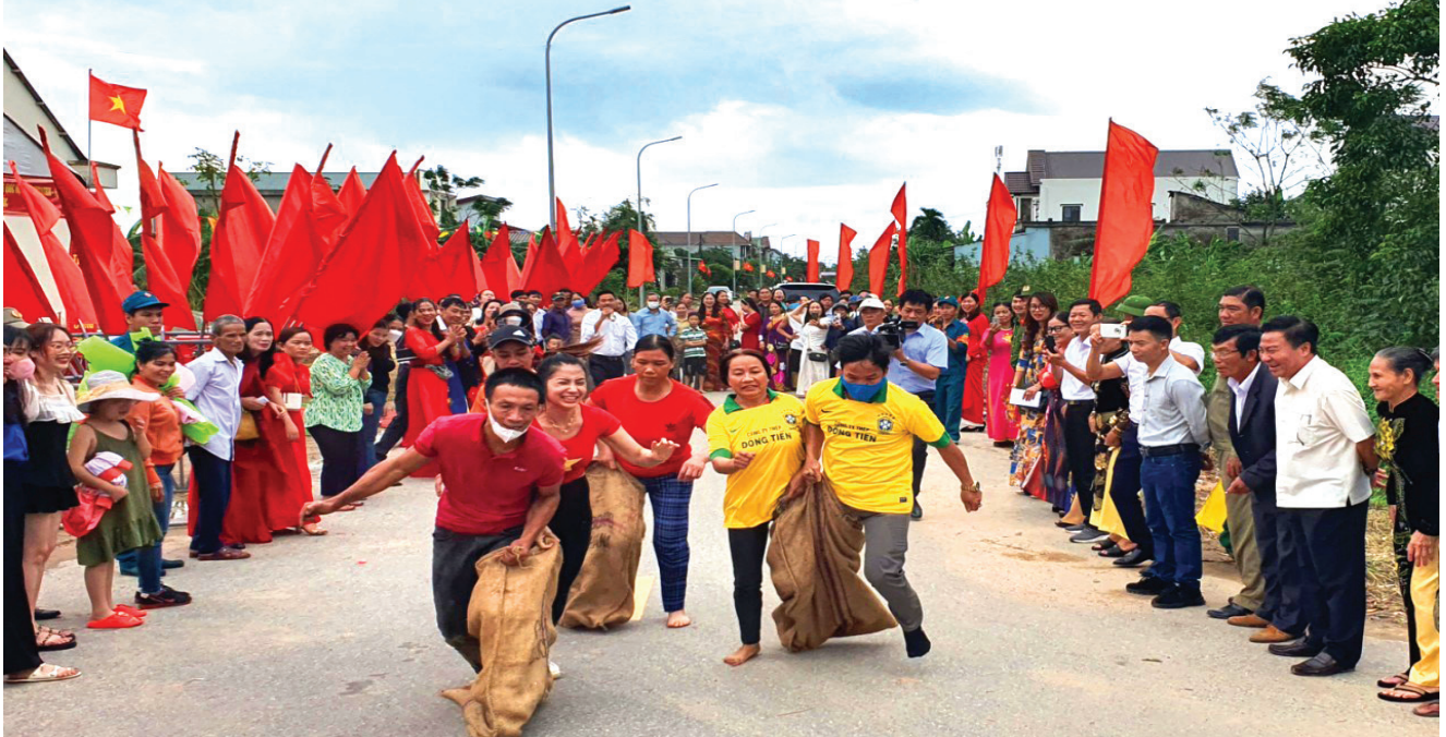
Ngày hội Đại đoàn kết khu dân cư ở Khu phố Lương An, phường Đông Lễ, TP. Đông Hà