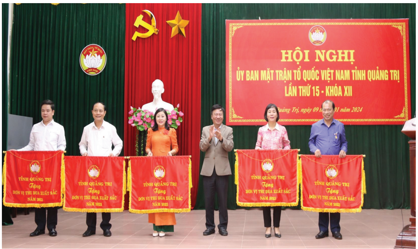
Trao Cờ thi đua xuất sắc của Ủy ban MTTQ Việt Nam tỉnh Quảng Trị cho các tập thể