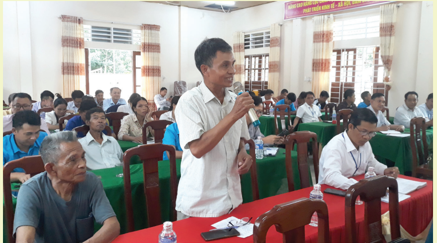
Ủy ban MTTQ Việt Nam tỉnh phối hợp với Đoàn ĐBQH tỉnh tổ chức hội nghị tiếp xúc cử tri để cử tri xã Húc Nghi, huyện Đakrông phản ánh, kiến nghị đến tỉnh và Quốc hội nhiều vấn đề về phát triển KT-XH của địa phương

Cùng với đó, công tác phản biện xã hội của Ủy ban MTTQ Việt Nam và các tổ chức chính trị - xã hội trong tỉnh ngày càng cụ thể, đồng bộ, thực chất; nội dung phản biện xã hội được thực hiện đảm bảo quy trình quy định, thiết thực, phù hợp.