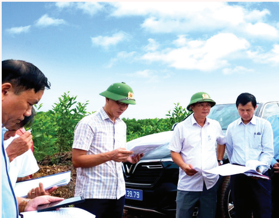
Ban Kinh tế - Ngân sách, HĐND tỉnh khảo sát thực địa để thẩm tra nội dung chuyển mục đích sử dụng rừng thực hiện dự án Khai thác mở sết đồi khu vực Hô Lây, xã Hải Chánh, huyện Hải Lăng.

họp chuyên đề, ban hành 424 nghị quyết, tập trung vào việc quyết định kế hoạch đầu tư công trung hạn, dự toán ngân sách trung hạn và hằng năm; quyết định phê duyệt về quy hoạch, điều chỉnh, bổ sung quy hoạch; chấp thuận chủ trương thu hồi đất, chuyển đổi mục đích sử dụng đất, sử dụng rừng để thực hiện các dự án; quyết định cơ chế, chính sách địa phương hỗ trợ phát triển sản xuất, thu hút đầu tư; hỗ trợ