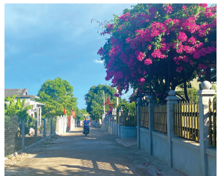
Đường 5 thôn Tùng Luật

“Trước đây, trục đường 5-một trong những trục đường trung tâm của thôn cũng chỉ rộng khoảng 4m. Từ dự án mở rộng đường 5 nên Mặt trận thôn đã phối hợp chặt chẽ với chi bộ, ban điều hành, các đoàn thể trong thôn vận động 47 hộ dân cùng hiến đất với tổng diện tích gần 1.000m 2 . Tất cả các hộ dân trên trục đường 5 đều tự động phá bỏ hàng rào xây kiên cố, trụ tiêu, cây ăn quả để dành quỹ đất mở rộng đường. Sau khi mở rộng đường xong, ban điều hành thôn đã hỗ trợ khoảng 250-260 triệu đồng để 47 hộ dân bị ảnh hưởng do mở rộng đường xây dựng, sửa chữa lại hệ thống tường rào, cổng ra vào nhà. Việc mở rộng đường 5 cũng nhận được sự ủng hộ, đồng lòng của 357 hộ dân trong toàn thôn. Bây giờ, người dân rất vui mừng, phấn khởi trước diện mạo mới, sự thuận lợi của trục đường 5”, Trưởng Ban Công tác Mặt trận thôn Tùng Luật Dương Thị Loan cho hay.