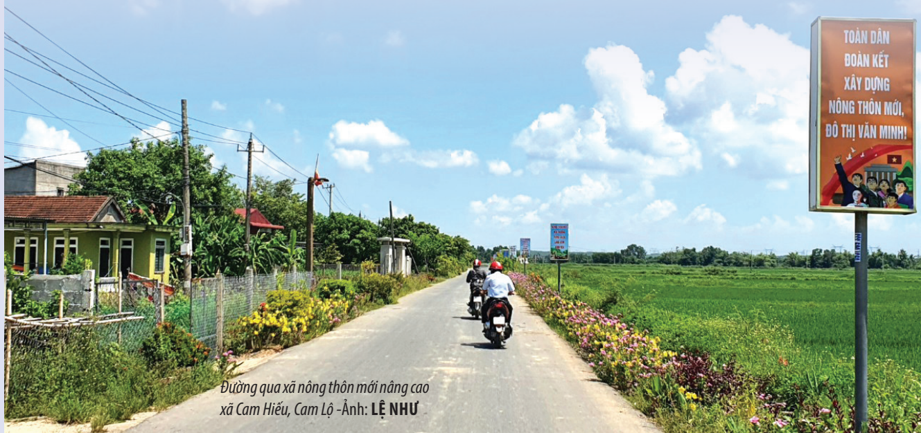
Đường qua xã nông thôn mới nâng cao xã Cam Hiếu, Cam Lộ - Ảnh: LÊ NHƯ

Trên cơ sở những kết quả đạt được, trong thời gian tới, MTTQ các cấp trong tỉnh phát huy vai trò nòng cốt chính trị ở cơ sở, phát huy vai trò, quyền, trách nhiệm của MTTQ Việt Nam trong hoạt động tham gia góp ý xây dựng Đảng, xây dựng chính quyền. Đồng thời, nâng cao chất lượng giám sát, phản biện xã hội, góp ý xây dựng Đảng, Nhà nước trong sạch, vững mạnh. Trọng tâm là những chủ trương, chính sách lớn, trọng yếu, những vấn đề liên quan trực tiếp đến Nhân dân, những vấn đề xã hội quan tâm, bức xúc. Giám sát việc tu dưỡng, rèn luyện đạo đức, lối sống của người đứng đầu, cán bộ chủ chốt và cán bộ, đảng viên.