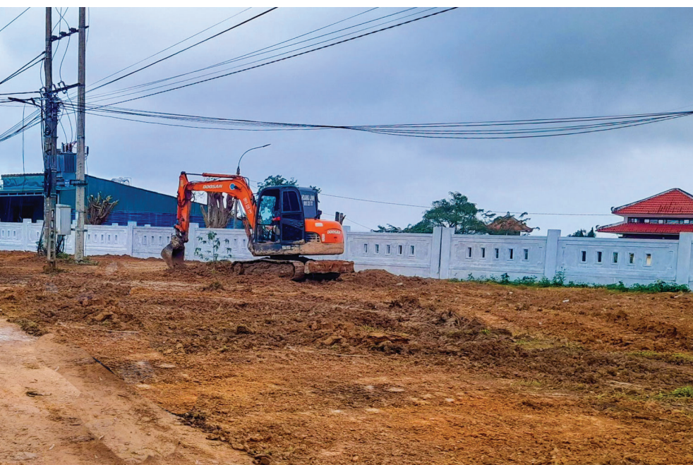
Dự án san nền mặt bằng Khu tái định cư Tân Trúc, xã Cam Hiếu được Ban GSDTCCĐ giám sát, đảm bảo chất lượng, tiến độ thi công