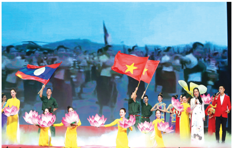
Chương trình nghệ thuật kỷ niệm 60 năm quan hệ hữu nghị hợp tác Việt Nam - Lào

Việc triển khai đồng bộ, sáng tạo, hiệu quả các hoạt động đối ngoại đã góp phần đưa các mối quan hệ đối ngoại của tỉnh Quảng Trị đi vào chiều