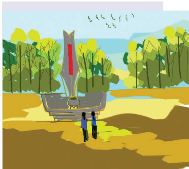
- Minh họa: NGỌC DUY

Gio Linh mùa này đượm nồng nắng lửa. Những nén hương lòng vẫn mãi ngạt ngào trong khúc hát tri ân.