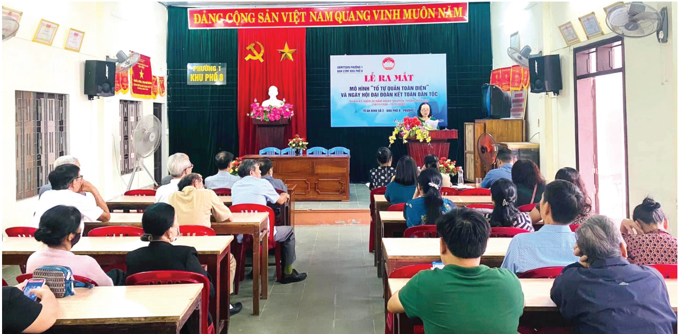
Lễ ra mắt mô hình Tổ tự quản toàn diện tại Tổ an ninh số 2, Khu phố 8, phường 1, TP. Đông Hà.