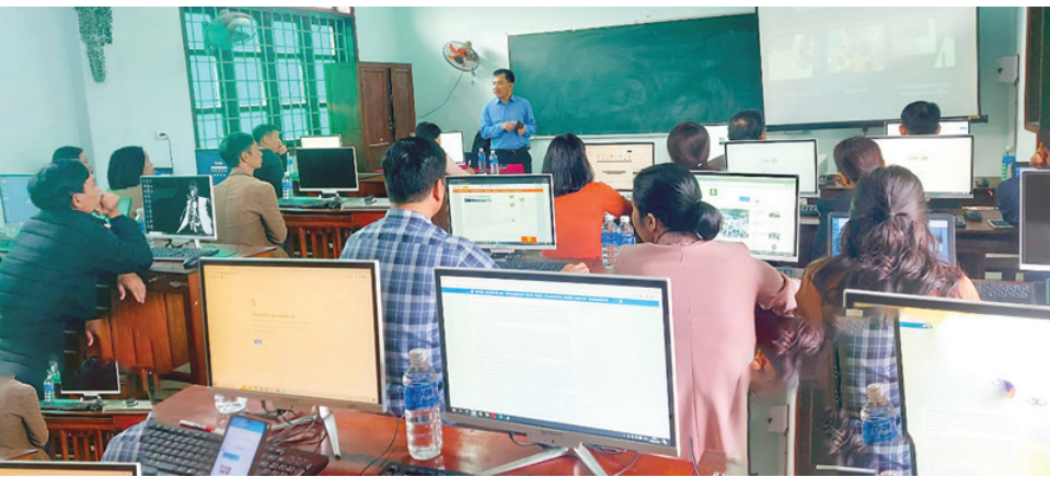
Ủy ban MTTQ Việt Nam tỉnh triển khai các hệ thống công nghệ thông tin cho khối mặt trận và các tổ chức chính trị-xã hội trên địa bàn thị xã Quảng Trị

Bốn là , xác định rõ nhóm ngành chủ lực, đối tượng phục vụ của chuyển đổi số. Bảo vệ quyền lợi hợp pháp, chính đáng của các tầng lớp nhân dân. Phát huy truyền thống đoàn kết, gia tăng sự đồng thuận trong Nhân dân thông qua thực hành dân chủ. Ứng dụng thế mạnh số vào tuyên truyền, vận động Nhân dân thực hiện chủ trương, chính sách của Đảng và pháp luật của Nhà nước. Hoạt động an sinh xã hội phục vụ người dân khu vực chịu ảnh hưởng thiên tai, dịch bệnh, người nghèo, các hoàn cảnh khó khăn. Hoạt động cứu trợ kêu gọi, vận động các nguồn cứu trợ hỗ trợ Nhân dân khắc phục hậu quả thiên tai, dịch bệnh. Giám sát, phản biện chính sách, pháp luật; giám sát hoạt động của các tổ chức nhà nước, cán bộ, đảng viên.