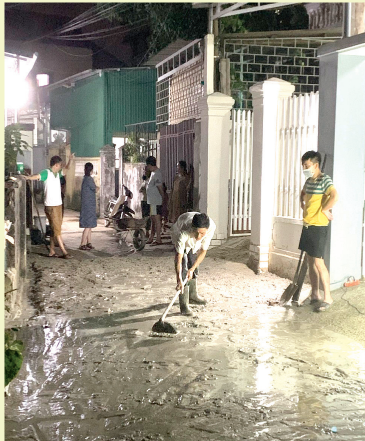
Người dân tích cực giám sát xây dựng đường giao thông

Bên cạnh việc triển khai đầy đủ, đảm bảo nội dung, yêu cầu của Ban Thường vụ Tỉnh uỷ, Ủy ban MTTQ Việt Nam, tổ chức chính trị-xã hội cấp tỉnh còn chủ động tham mưu, đề xuất, chủ trì phối hợp tổ chức giám sát, kiểm tra, phản biện góp ý những lĩnh vực, vấn đề mới nảy sinh, mang tính trọng tâm, trọng điểm, nổi cộm được dư luận và