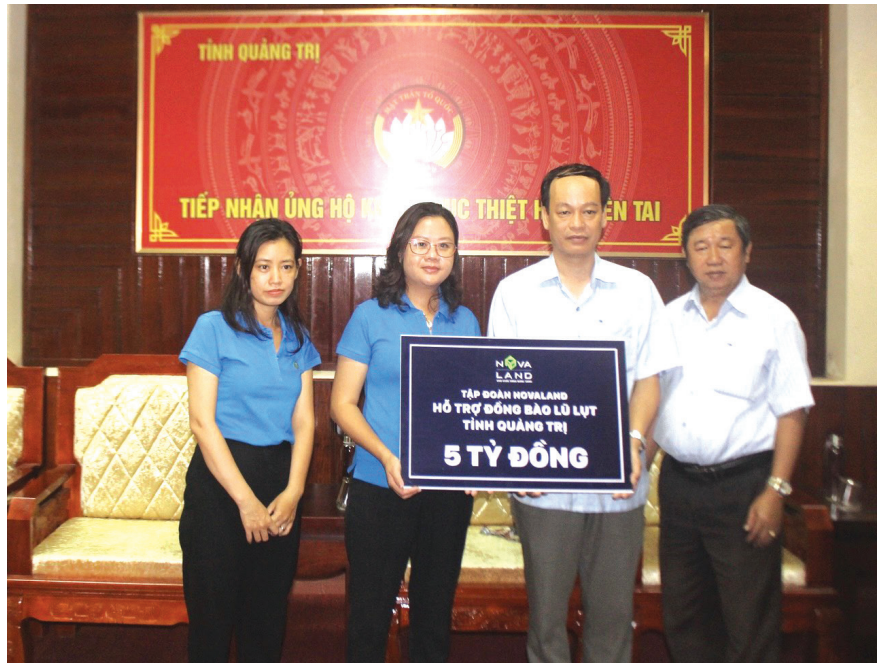
Tập đoàn NovaLand hỗ trợ Quảng Trị khắc phục hậu quả lũ lụt năm 2020 thông qua Ủy ban MTTQ Việt Nam tỉnh

Từ kết quả các cuộc vận động xã hội, đã hỗ trợ cho hơn 18.590 hộ dân là người Quảng Trị đang lưu trú, làm việc, học tập gặp khó khăn do COVID-19 tại TP. Hồ Chí Minh và các tỉnh lân cận với số tiền hơn 16,5 tỉ đồng. Toàn tỉnh đã vận động và chuyển đi 2.020 tấn hàng hóa, nhu yếu phẩm các loại trị giá ước tính trên 25