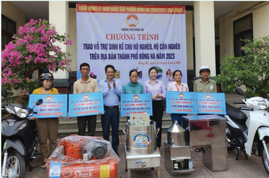
Ủy ban MTTQ Việt Nam TP.Đông Hà trao hỗ trợ sinh kế cho hộ nghèo, cận nghèo ở địa phương

Phát huy vai trò của Mặt trận trong công tác giảm nghèo, thời gian qua, Mặt trận các cấp trên địa bàn tỉnh Quảng Trị tích cực phối hợp, triển khai xây dựng mô hình hỗ trợ sinh kế cho người nghèo, người có hoàn cảnh khó khăn. Nhờ vậy, nhiều hộ nghèo, cận nghèo có việc làm, có thu nhập, từng bước vươn lên thoát nghèo và làm giàu chính đáng.