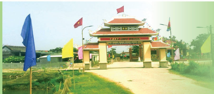
Khu dân cư làng Duy Phiên, thôn Bắc Phước xã Triệu Phước, huyện Triệu Phong ngày càng khang trang