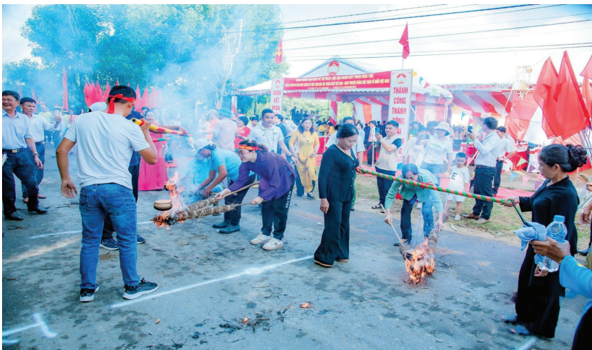
Ngày hội Đại đoàn kết toàn dân tộc ở Khu phố Tân Vinh, phường Đông Lương, TP. Đông Hà

Sau mỗi ngày hội, tinh thần đại đoàn kết dân tộc thêm một lần được củng cố và lan tỏa, trở thành nền tảng tinh thần, động lực nội sinh giúp khơi dậy niềm tin của Nhân dân đối với sự nghiệp xây dựng quê hương và phát triển đất nước. Với sự quan tâm lãnh đạo, chỉ đạo của các cấp ủy đảng, sự phối hợp tạo điều kiện của chính quyền các cấp, sự hưởng ứng tham gia tích cực của các tổ chức thành viên và các tầng lớp nhân dân trong tỉnh, hy vọng rằng, Ngày hội Đại đoàn kết toàn dân tộc ở khu dân cư trên địa bàn tỉnh đáp ứng được yêu cầu xây dựng khối đại đoàn kết toàn dân tộc trong tình hình mới. Những kết quả và kinh nghiệm quý báu có được trong quá trình vận động, tập hợp Nhân dân tham gia ngày hội là tiền đề, cơ sở thực tiễn để tiếp tục duy trì, củng cố, đổi mới và ngày càng mở rộng sự kết nối cộng đồng, góp phần củng cố, xây dựng khối đại đoàn kết toàn dân tộc ngày càng bền vững.