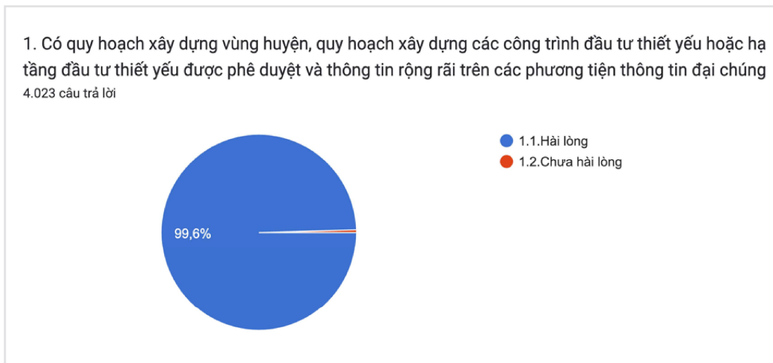
Ảnh 2. Hệ thống tự tổng hợp số liệu

kinh tế xã hội như: Phương pháp phân tổ thống kê, phương pháp thống kê mô tả, phương pháp so sánh. Hệ thống đã nghiên cứu sử dụng thang đo theo Hướng dẫn 90 để đánh giá sự hài lòng của người dân về xây dựng NTM.