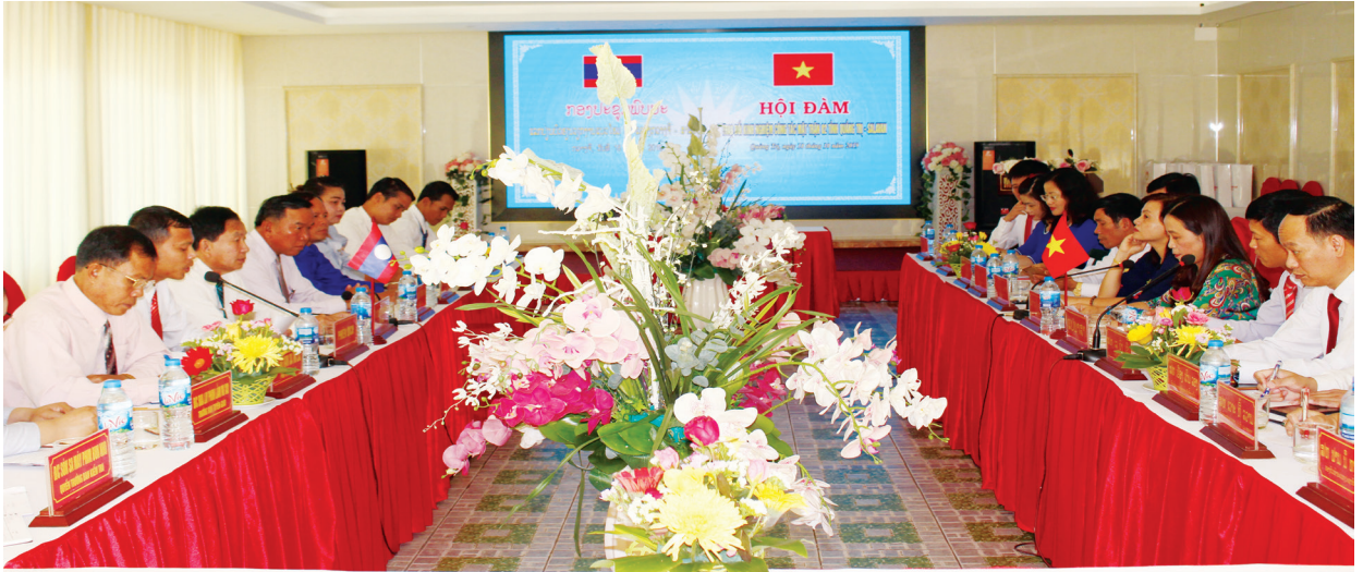
Hội đàm trao đổi kinh nghiệm công tác giữa UBMTTQVN tỉnh Quảng Trị và Mặt trận Lào xây dựng đất nước tỉnh Salavan

02 của Đoàn Chủ tịch Ủy ban Trung ương MTTQ Việt Nam khóa VIII về đổi mới nội dung, phương thức hoạt động của MTTQ Việt Nam trong công tác dân tộc, công tác tôn giáo.