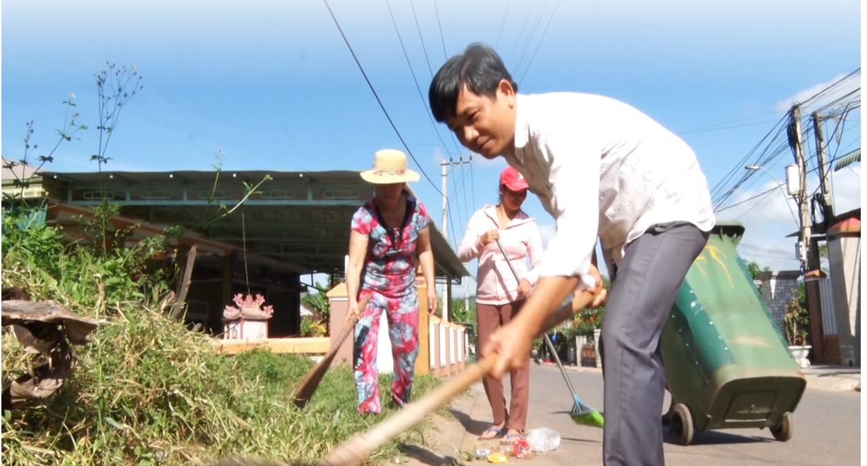
Người dân tham gia bảo vệ môi trường

xuyên vận động tuyên truyền bà con vệ sinh đường làng, ngõ xóm, nhà sinh hoạt cộng đồng, trồng cây xanh để giữ môi trường luôn “Xanh - sạch - đẹp”. Đồng thời vào Ngày Môi trường thế giới hàng năm luôn treo panô, khẩu hiệu để tuyên truyền, vận động bà con hưởng ứng thực hiện. Chi hội Phụ nữ xung phong xây dựng mô hình “Hạn chế sử dụng túi ni lông và chất thải nhựa” và đã được các chị em hưởng ứng nhiệt tình. Mặc dù thời gian thực hiện không dài, nhưng được sự hướng dẫn Ủy ban MTTQ Việt Nam các cấp, sự phối hợp chặt chẽ đầy trách nhiệm, có hiệu