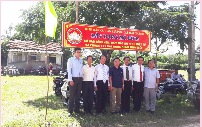
Ra mắt Ban điều hành mô hình “Xứ đạo bình yên, đảm bảo an ninh trật tự và chung tay xây dựng NTM”

cộng đồng dân cư; giao trách nhiệm cụ thể cho các thành viên Ban công tác Mặt trận, Ban điều hành mô hình phụ trách các xóm, đến từng hộ gia đình theo phương châm “mua dầm thấm lâu”. Ông đã chọn các tiêu chí từ dễ đến khó để tập trung tuyên truyền vận động với nhiều hình thức như: pano, áp phích, trên hệ thống truyền thanh, vận động từng hộ gia đình... Đặc biệt ông đã vận