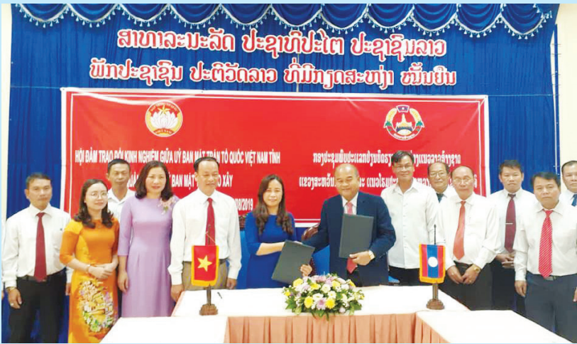
Hội đàm trao đổi kinh nghiệm công tác giữa UBMT Lào XĐĐN tỉnh Savannakhet và UBMTTQVN tỉnh Quảng Trị tại Savannakhet năm 2019