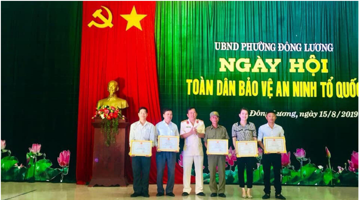
Tuyên dương những cá nhân có thành tích xuất sắc trong công tác Bảo vệ an ninh Tổ quốc

Với vai trò, trách nhiệm của mình, Ủy ban MTTQ Thành phố phối hợp với các ngành chức năng xây dựng chương trình, kế hoạch triển khai sâu rộng trong hệ thống MTTQ và các tổ chức thành viên từ thành phố đến cơ sở; ban hành các văn bản đến Mặt trận cơ sở và các ban, ngành, đoàn thể trong việc phối hợp triển khai công tác QPTD nhằm xây dựng môi trường chính trị - xã hội thành phố ổn định, ngày càng văn minh, quốc phòng - an ninh được giữ vững, an toàn, tạo điều kiện thuận lợi thúc đẩy kinh tế phát triển thịnh vượng, xứng tầm là