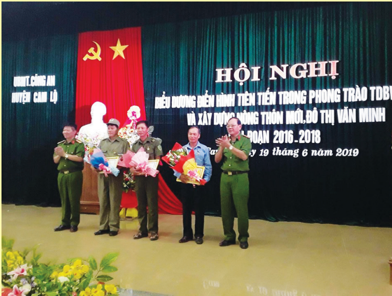
Hội nghị biểu dương điển hình tiên tiến trong phong trào TĐBVANTQ và xây dựng NTM, đô thị văn minh

công việc, địa chỉ cụ thể và Có kết quả cụ thể). Trong đó, xác định trọng tâm Công tác Mặt trận các cấp từ huyện đến cơ sở là tập trung thực hiện có hiệu quả các vấn đề cần giải quyết và bức xúc đang đặt ra như: Chương trình xóa nhà ở tạm bợ, dột nát cho hộ nghèo; Hỗ trợ cho hộ nghèo phát triển kinh tế, giảm nghèo bền vững; Xây dựng cảnh quan, môi trường nông thôn, đô thị sáng - xanh - sạch - đẹp, thực sự trở thành những miền quê đáng sống. Đồng thời, lấy sự hài lòng của người dân làm mục tiêu trong xây dựng nông thôn mới, đô thị văn minh.