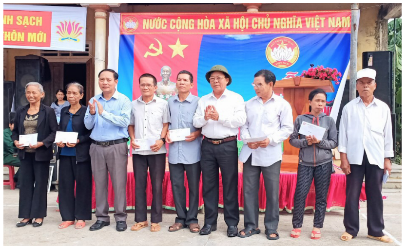
Tặng quà cho các gia đình có hoàn cảnh khó khăn tại Triệu Tài, Triệu Phong

Với mong muốn chung tay giúp đỡ, hỗ trợ cho các đối tượng thuộc diện hộ nghèo, cận nghèo, có hoàn cảnh đặc biệt khó khăn, trong những năm qua, các cấp Đảng, chính quyền tại địa phương luôn thực hiện tốt các chính sách an sinh xã hội, dành sự quan tâm đặc biệt để giúp đỡ và hỗ trợ