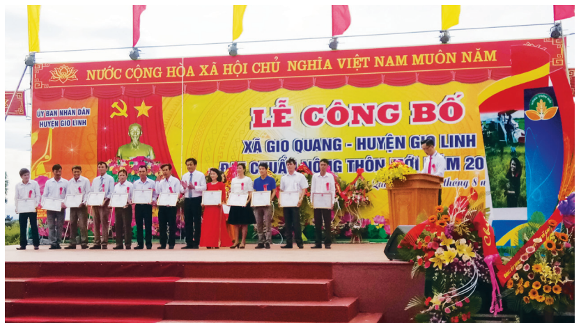
Lễ công bố xã Gio Quang - huyện Gio Linh đạt chuẩn NTM năm 2019

Thực hiện quy chế dân chủ ở cơ sở thực sự phát huy hiệu quả; các chủ trương của Đảng, chính sách, pháp luật của Nhà nước được chuyển tải kịp thời đến với người dân; các chương trình, dự án, các khoản đóng góp của nhân dân được công khai minh bạch, xét hỗ trợ đúng người, đúng đối tượng; cùng với đó nhân dân đã tích cực tham gia hưởng ứng và chủ động thực hiện các phong trào thi đua, các cuộc vận động do trung ương, địa phương phát động; vận động nhân dân hăng hái thi đua trong lao động sản xuất, phát triển kinh tế, chỉnh trang nhà ở, công trình vệ sinh, bảo vệ môi