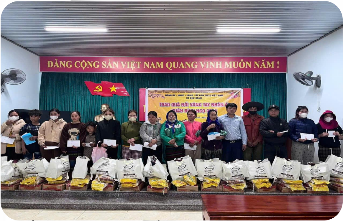
Tổ chức chương trình trao quà tết cho người nghèo Xuân Bình Ngọ 2026

T rong dòng chảy của các phong trào thi đua yêu nước và hoạt động an sinh xã hội năm 2025, Ủy ban Mặt trận Tổ quốc Việt Nam xã Khe Sanh đã ghi dấu ấn bằng nhiều việc làm cụ thể, thiết thực, giàu ý nghĩa nhân văn. Từ chương trình xóa nhà tạm, nhà dột nát đến chăm lo Tết cho người nghèo, từ vận động Quỹ “Vì người nghèo” đến sẻ chia với đồng bào vùng thiên tai và bạn bè quốc tế, tất cả đã góp phần bồi đắp khối đại đoàn kết toàn dân tộc ngay từ cơ sở.