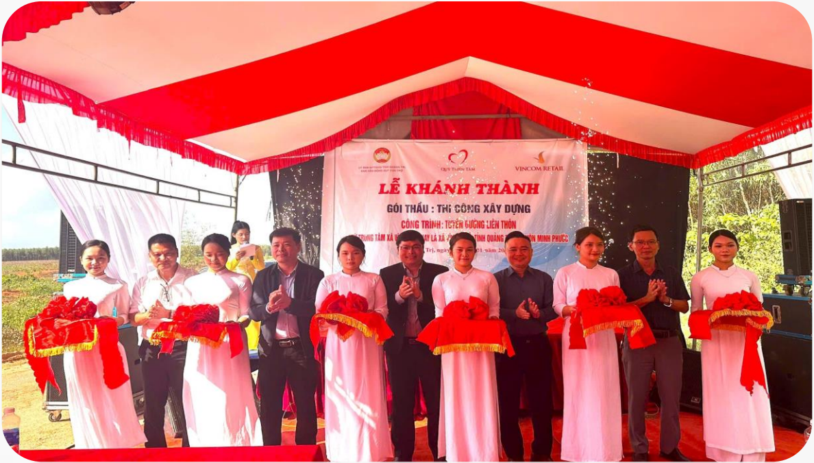
Khánh thành tuyến đường liên thôn tại xã Vĩnh Thủy

H ướng tới chào mừng Đại hội đại biểu toàn quốc Mặt trận Tổ quốc Việt Nam nhiệm kỳ 2026 - 2031, Ủy ban Mặt trận Tổ quốc Việt Nam tỉnh Quảng Trị đã phát động đợt thi đua đặc biệt trong toàn hệ thống Mặt trận và các tổ chức thành viên. Các phong trào thi đua được triển khai sâu rộng, gắn với thực hiện các cuộc vận động lớn và phong trào thi đua yêu nước, góp phần chăm lo đời sống Nhân dân, củng cố khối đại đoàn kết toàn dân tộc.