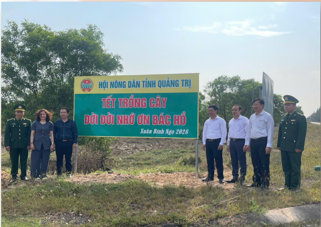
Các đồng chí lãnh đạo gắn biển công trình

Thông qua phong trào vườn và cải tạo vườn tạp, cây bóng mát, vừa tạo cảnh Tết trồng cây, các cấp Hội góp phần tạo sinh kế bền vững cho hội viên nông dân. Bên cạnh việc tổ chức trồng cây tập trung trong dịp đầu xuân, các cấp Hội còn vận động hội viên nông dân duy trì phong trào trồng cây quanh năm, đặc biệt trong khuôn viên gia đình, vườn nhà và trên các tuyến đường thôn, xóm. Nhiều hộ nông dân đã tích cực trồng thêm cây ăn quả, cây lấy gỗ và cây bóng mát, vừa tạo cảnh quan xanh, sạch, đẹp, vừa nâng cao giá trị kinh tế. Có thể khẳng định rằng, phong trào Tết trồng cây “Đời đời nhớ ơn Bác Hồ” đã trở thành hoạt động ý nghĩa, lan tỏa tinh thần trách nhiệm của cán bộ, hội viên nông dân trong việc bảo vệ môi trường, góp phần xây dựng quê hương Quảng Trị ngày càng xanh – sạch – đẹp và phát triển bền vững./.