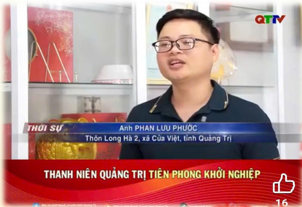
Thanh niên tiêu biểu tiên phong trong phong trào khởi nghiệp trên địa bàn tỉnh Quảng Trị (Ảnh: BBT tổng hợp)

Xuân Bính Ngọ 2026 vì thế không chỉ là mùa của sum vầy, mà còn là mùa của hành động - nơi khát vọng thanh niên hòa cùng nhịp đập của quê hương, để mỗi bước tiến hôm nay trở thành nền tảng vững chắc cho tương lai mai sau./.