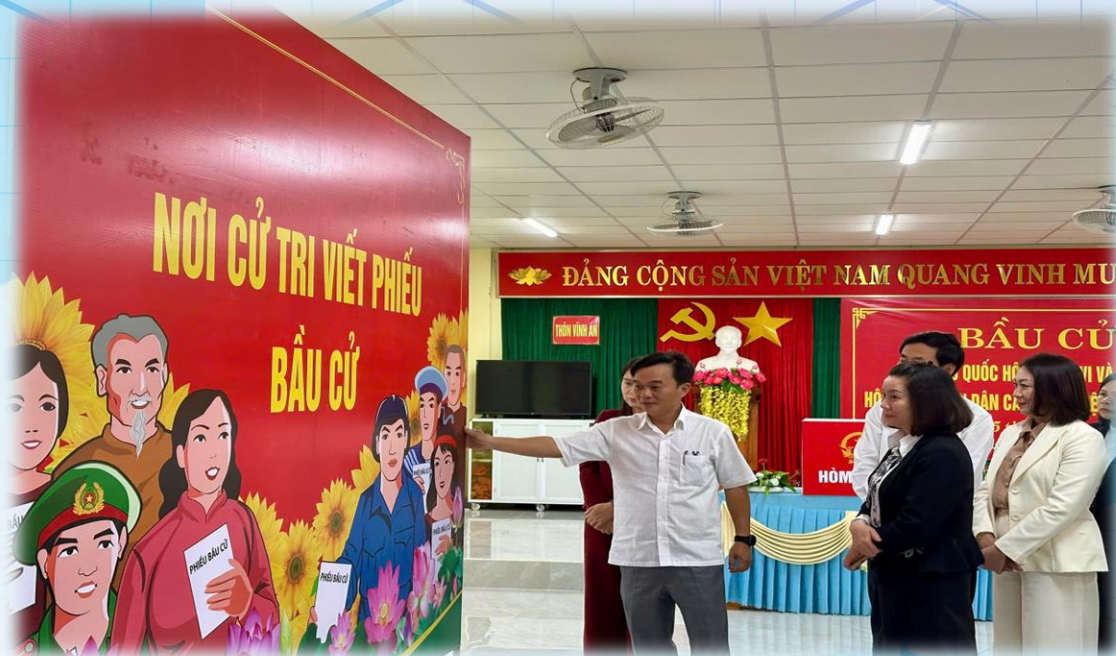
Phó Bí thư Tỉnh ủy, Chủ tịch Ủy ban MTTQVN tỉnh Nguyễn Chiến Thắng kiểm tra công tác bầu cử tại các địa phương

T rong không khí phấn khởi của những ngày đầu nhiệm kỳ mới sau thành công của Đại hội Đảng các cấp, cùng với việc cả nước triển khai mô hình chính quyền địa phương hai cấp, cuộc bầu cử đại biểu Quốc hội khóa XVI và đại biểu Hội đồng nhân dân các cấp nhiệm kỳ 2026 - 2031 trên địa bàn tỉnh đã diễn ra dân chủ, đúng pháp luật, an toàn và thành công tốt đẹp. Đóng góp vào thành công chung đó, hệ thống Mặt trận Tổ quốc Việt Nam các cấp trong tỉnh đã phát huy vai trò nòng cốt trong công tác hiệp thương, giới thiệu người ứng cử; đẩy mạnh tuyên truyền, vận động cử tri; đồng thời thực hiện tốt nhiệm vụ giám sát các khâu