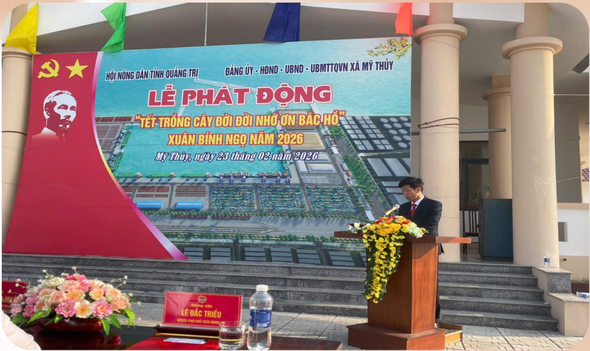
Hội Nông dân tỉnh phối hợp tổ chức Hoạt động Tết trồng cây “đời đời nhớ ơn Bác Hồ năm 2026”

Những ngày đầu năm 2026, các cấp Hội Nông dân trên địa bàn tỉnh Quảng Trị đã đồng loạt tổ chức ra quân trồng cây xanh, tạo khí thế thi đua sôi nổi trong cán bộ, hội viên và nông dân toàn tỉnh. Hoạt động mang ý nghĩa sâu sắc của phong trào “Tết trồng cây – Đời đời nhớ ơn Bác Hồ”, phong trào do Chủ tịch Hồ Chí Minh khởi xướng từ năm 1959 và đến nay đã trở thành nét đẹp truyền thống mỗi dịp đầu xuân.