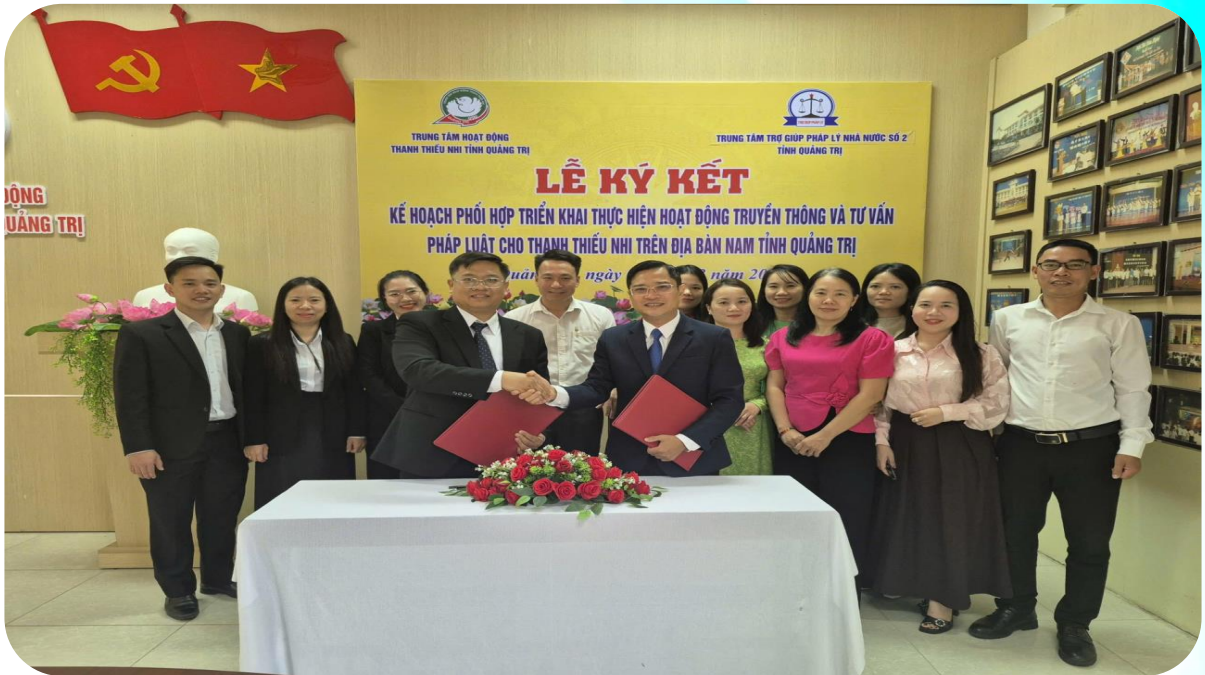
Trung tâm Hoạt động TTN tỉnh Quảng Trị ký kết phối hợp tổ chức hoạt động truyền thông và tư vấn pháp luật cho TTN trên địa bàn phía Nam tỉnh Quảng Trị

V iệc sắp xếp, tinh gọn tổ chức bộ máy theo chủ trương chung không chỉ dừng lại ở giảm đầu mối, mà quan trọng hơn là nâng cao hiệu lực, hiệu quả hoạt động. Thực tiễn tại Trung tâm Hoạt động Thanh thiếu nhi tỉnh Quảng Trị, đơn vị được thành lập trên cơ sở sáp nhập hai cơ quan có chức năng tương đồng đã bước đầu cho thấy những chuyển biến tích cực, rõ nét, khẳng định tính đúng đắn của chủ trương này