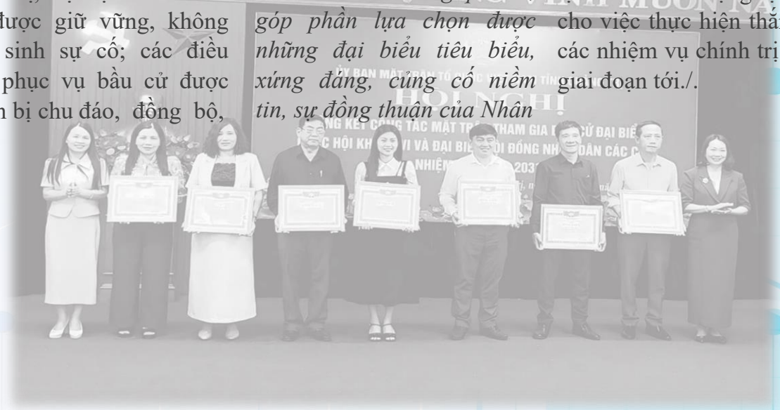
Lãnh đạo UBMTTQVN tỉnh trao bằng khen cho những cá nhân có thành tích xuất sắc trong công tác bầu cử

Cuộc bầu cử đại biểu Quốc hội khóa XVI và đại biểu Hội đồng nhân dân các cấp nhiệm kỳ 2026 - 2031 đã khép lại với nhiều dấu ấn rõ nét, thể hiện tinh thần dân chủ, kỷ cương và sự đồng thuận cao trong Nhân dân. Qua thực tiễn tổ chức, vai trò của Mặt trận Tổ quốc Việt Nam các cấp tiếp tục được khẳng định sâu sắc, không chỉ trong việc kết nối, tập hợp ý chí, nguyện vọng của cử tri mà còn góp phần lan tỏa niềm tin, củng cố sự gắn bó giữa Nhân dân với Đảng và Nhà nước. Những kết quả đạt được là tiền đề quan trọng để tiếp tục phát huy sức mạnh khối đại đoàn kết toàn dân tộc, tạo khí thế và động lực mới cho việc thực hiện thắng lợi các nhiệm vụ chính trị trong giai đoạn tới./.