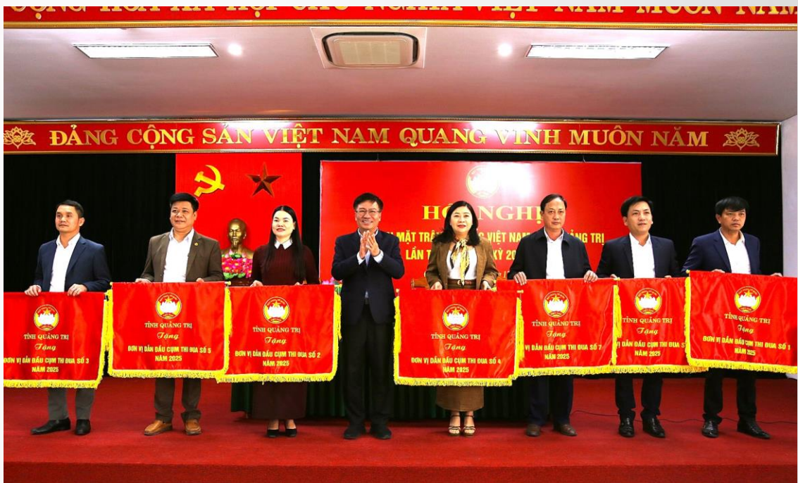
Các xã, phường, đặc khu nhận cờ thi đua xuất sắc trong công tác Mặt trận năm 2025 (Ảnh: BBT tổng hợp)

T hi đua, khen thưởng là động lực quan trọng nhằm khơi dậy tinh thần trách nhiệm, sáng tạo và công hiến của cán bộ, công chức, viên chức cùng các tầng lớp Nhân dân trong quá trình thực hiện nhiệm vụ chính trị. Trong hệ thống Mặt trận Tổ quốc Việt Nam các cấp, công tác thi đua, khen thưởng có vai trò đặc biệt quan trọng trong việc động viên, khuyến khích các tập thể và cá nhân tích cực tham gia các cuộc vận động, phong trào thi đua do Đảng, Nhà nước và Mặt trận phát động. Đối với cấp cơ sở, đặc biệt là Ủy ban MTTQ Việt Nam cấp xã, đây là lực lượng trực tiếp gắn bó với Nhân dân và tổ chức triển