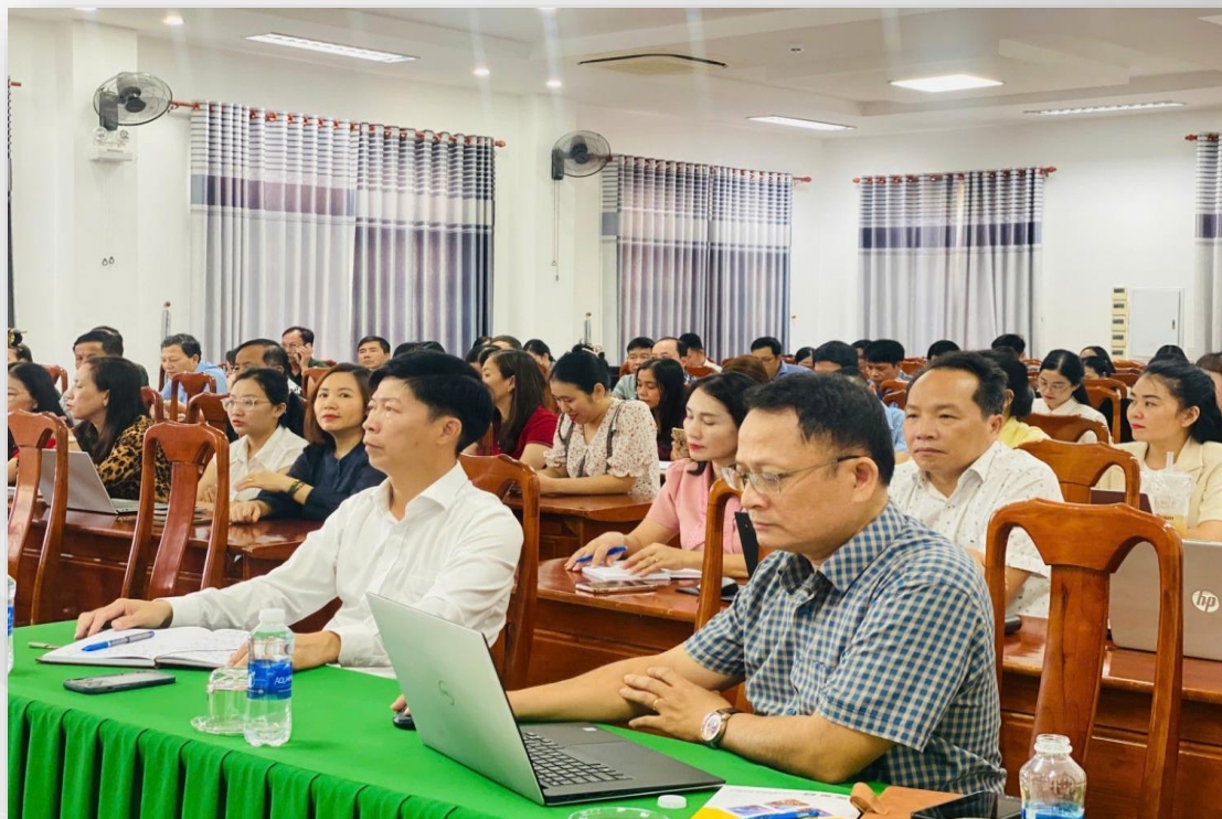
Tổ chức tập huấn nâng cao kỹ năng công nghệ thông tin, chuyển đổi số cho cán bộ cơ quan Ủy ban MTTQ Việt Nam tỉnh Quảng Trị

Với tầm nhìn đến năm 2030, hệ thống MTTQ Việt Nam tỉnh Quảng Trị phấn đấu trở thành mô hình kiểu mẫu về chuyển đổi số, xây dựng “Mặt trận thông minh” - nơi niềm tin của Nhân dân được củng cố bởi sự minh bạch tuyệt đối của công nghệ và sự tương tác đa chiều. Dù còn nhiều thách thức, với quyết tâm cao của toàn hệ thống, MTTQ Việt Nam Quảng Trị sẽ tạo nên những đột phá mới, đóng góp xứng đáng vào sự phát triển của tỉnh trong kỷ nguyên số./.