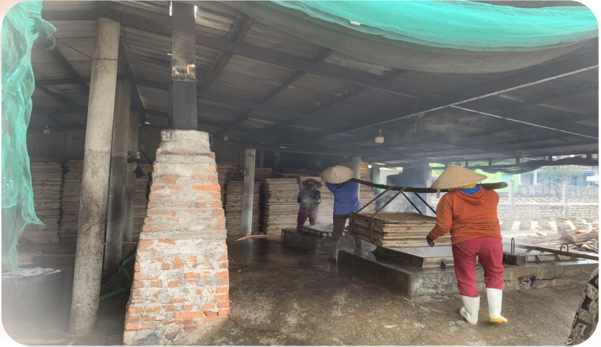
Các thành viên Tổ đang tham gia sản xuất

V ới mục tiêu thực hiện có hiệu quả công tác giảm nghèo đa chiều, bền vững, hạn chế tái nghèo và phát sinh hộ nghèo, năm 2023, Ủy ban MTTQ Việt Nam tỉnh đã khảo sát và hỗ trợ nguồn vốn để xây dựng mô hình “Tổ hợp tác thu mua, bảo quản, chế biến thủy hải sản Tân Việt” ở thôn Long An, xã Cửa Việt với tổng kinh phí 225 triệu đồng góp phần tạo sinh kế, nâng cao thu nhập giúp nhiều hộ dân vươn lên thoát nghèo ổn định cuộc sống.