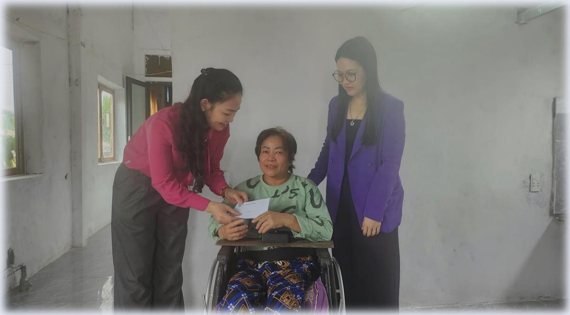
Lãnh đạo Hội LHPN tỉnh Quảng Trị trao quà cho người yếu thể nhận dịp Tết Bính Ngọ 2026

Xuân mới lại về trên khắp các miền quê Quảng Trị. Từ vùng đồng bằng đến miền núi, từ thành thị đến nông thôn, những hoạt động sẻ chia yêu thương vẫn tiếp tục được các cấp Hội duy trì và lan tỏa không ngừng. Chính từ những hành động thiết thực, chân thành ấy, mùa xuân của tình người, của sự đoàn kết và trách nhiệm cộng đồng đang được nhân lên mạnh mẽ, góp phần xây dựng quê hương Quảng Trị ngày càng giàu mạnh, ấm áp và nghĩa tình./.